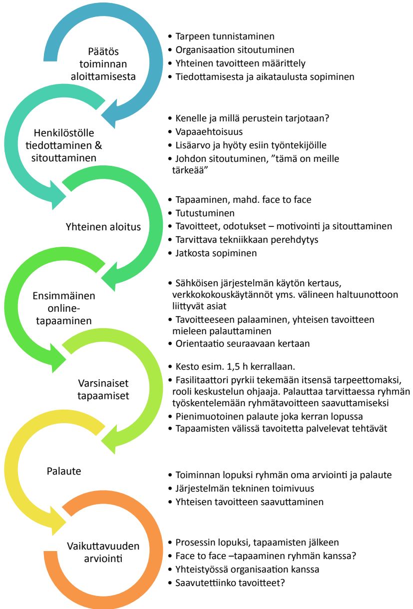
Kuvio 3 eMessin vaiheet