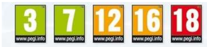
Kuvio 1. Pelien ikäraajat. (muokattu 21.11.2013) Pegi.fi