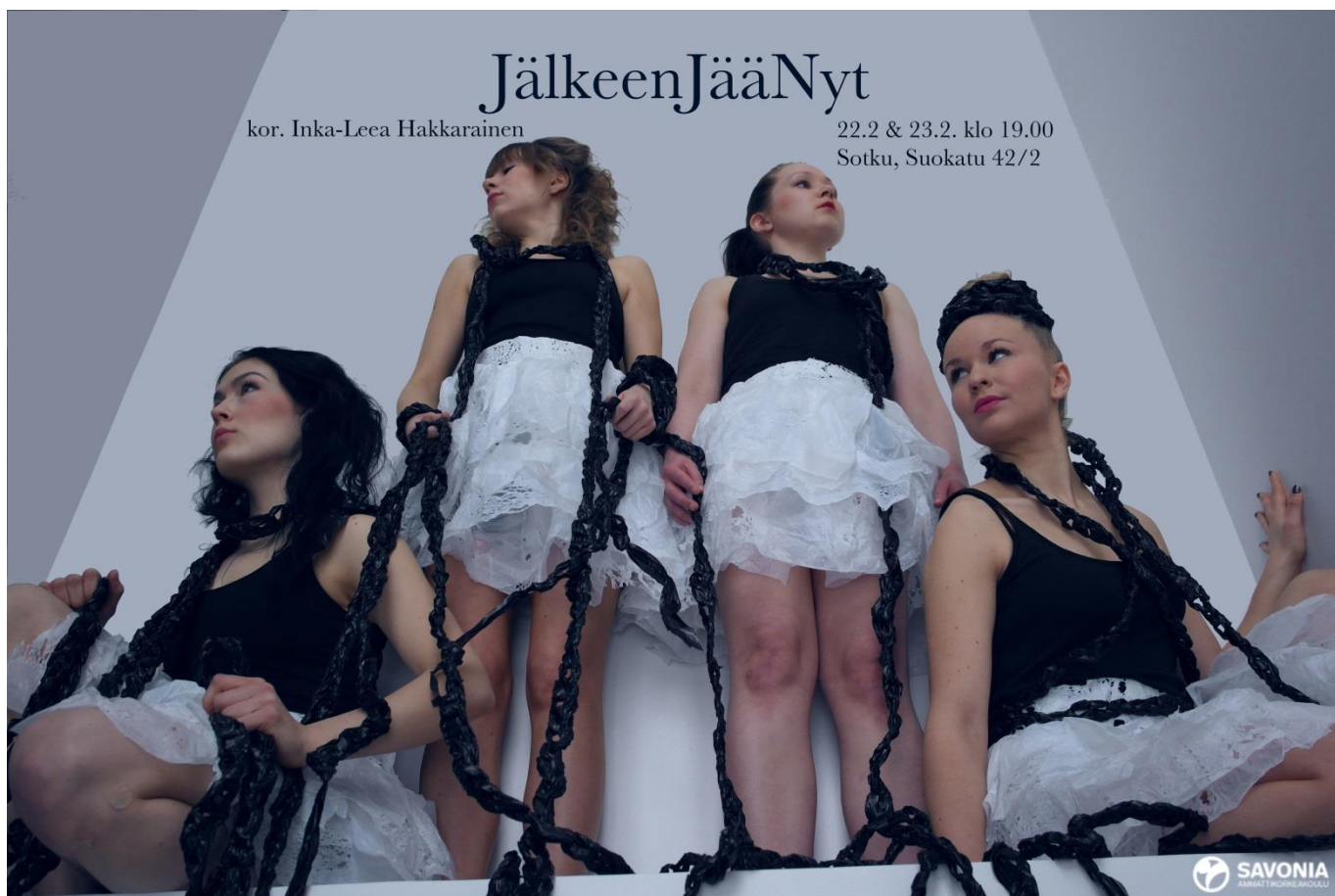
Teoksen virallinen juliste. © Inka-Leea Hakkarainen

Tuotannollisesti Lähtölaukaus-tanssifestivaali onnistui yli odotusten. Visuaalisesti festivaalin ilme oli yhtenäinen ja kaikki koreografit puhalsivat yhteen hiileen mainonnassaan, jolloin yleisö löysi festivaalin ja katsojia riitti. Saimme palstatilaa lehdistä ja näkyvyyttä festivaaleille internetin kautta niin valtakunnallisesti kuin paikallisestikin. Muutamat tanssialan suurten suosittujen suomalaisten internetsivujen ylläpitäjät vaikuttivat ensin puhelimesta puhuessa vastahakoisilta julkaisemaan tiedotettamme, mutta yllätyimme positiivisesti, kun tiedote kuitenkin julkaistiin. Opin paljon oman aktiivisuuden ja periksiantamattomuuden merkityksestä. Rohkea avun pyytäminen ja kysyminen tuottaa tulosta ja organisaatiot ottavat tarjotun tiedon vastaan ja välittävät eteenpäin. Budjettia meillä ei lähtölaukauksessa ollut, joten mainonnasta emme voineet maksaa mitään. Ahkeruudella ja monipuolisesti tietoa levittämällä kuitenkin saa paljon aikaan. Internet ja erityisesti sosiaalinen media valjastettuna mainontaan on kuitenkin nyky maailmassa oman näppituntumani mukaan tehokkaampi keino tavoittaa kohdeyleisö kuin esimerkiksi printtimediaan sijoittaminen.