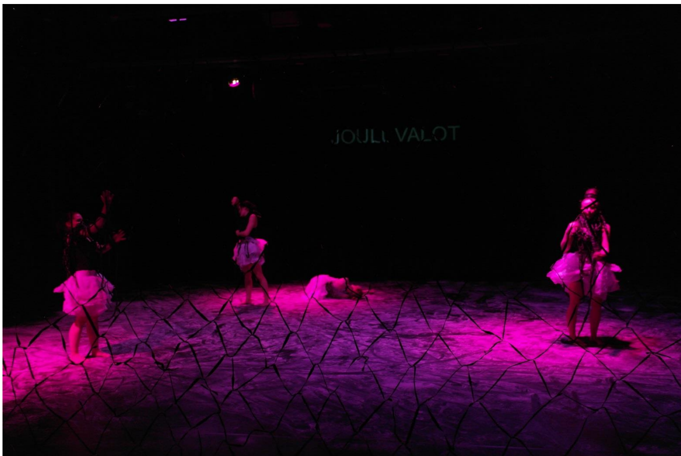
Kohtauksesta Minäminä © Anna Stenberg

keen vaellus jatkuu. Valot kiihtyvät ja hieman jopa sokaisevat yleisöä, kunnes lopussa sininen, sees- teinen valo valaisee pysähtyneet tanssijat ja laulun jälkeen valot himmenevät nopeasti pois.