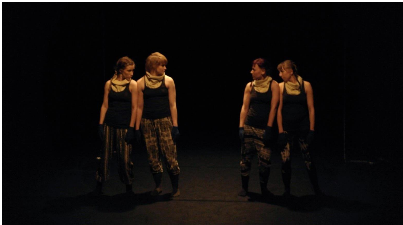
Esityskuva, kohtauksesta Still Light © Anna Stenberg

Vaatetukseen kuului harmaat nyrkkeilijätöpit ompelemillani luonnonvalkoisilla turtle- kaulureilla, musta-valko kuviolliset housut jotka pujoutettiin mustiin sukkiin. Kädet puettiin muovisella tarttumapinnalla varustettuihin sähkönsinisiin hanskoihin.