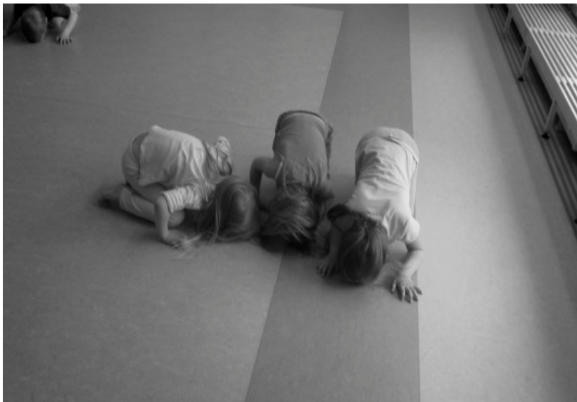
Kuva 1: Kolme päätä lattiassa.

Laululeikin jälkeen siirryimme toiseen leikkiin, jonka ideana oli, että lapset saivat juosta salissa vapaasti musiikin tahdissa. Kun musiikki loppui, ohjaaja sanoi jonkin kehonosan, jolla lapsen tulisi koskettaa lattiaa. Hitaimmin lattiaa koskettanut lapsi tippui leikistä pois. Kun lapsia oli jäljellä enää muutamia, annoimme ohjeeksi laittaa lattiaan esimerkiksi kolme kättä. Näin lapset saivat hieman enemmän aivojumppaa. Tämän harjoitteen jälkeen otimme vielä yhteisen laululeikin, Fröbelin Palikoiden Huugi-guugi-laululeikin (Fröbelin Palikat 1991, 3).