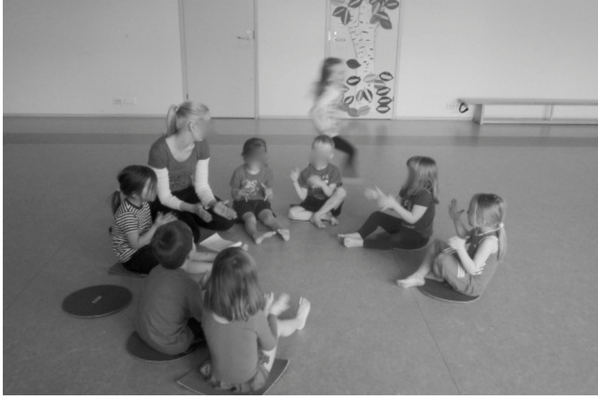
Kuva 2: Kannustuspiirin hurmassa.

Teemaan tutustumisen jälkeen siirryimme ensimmäiseen harjoitteeseen. Harjoitteena oli suurimmalle osalle tuttu maa-, meri-, laiva-leikki sovellettuna väriteemaan. Leikin ideana oli se, että salin eri osiin oli aseteltu yksi sininen, yksi keltainen ja yksi punainen alusta. Ohjaajan huutaessa jonkin näistä väreistä, lapset juoksivat väriä kohden. Harjoituskierrosten jälkeen, viimeisenä värin luona ollut putosi pois ja pääsi ohjaajan luokse huutamaan seuraavan värin. Viimeinen leikissä mukana ollut oli voittaja.