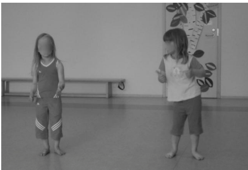
Kuva 4: Sutsisatsi

Kannustuspiirin jälkeen leikimme Fröbelin Palikoiden Sutsisatsi-laululeikin (Fröbelin Palikat 1993, 6). Ohjaajat näyttivät lapsille esimerkkiä. Leikimme laululeikin kolmeen kertaan. Kahdella ensimmäisellä kerralla yhdessä ja kolmannella kerralla niin, että halukkaat esittivät laululeikin niille, jotka eivät halunneet kolmatta kertaa siihen osallistua.