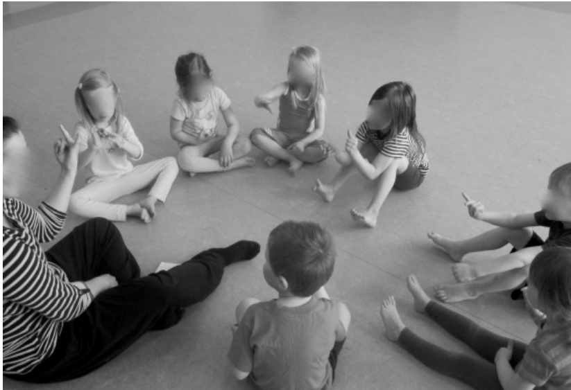
Kuva 3: Viisi vauhtiveikkoa.

Loppuleikkiä, Rikkinäistä puhelinta leikimme tällä kertaa numeroita sisältävillä lauseilla tai sanapareilla, kuten kaksi kissaa. Tämän jälkeen pidimme loppupiirin ja pyysimme lapsilta palautetta toimintakerrasta, hymiökortteja apuna käyttäen. Lopuksi kiitimme lapsia tästä kerrasta ja kerroimme milloin tulemme seuraavan kerran ja mikä ensikerran teema on.