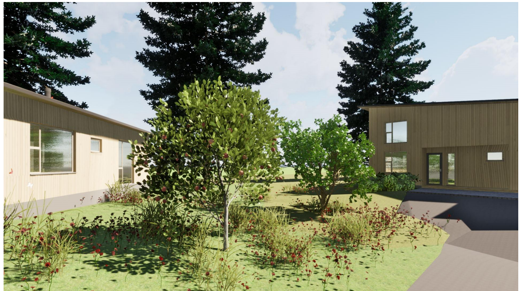
NÄKYMIÄ ALUEELTA TONTINKÄYTTÖSUUNNITELMA TÖNSBERGINKATU 10 © Teija Kokko