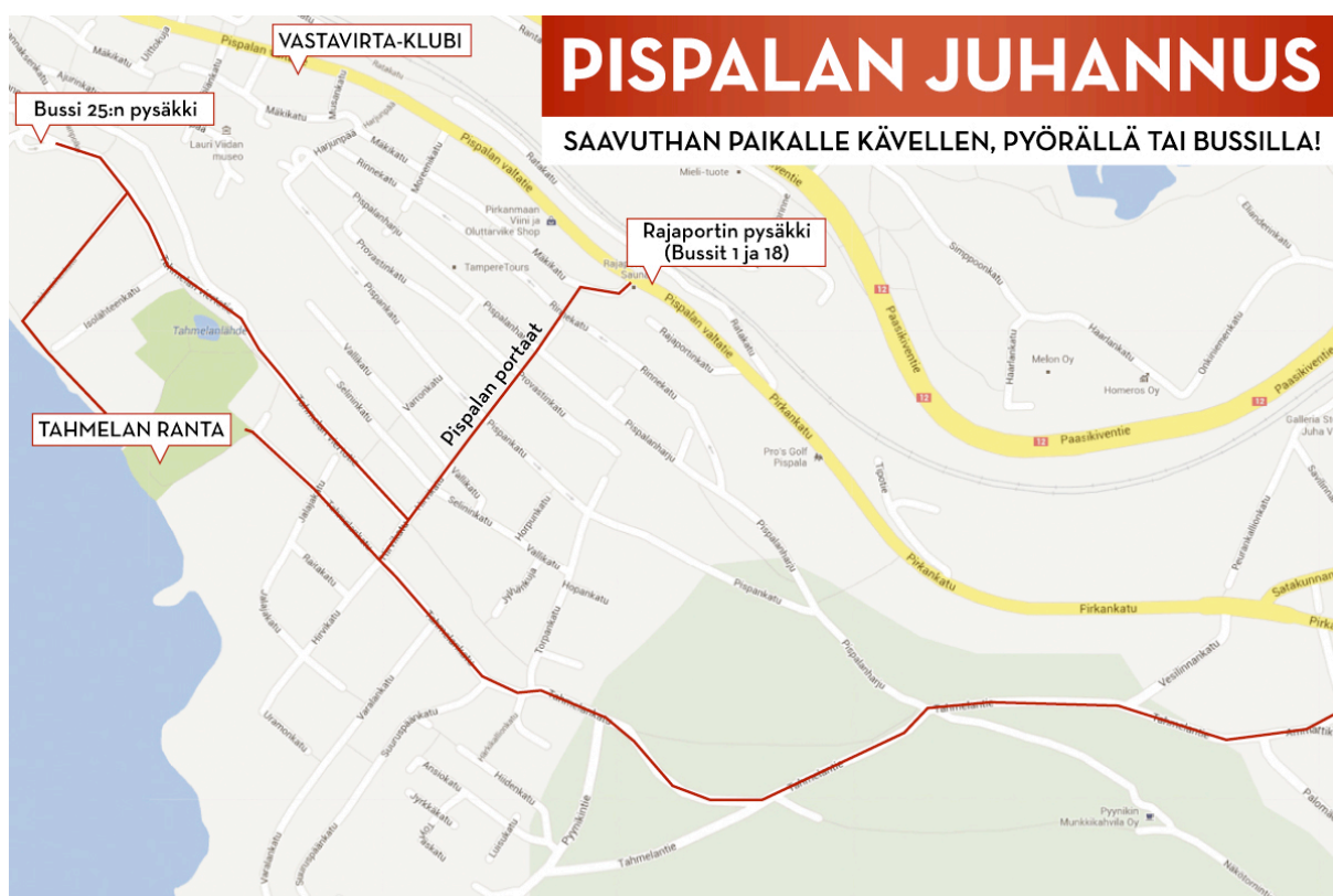
Kuva 2. Festivaalialueen kartta.

Tahmelan ranta on ihanteellinen pienimuotoisen tapahtuman järjestämiseen, mutta kasvumahdollisuudet ovat rajalliset. Alue rajautuu kahdesta suunnasta Pispalan ryytimaihin ja yhdeltä sivulta Pyhäjärveen. Heti alueen takareunasta alkaa asutus, joka tulee ottaa huomioon tapahtumaa rakennettaessa.