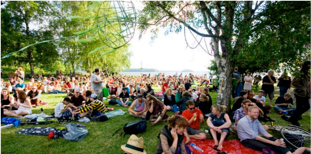
Kuva 1. Tahmelan ranta. Pispalan juhannus -festivaali 2013.

Pispala on yhdistysten luvattu kaupunginosa. Siksi oli loogista alkaa etsiä yhteistyökumppaneita ja tapahtumapaikkaa juhannusfestivaalille sieltä. Aikojen kuluessa Pispalasta on muotoutunut rikas kulttuuriympäristö, jossa yhä edelleen asuu monia lahjakkaita ja omaperäisiä kulttuurihenkilöitä. Esimerkiksi Lauri Viita, Hannu Salama ja Aaro Hellaakoski ovat asuneet ja vaikuttaneet Pispalassa. (Lahtinen, 2012.)