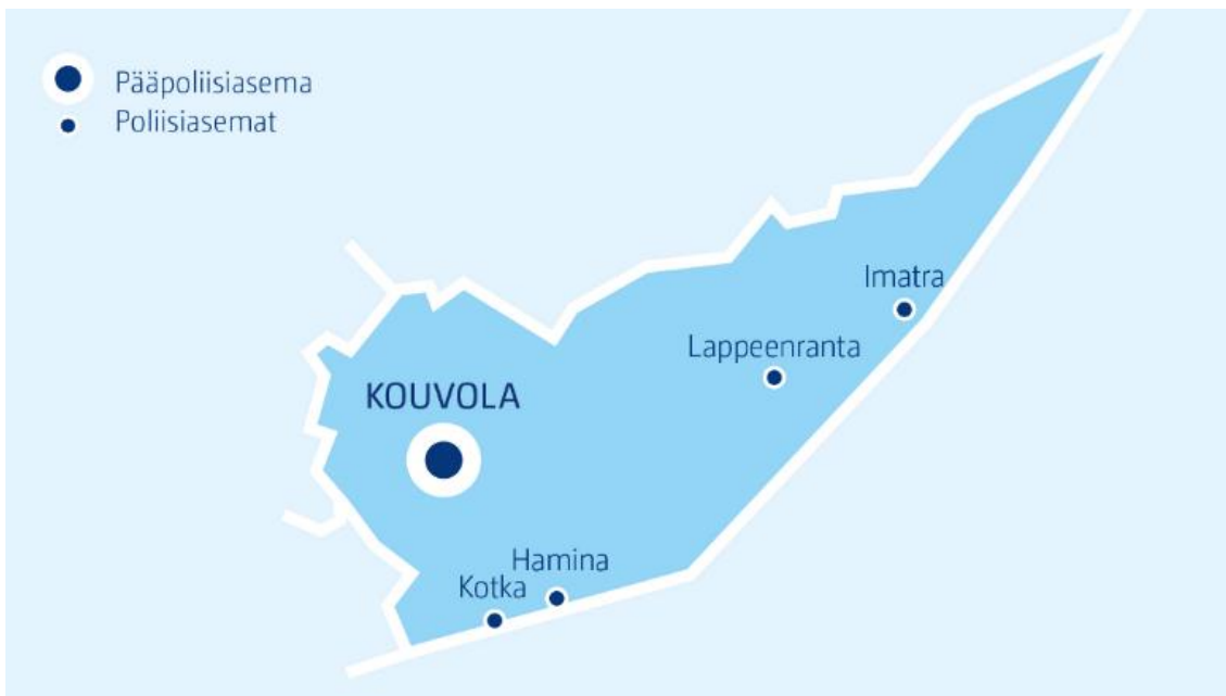
Kuva 1. Kaakkois-Suomen poliisilaitoksen aluekartta (, luettu 5.12.2022.)