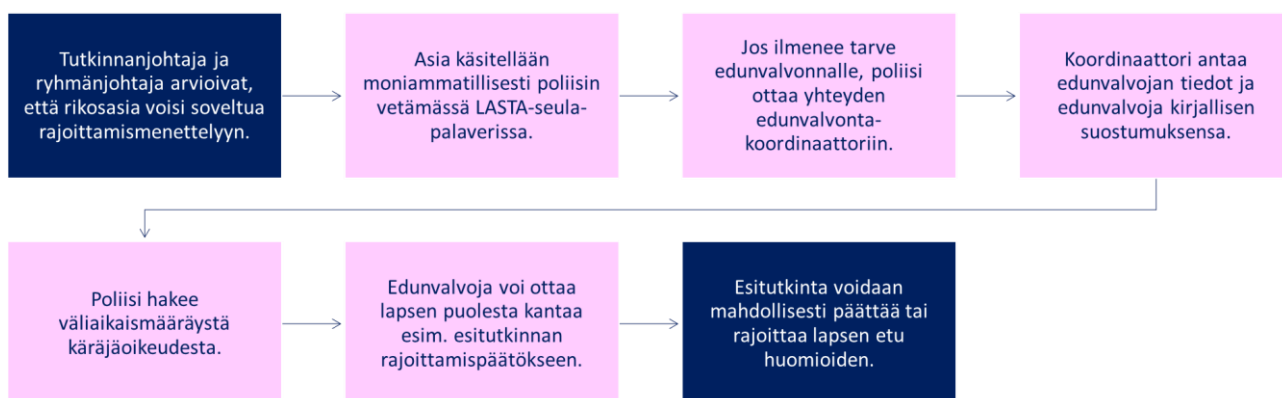
Kaavio 3. Lasten edunvalvonta rikosten esikäsittelyn aikana. (Heikkinen 2023.)

Alla olevassa kaaviossa havainnollistetaan haastattelusta saatujen tietojen perusteella, kuinka Kaak-kois-Suomessa on toteutettu lapsiin kohdistuvien rikosasioiden esiselvittelyä ja esiselvittelyn aikaista edunvalvontaa vuonna 2022.