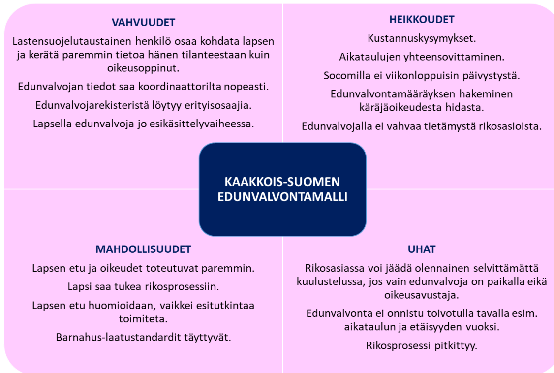
Kaavio 4. SWOT-kaavio Kaakkois-Suomen edunvalvontamallista (Heikkinen 2022.)

SWOT-kaavioon on koottu haastatteluissa esille tulleita keskeisiä asioita. Vahvuudet ja heikkoudet (Strengths & Weaknesses) ovat asioita lyhyellä aika välillä. Mahdollisuudet ja uhat (Opportunities & Threats) taas ovat asioita pitkällä aikavälillä. Kaaviota on käytetty apuna myös seuraavan luvun johtopäätöksiä muodostettaessa.