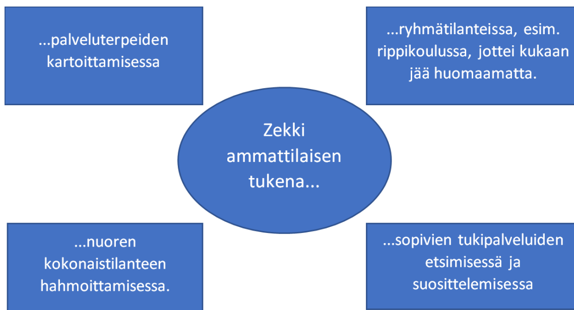
Kuvio 2. Zekki-palvelu ammattilaisen tukena

Zekin tarjoaman alkukartoituksen avulla myös kirkon nuorisodiakoni voisi helpommin tarkastella nuoren kokonaisvaltaista tilannetta. Toinen kirkon nuorisodiakoni pohti myös sitä, että järjestelmällisellä organisoinnilla Zekki-palvelua olisi mahdollista hyödyntää rippikouluryhmissä, koska huonosti voivat nuoret saattavat helposti jäädä huomaamatta rippikoulun lyhyen keston vuoksi.