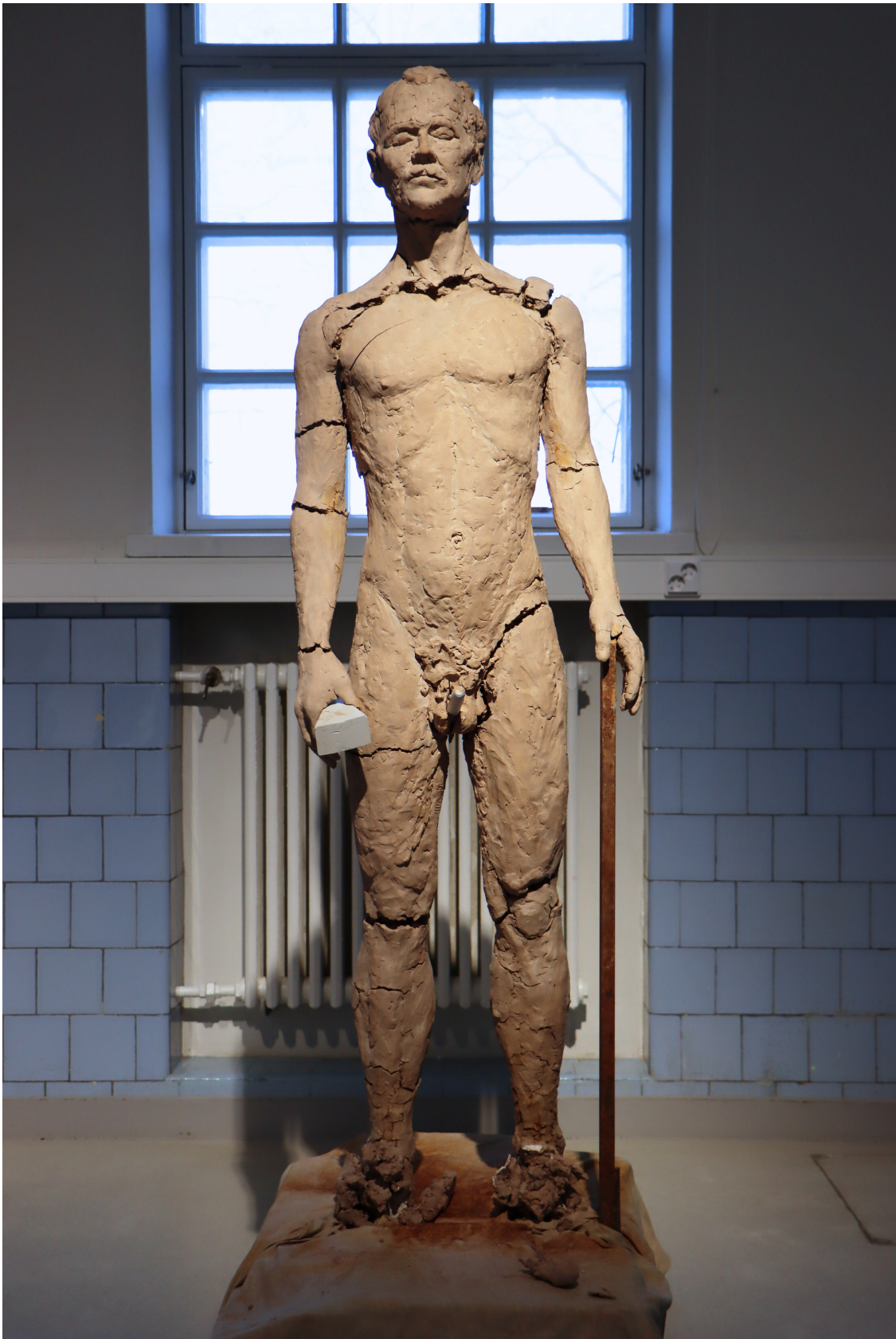
3. veistos "Väki ja valta"-peliperformanssin ja opinnäytetyönäyttelyn jälkeen kuivuneena, Taidekeskus Mältinranta, 18.4.2023