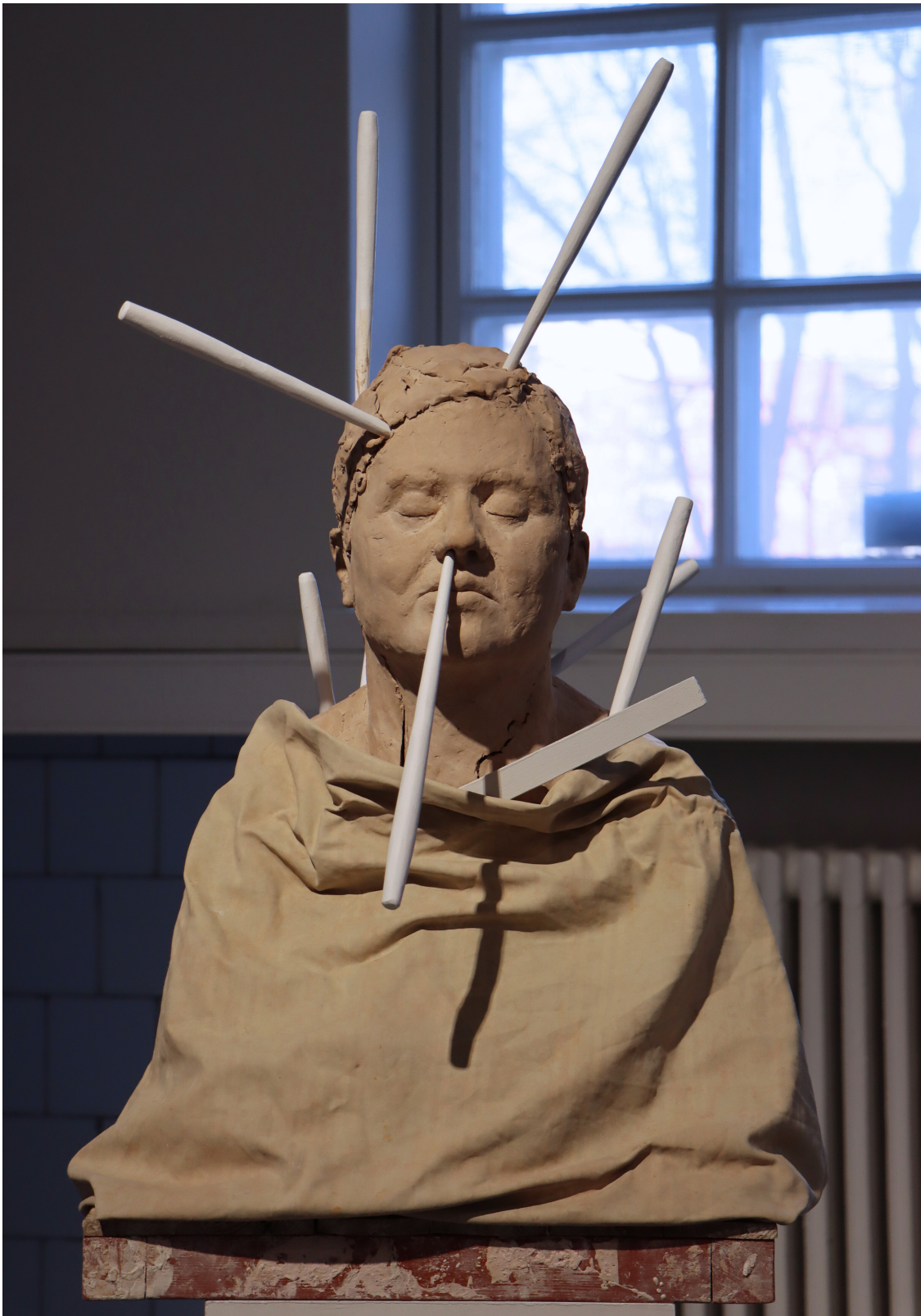
1. veistos "Väki ja valta"-peliperformanssin ja opinnäytetyönäyttelyn jälkeen kuivuneena, Taidekeskus Mältinranta, 18.4.2023