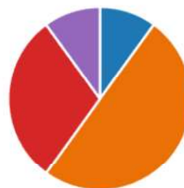
Kuva 2. Laskurahoituksen edullisuus