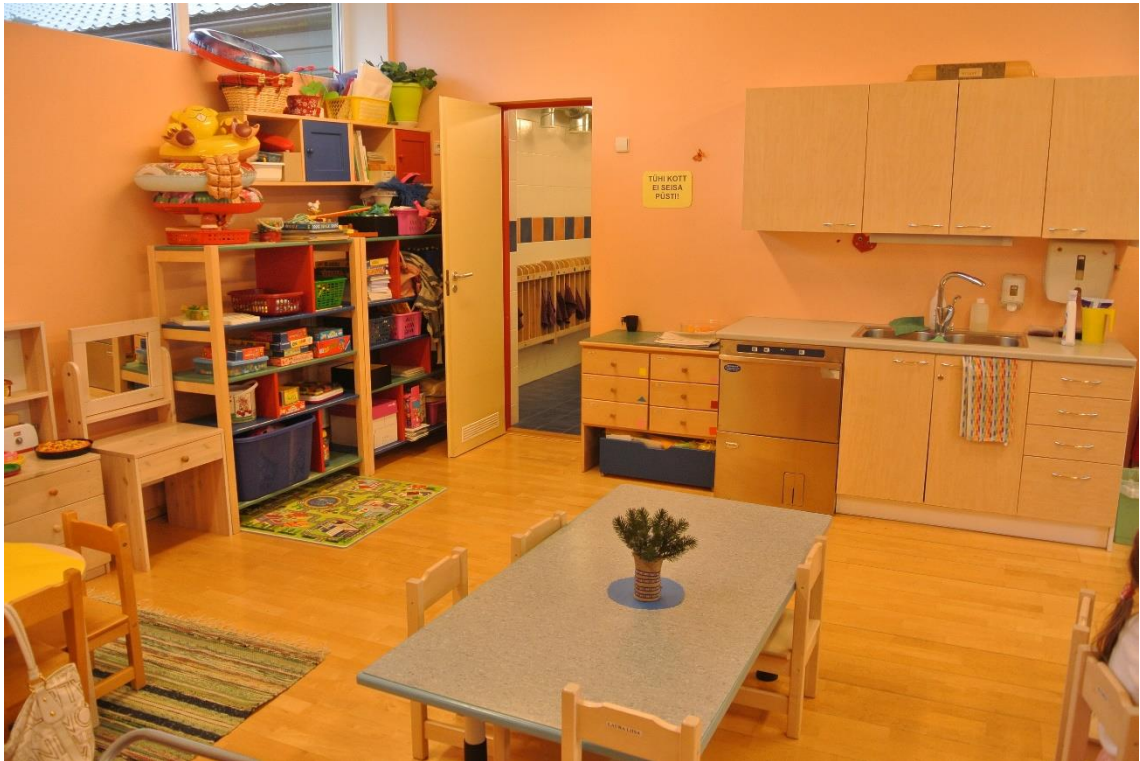
KUVA 7. Ryhmähuone

Kaikki ryhmätilat ovat kooltaan samanlaisia. Pieniä eroja on sisustuksessa. Kuvassa 7 näkyy yksi ryhmähuone. Ryhmissä kaikki lapset ovat yhdenmukaisesti samanikäisiä, esimerkiksi 3-vuotiaiden ryhmässä ovat sen ikäiset lapset. Päiväkodissa on vain kaksi ryhmää, joissa keskenään on yhdistetty kaksi ikäluokkaa. Päiväkodissa on kaksi esikouluryhmää, joita samat opettajat ovat ohjanneet kolmannelta ikävuodesta alkaen.