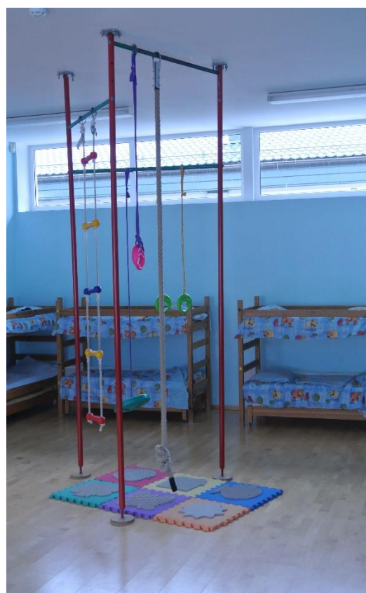
KUVA 6. Makuu- ja leikkihuone ja kiipeilyteline

Lapset käyttävät mielellään välineitä, joita heille tarjotaan. Kiipeilyteline antaa lapselle mahdollisuuden kiipeillä ja roikkua luvalla myös sisätiloissa. Huoneiden värimaailma on lapsiläheinen ja värikäs, mutta samalla myös rauhoittava. Nurkassa oleva iso sohva huokuu kodinomaisuutta ja lattiamatot sekä hyllyillä olevat kukat korostavat sitä entisestään.