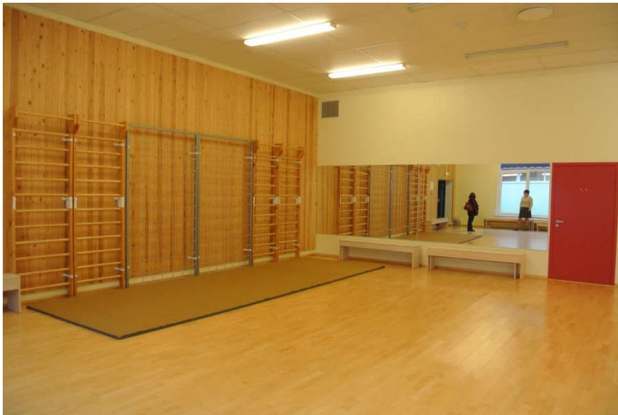
KUVA 8. Sali

on myös erillinen jumppavälinevarasto ja iso käsityöhuone. Varajohtajan mukaan lastentarhassa toimivat myös liikunnan- ja musiikinopettajat. Salin ikkunasta on näkymä koulun uimahallille, jota käyttävät kerran viikossa myös isommat lastentarhanlapset.