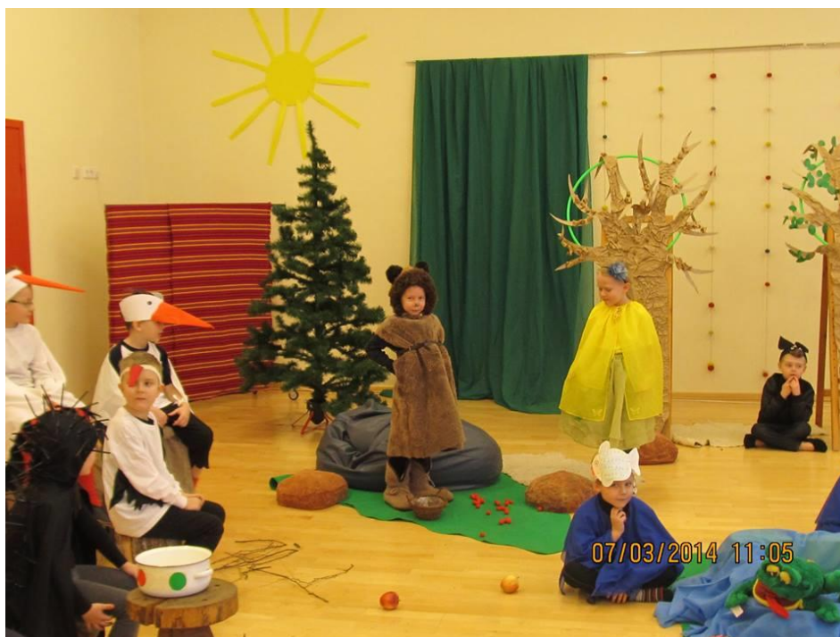
KUVA 11. 5-vuotiaiden esitys teatterifestivaalilla

Lapset pääsevät myös itse kokeilemaan erilaisia soittimia ja rytmittämään päiväkodin musiikinopettajan ohjeistuksella.