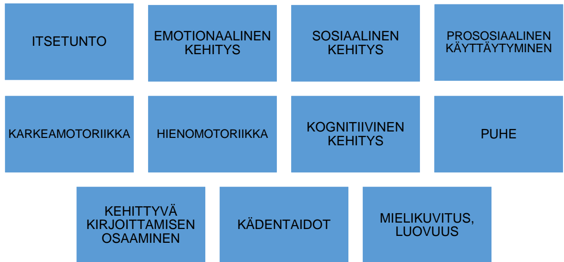
KAAVIO 3. 3–5-vuotiaiden arvioinnin alueita.

Yksi haastateltavista kertoi, että 6–7-vuotiaiden kehitystä arvioidaan täyttämällä ennen koulun ensimmäiselle luokalle siirtymistä kouluvalmiuskortti. Seuraavalla sivulla taulukossa 5 näkyvät arvioitavat osa-alueet.