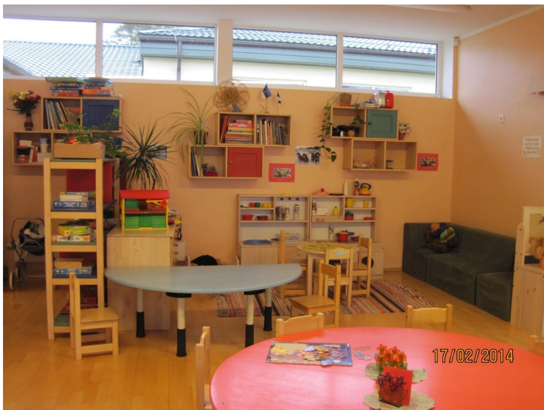
KUVA 5. Ryhmähuone ja kotileikkipiste

Ryhmässä jokaisella lapsella on oma tuoli ja lapset jakaantuvat noin 3-4 pöytäseurueeseen. Ryhmätilassa sijaitsee myös aikuiselle tarkoitettu työpöytä tietokoneineen. Huoneessa on lisäksi runsaasti hyllytilaa, jossa on pelejä ja askartelutarvikkeita. Lisäksi ryhmähuoneessa on keittiönurkkaus: lavaaari, kaappeja ja astianpesukone. Jokaisessa ryhmässä tiskataan omatoimisesti käytettävät ruokailuvälineet. Lapsille on järjestetty iso nurkkaus kotileikkejä varten.