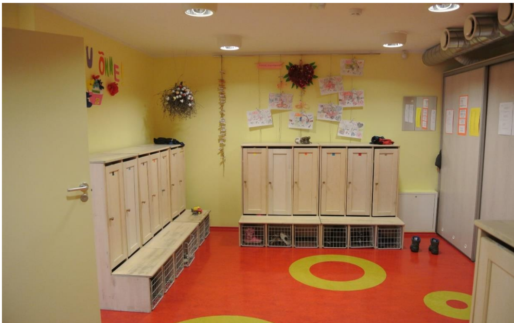
KUVA 3. Eteinen