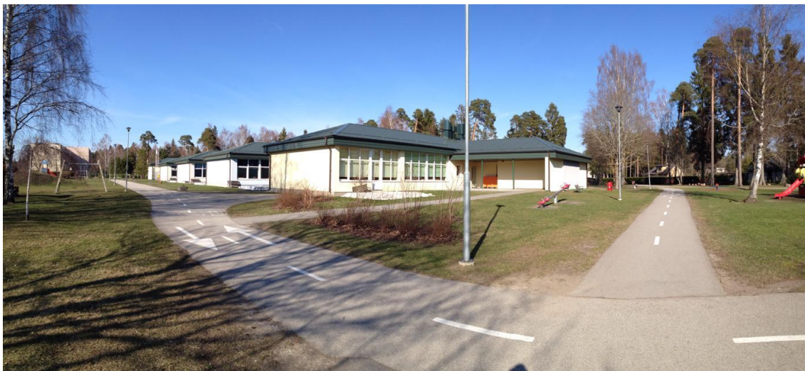
KUVA 2. Rakennus

Vierailuajamme alkaa noin klo 10. Päiväkodin varajohtaja on meitä vastassa. Tapaamme päiväkodin pääovien luona, jota kautta pääsee myös johtajan ja varajohtajan työhuoneisiin ja henkilökunnan tiloihin. Tutustumisen jälkeen kierrämme taloa, jolloin varajohtaja esittelee meille taloa ja perehdyttää päiväkodin tapoihin.