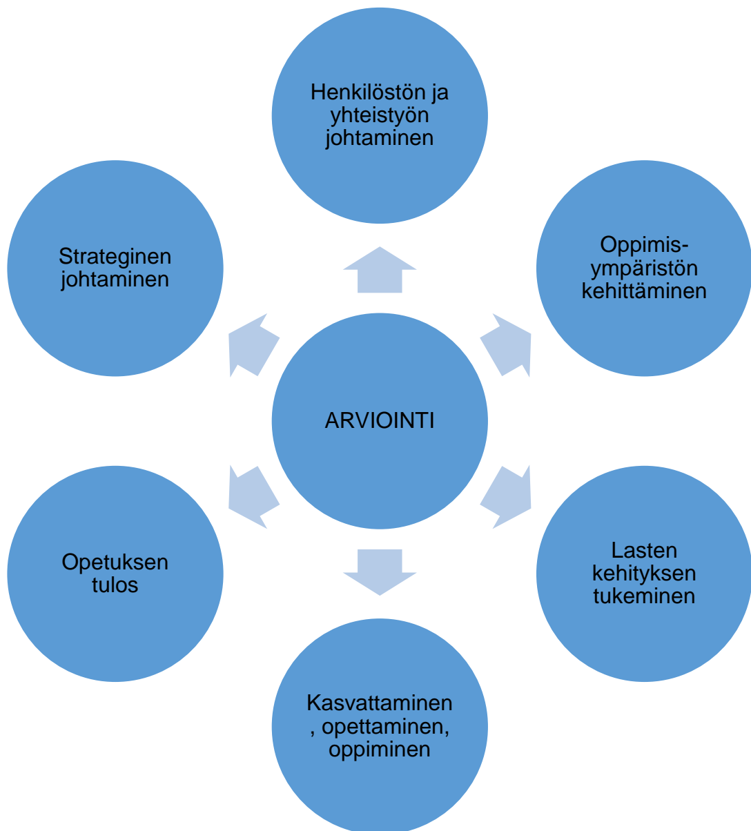
KAAVIO 2: Arvioinnin osat

Kaaviossa 2 ovat varhaiskasvatuksen arvioinnin osat yleisesti Virossa.