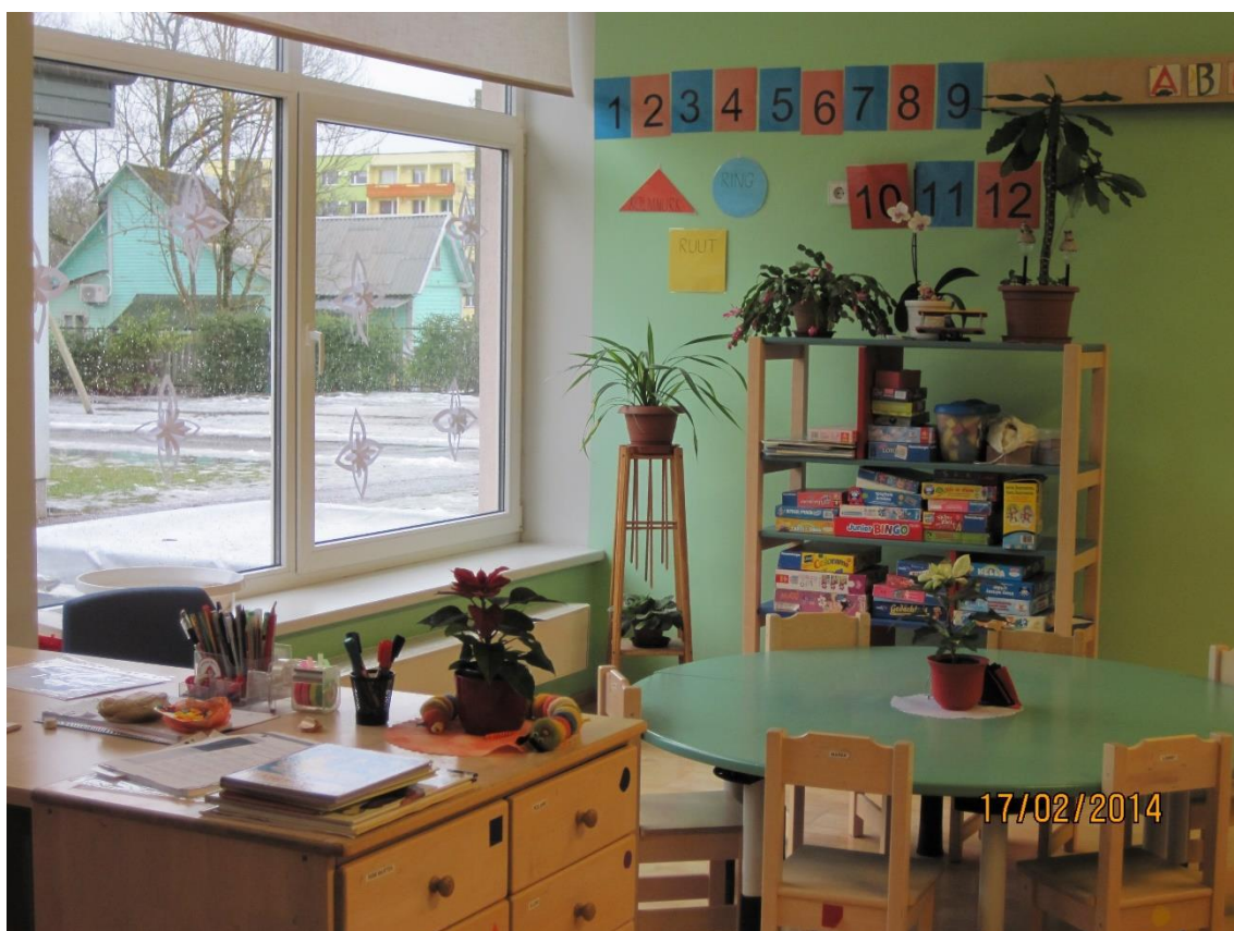
KUVA 4. Ryhmähuone

Kuvassa 4 näkyy yksi lastentarhan ryhmähuoneista. Jokaisessa ryhmähuoneessa on lastentarhanopettajan pöytä, missä voi tehdä paperitöitä ja