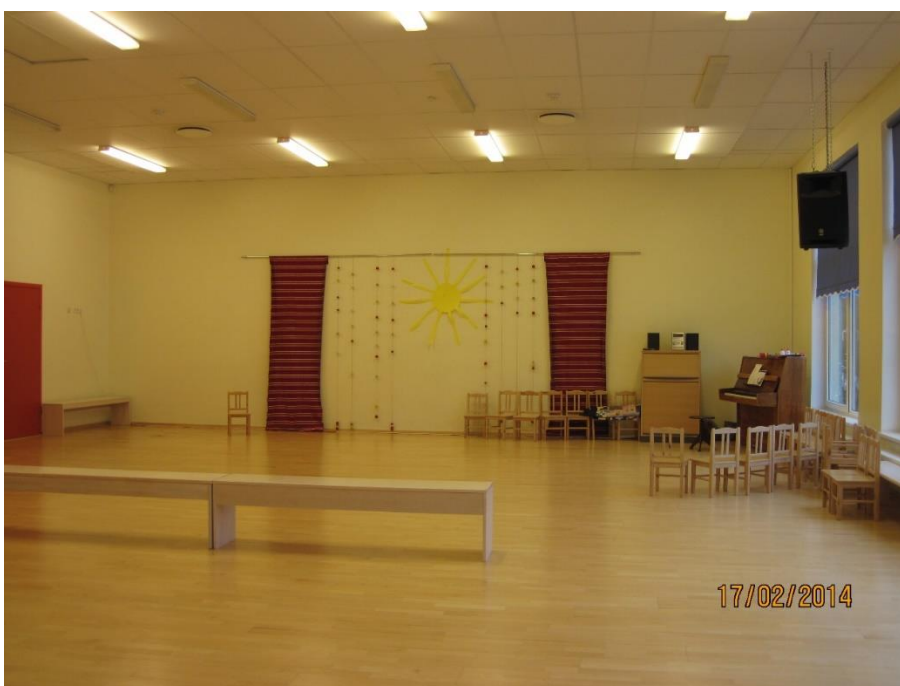
KUVA 9. Sali

Salissa työskentelee musiikinopettaja, joka järjestää juhlia ja organisoii erilaisia esityksiä. Musiikinopettaja osaa soittaa erilaisia soittimia ja on erikoistunut juuri alle kouluikäisten lasten eli varhaisiän musiikin opetukseen.