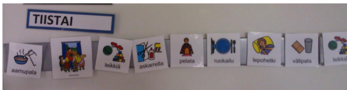
Kuva 1 Päivän ohjelma

Yhteistyöryhmässä päivärytmi laitettiin aamupiirissä esille kuvien avulla, kuvan 1 mukaisesti.