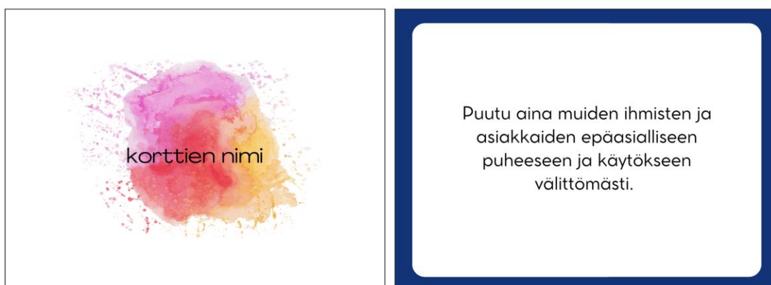
Kuvio 1: Esimerkki eräästä ensimmäisessä versiossa valmistuneesta kortista.

Rajallisen ajan puitteissa loimme yksinkertaiset kortit, joissa oli tummat, vahvan väriset reunat ja valkoinen tekstiruutu. Jokaiselle teemalle oli oma väri, mutta kaikki teemavärit olivat kohtuullisen tummia. Korttien teksti oli yhteneväistä ja saman paksuista, tummalla kirjoitettuna vaalealla pohjalla. Loimme muutaman esimerkin siitä, minkälainen korttien toinen puoli voisi olla. Korttien toinen puoli oli sateenkaariteeman mukainen, ja siinä lukisi korttien nimi. Tässä vaiheessa - ennen korttien arviointia, niillä ei ollut vielä nimeä, joten esimerkissä lukee korttien nimi, jotta arvioija saisi kuvan siitä, minkälainen visio meillä oli. Palautteen jälkeen sateenkaarikorttien nimi ja pohjavärit selkeytyivät.