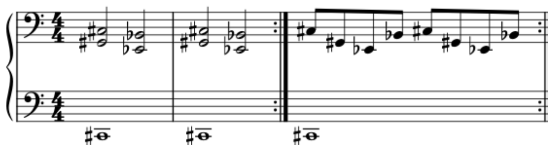
NUOTTIESIMERKKI 3. Esimerkki säestys

Esimerkki tarinasta: Veden alla on rauhallista, kalat uiskentelevat uneliaasti vedessä. Oppilas soittaa pitkiä ääniä mustilta koskettimilta. Yhtäkkiä vedessä näkyy tumma varjo ja kalaparvi säikähtää tätä ja se hajaantuu joka suuntaan. Millä tavoin oppilas kuvailisi tummaa varjoa ja mikä se voisi olla ja millä tavoin voisi kuvata kalojen pakenemista eri suuntiin?