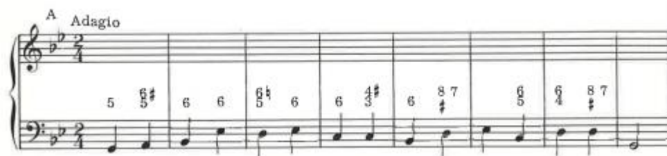
NUOTTIESIMERKKI 1. Kenraalibassonuotti. von Creutlein, Timo 1986: Kenraalibasso, 74

Kosketinsoittimilla on ollut tärkeä rooli säestyssoittimena renessanssi- ja barokkimusiikissa. Bassolinjan ylä- tai alapuolelle oli kirjoitettu numeroita. Näitä merkintöjä kutsuttiin kenraalibassomerkinnoiksi. Kenraalibassomerkinntöjen perusteella kosketinsoittajan oli kyettävä soittamaan harmoniat teokseen. Soittajan vasen käsi soitti bassomelodiaa ja oikealla kädellä soitettiin harmonioita kunkin tyylin mukaisesti. Soittajat lisäsivät myös ornamentteja 3 , melodioita, motiveja sekä sointujen arpeggioita 4 . Säveltäjät eivät kirjoittaneet näitä ylös, koska kenraalibassomerkinntät kertoivat harmoniat, mutta antoivat soittajille vapauden tulkita ja sovittaa ne esityksen olosuhteiden ja tyylin mukaan. (Moroney, 2002, 57–58.)