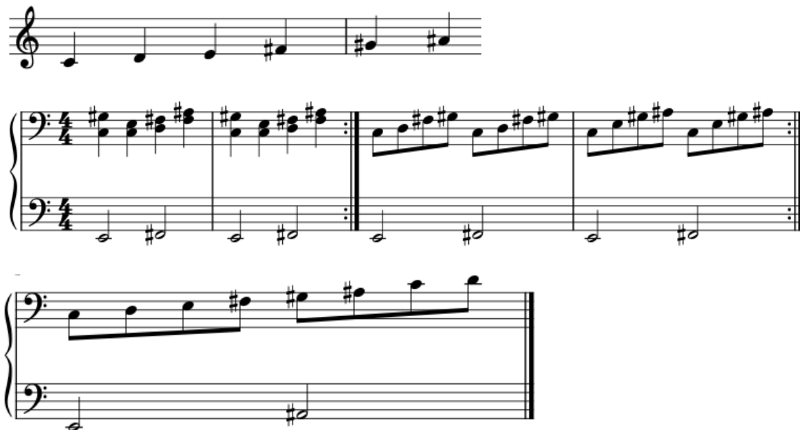
NUOTTIESIMERKKI 4. Esimerkki säestys

Harjoituksessa käytetään kokosävelasteikkoa: