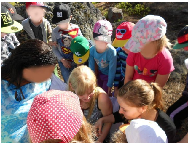
Kuva 10: Karhun painon kokeilua