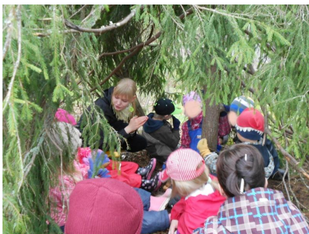
Kuva 8: Linnut pesässä