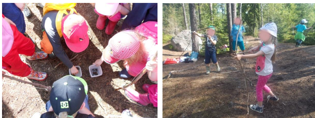
Kuva 12: Käpytutkimus ja jousipyssyjen kokeilua

Eväshetkeltä lapset saivat siirtyä leikkimään vapaita leikkejä ja halukkaat pääsivät rakentamaan jousipyssyjä avustuksellamme. Lapset olivat toivoneet tätä ensimmäisellä ideointikerhollamme. Leikkiaikaa oli tällä kerralla hieman tavallista enemmän, noin 40 minuuttia. Lopuksi keräännymme piiriin tutkailemaan vedessä olleita käpyjä, jotka olivat sulkeutuneet retkemme aikana. Viimeisenä keräsimme lapsilta palautetta retkikerrasta ja lauloimme loppulaulun.