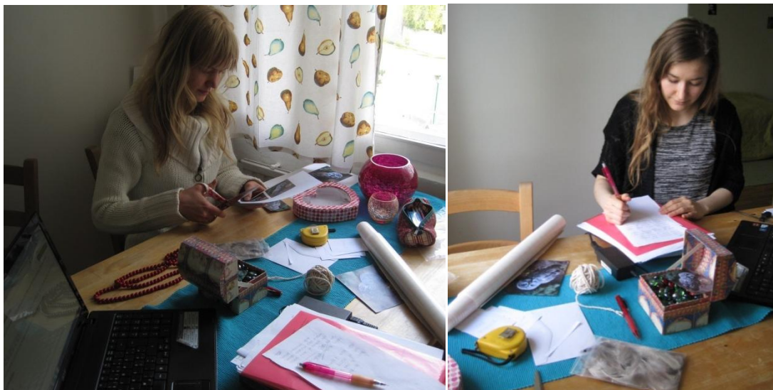
Kuva 1: Metsäretken valmistelua

Suunnittelimme lapsiryhmälle viisi ohjattua metsäretkeä. Ryhmässä oli 21 lasta ja siinä oli tasaisesti sekä tyttöjä että poikia. Sovimme ryhmän työntekijöiden kanssa, että he olisivat mukana retkillä, mutta ohjausvastuu olisi kokonaan meillä. Yksi retkikerta kestäisi noin 2,5 tuntia ja sen ajankohta olisi aamupalan ja lounaan välissä aamupäivällä. Suunnittelimme toteuttavamme metsäretket loppukevällä, jolloin voisimme keskittyä nimenomaan metsään lumileikkien sijasta. Opinnäytetyön toteutusympäristönä olisi päiväkodin lähimetsä, joka oli lapsille jo ennestään tuttu. Retkipäiväksi valikoitui tiistai, poikkeuksena viimeinen viikko, jolloin teimme myös toisen retken torstaina päiväkodin aikataulujen takia.