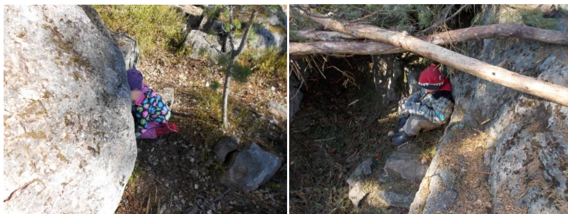
Kuva 5: Haukkaemoa piilossa

Kolmantena haukka kertoi näköaististaan, minkä jälkeen siirryimme leikkimään haukkapiilosta. Siinä emohaukan tuli löytää kadonneet haukanpoikaset, jotka yhtyivät löydyttyään mukaan etsintään. Neljäntenä eläimenä oli kontiainen, joka kertoi tuntoaististaan. Jakauduimme ryhmän suuren koon vuoksi kahteen ryhmään. Tunnustelimme kangaspussista erilaisia metsän asioita: käpyjä, sammalta ja kiviä. Lapset saivat ensin arvata, mitä pussissa oli, ja lopuksi näytimme heille sen sisällön.