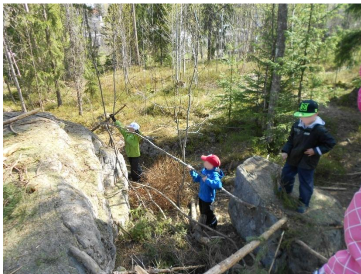
Kuva 3: Majan rakennusta