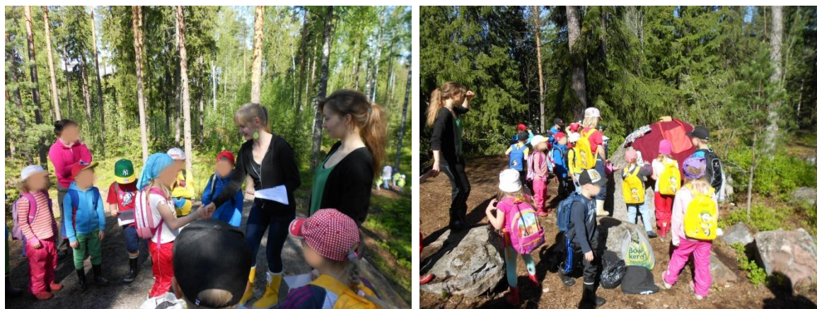
Kuva 17: Diplomien jako ja turmelijoiden päämajan tutkailua

Jaoimme lapsille diplomit tunnustukseksi osallistumisesta metsäretkille. Lapset saivat jälleen vuorotellen kertoa, mikä heistä oli ollut tällä kerralla kivointa. Lopuksi päätimme vielä käydä katsomassa turmelijoiden päämajaa, koska lapset eivät olleet päässeet sinne tarinan takia aiemmin. Päämajan tarkastuksen jälkeen kuljimme parijonossa takaisin päiväkodille ja keräsimme vielä löytämiämme roskia matkan varrelta.