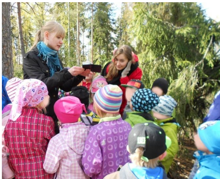
Kuva 4: Ääniviestin kuuntelua

Ohjeistimme lapsia keräämään pareissa lasipurkkeihin erilaisia asioita, joita lapset saivat lopuksi haistella. Jokaisen leikin jälkeen kerroimme lapsille vielä lyhyen tietoiskun kyseisestä aistista. Toinen viesti oli jänikseltä, joka johdatteli meidät kuuloaistin pariin. Ohjasimme lapset etsimään itselleen rauhallisen paikan, jossa he saivat hetken aikaa kuunnella hiljaa metsän ääniä. Ohjeistimme heitä menemään vähän kauemmaksi kavereistaan. Kuuntelun jälkeen lapset saivat kertoa, mitä olivat kuulleet.