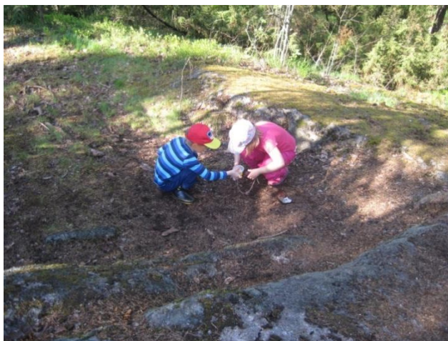
Kuva 11: Luuppitutkimus

Eväshetkeltä lapset saivat siirtyä leikkimään vapaita leikkejä ja halukkaat pääsivät rakentamaan jousipyssyjä avustuksellamme. Lapset olivat toivoneet tätä ensimmäisellä ideointikerhollamme. Leikkiaikaa oli tällä kerralla hieman tavallista enemmän, noin 40 minuuttia. Lopuksi keräännymme piiriin tutkailemaan vedessä olleita käpyjä, jotka olivat sulkeutuneet retkemme aikana. Viimeisenä keräsimme lapsilta palautetta retkikerrasta ja lauloimme loppulaulun.