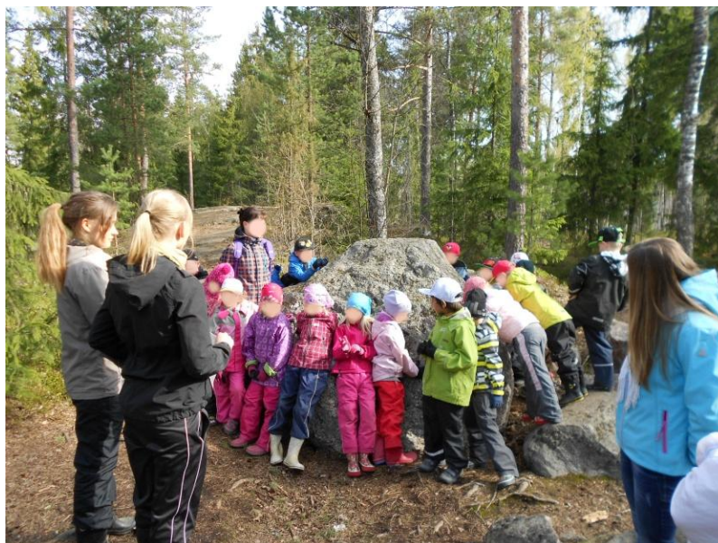
Kuva 2: Jokamiehenoikeudet-leikki

Leikin loppupuolella lapset kävivät levottomammiksi ja huomasimmekin kellon olevan aika paljon. Tästä syystä päätimme, että aloitamme majan rakennuksen vasta eväiden syönnin jälkeen. Söimme eväät yhdessä lasten kanssa kalliolla, jonka jälkeen annoimme lasten rakentaa majoja ja leikkiä vapaita leikkejä heidän toiveidensa mukaan. Ennen tätä keräsimme lapset vielä yhteen muistuttaaksemme heitä jokamiehenoikeuksista. Lapset eivät olisi enää jaksaneet olla piirissä, ja he lähtivätkin tämän jälkeen innolla leikkimään.