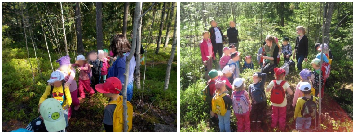
Kuva 14: Turvapaikalle siirtyminen

Kolmannen rastin teema oli matematiikka, josta meille tehtävän antoi Albert Aristoteles-pöllö. Pöllö kertoi, että metsän turmelijoiden mielestä kaikki metsässä on vain roskaa ja he haluavat heittää kaiken pois. Rastipaikalla oli muovikassi, jossa oli käpyjä, keppejä ja kiviä. Jaoimme lapset kolmeen ryhmään, joissa heidän tuli luokitella eri asiat omiin pinoihinsa turmelijoiden roskapussista. Näistä esineistä tuli uusia taikakaluja, jotka lapset saivat tuoda taikakalupussiin. Tässä vaiheessa lapset olivat havainneet kalliolle rakentamamme turmelijoiden päämajan, jota kehoitimme varomaan. Olimme käyneet aamulla viemässä tutun kiven luokse värikkäitä vilttejä ja huiveja, jotta paikka näyttäisi vallatulta. Kerroimme pöllön rastin olevan turvapaikkamme, jossa voimme rauhassa syödä eväät.