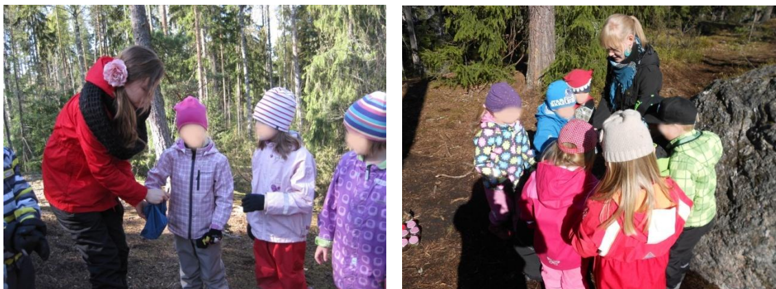
Kuva 6: Tunnustelu-leikki

Tämän jälkeen pidimme eväshetken, jonka yhteydessä annoimme lasten maistella metsän makuja. Olimme tuoneet mukamme ketunleipiä, koivunlehtiä, mustikoita ja puolukoita. Eväshetken jälkeen lapset saivat leikkiä omia leikkejään noin 20 minuutin ajan. Tämän jälkeen keräänyimme piiriin, jossa kuuntelimme viimeisen viestin karpäseltä, joka kertoi makuististaan. Jokainen lapsi sai kertoa vuorollaan, mistä maistamistamme mauista he pitivät. Lisäksi luimme loput tietoisikut. Lopuksi vielä painotimme lapsille, ettei saa syödä sellaista, jota ei tunnista, koska metsässä voi olla myös myrkyllisiä asioita. Lopuksi lapset saivat kertoa vuorotellen, mikä oli ollut parasta retkellä. Lauloimme vielä loppulaulun, jonka jälkeen lähdimme jonossa takaisin päiväkodille.