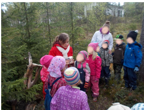
Kuva 9: Aarteen löytyminen