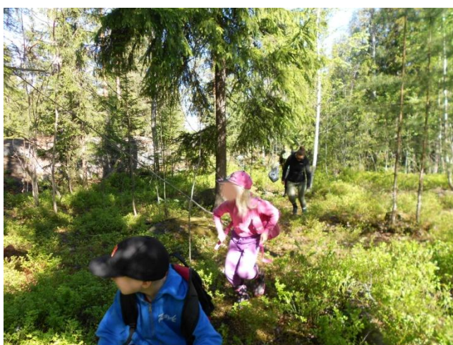
Kuva 15: Hiippailua turmelijoiden tukikohtan ohi

”Loppumatka tulee olemaan äärimmäisen vaarallinen, sillä metsän turmelijat pitävät päämajaansa kalliolla, ison kiven luona. Teidän tulee päästä kallion ohi varovasti piileskellen. Lähtekää matkaan pari kerrallaan. Joku aikuisista voi varmistaa edeltä reitin. Onnea matkaan!”