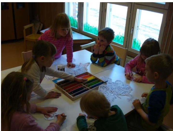
KUVA 2. Lapset työn touhussa