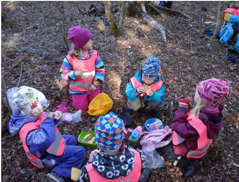
KUVIO 2. Eväshetki