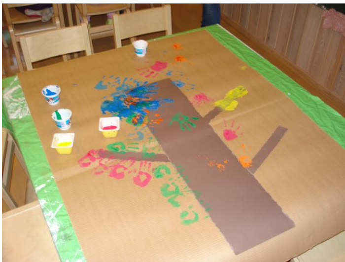
KUVA 1. Askartelua