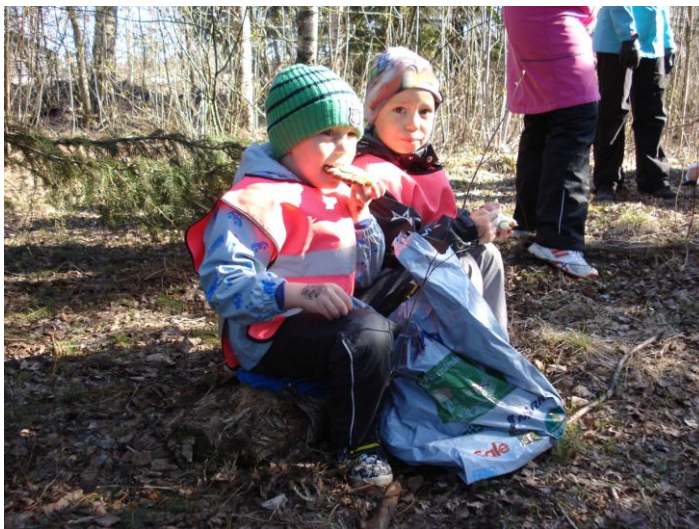
KUVIO 3. Pojat kannonnokalla

Avoin maasto ympäristönä toi ohjaukseen oman haasteensa ja ryhmänhallintaan täytyi kiinnittää erityistä huomiota. Metsäretki oli myös Västäräkit – ryhmälle ensimmäinen retki yhdessä, joten samalla harjoiteltiin luonnossa liikkumista ja olemista sekä erilaisessa ympäristössä toimimista. Vaikka kaikki Västäräkkien työntekijät olivat mukana metsäretkellä, he antoivat meille opiskelijoille hyvin vastuuta toimia ja harjoittaa ohjaustilannetta.