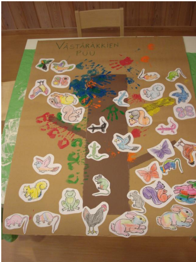
KUVA 3. Västäräkkien puu

Emme huomanneet kysyä tekemisen aikana mielipiteitä interventiokerrasta, kuten muissa interventioissa, mutta lapset vaikuttivat meidän havaintojemme mukaan pitävän toiminnasta ja olivat innoissaan eläimistä. Kun lapsia oli vain seitsemän, ryhmä oli sopivan kokoinen ja helposti hallittavissa. Kaikki lapset osallistuivat askarteluun innokkaasti ja olivat itsenäisiä. Askartelun ja värittämisen lopetus tapahtui liukuen, sitä mukaan milloin lapsia tultiin hakemaan. Mielestämme oli hieman ikävää, ettemme olleet aikatauluttaneet interventiota siten, että lopetukselle olisi jäänyt oma aikansa ja lopetus olisi ollut selkeä tämän kertaisen liukumisen sijasta.