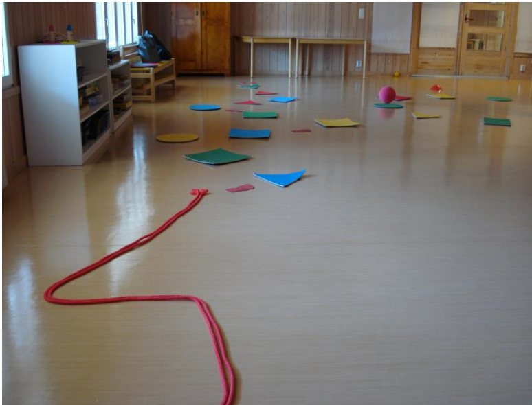
KUVA 4. Osa temppuradasta 3-4-vuotiaille