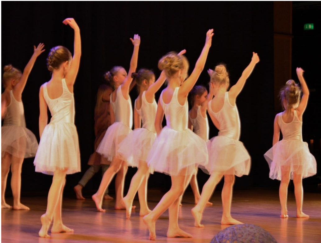
KUVIO 3. Lumihiutaletanssi

Oli kivaa mennä lavalle ja nähdä paljon tuttuja. Tanssiminen on kivaa! (Tanssija 7v.)