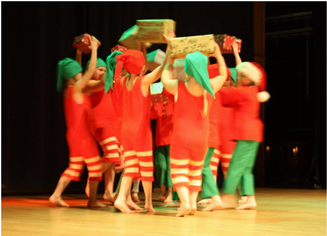
KUVIO 2. Tonttutanssi.

”Eikä sinne matka silloin kovin kauan kestä, Joulumaa jos jokaiselta löytyy sydäimestä”