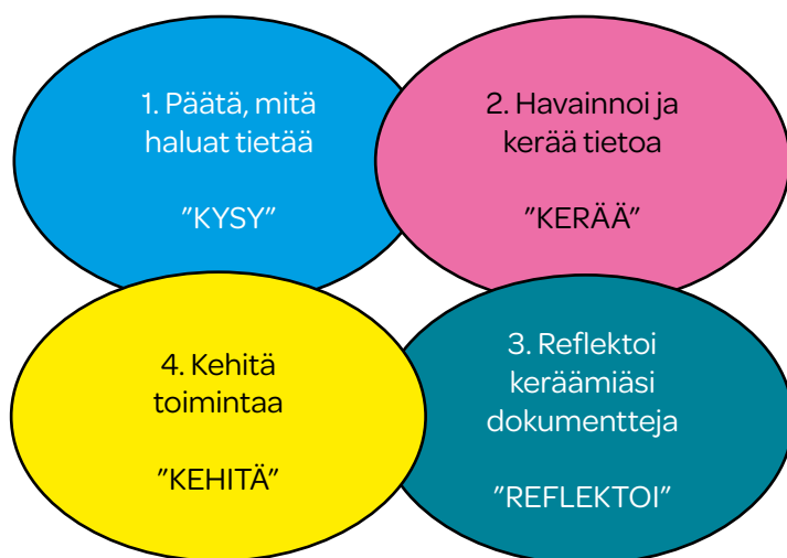
Kuva 1. Pedagogisen dokumentoinnin ratkaisuhakuinen prosessi (Rintakorpi 2024).

Ratkaisuun pyrkivässä pedagogisen dokumentoinnin prosessissa (Kuva 1.) valitaan usein jokin aloituskysymys (vrt. tutkimuskysymys), jonka ratkaisemiseksi kerätään tietoa (esim. haastatellaan lapsia). Seuraavassa vaiheessa kerättyä tietoa (dokumentteja) reflektoidaan henkilöstön tai / ja lasten kanssa ja päädytään keskustellen ratkaisuun, jonka viitoittamana toteutetaan toimintaa.