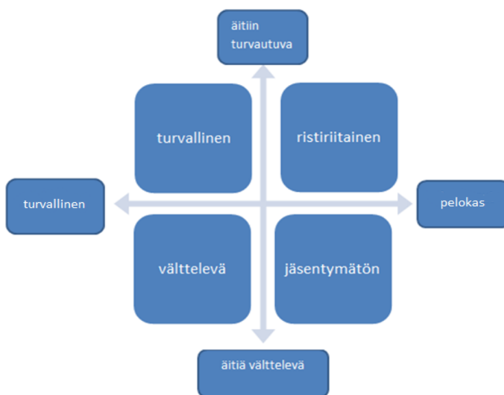
Kuvio 1: Kiintymyssuhteen laatu ja lapsen käyttäytymismalli

Seuraava kuvio havainnollistaa edellä kuvaamiemme kiintymyssuhteiden vaikutuksia lapsen toimintaan.