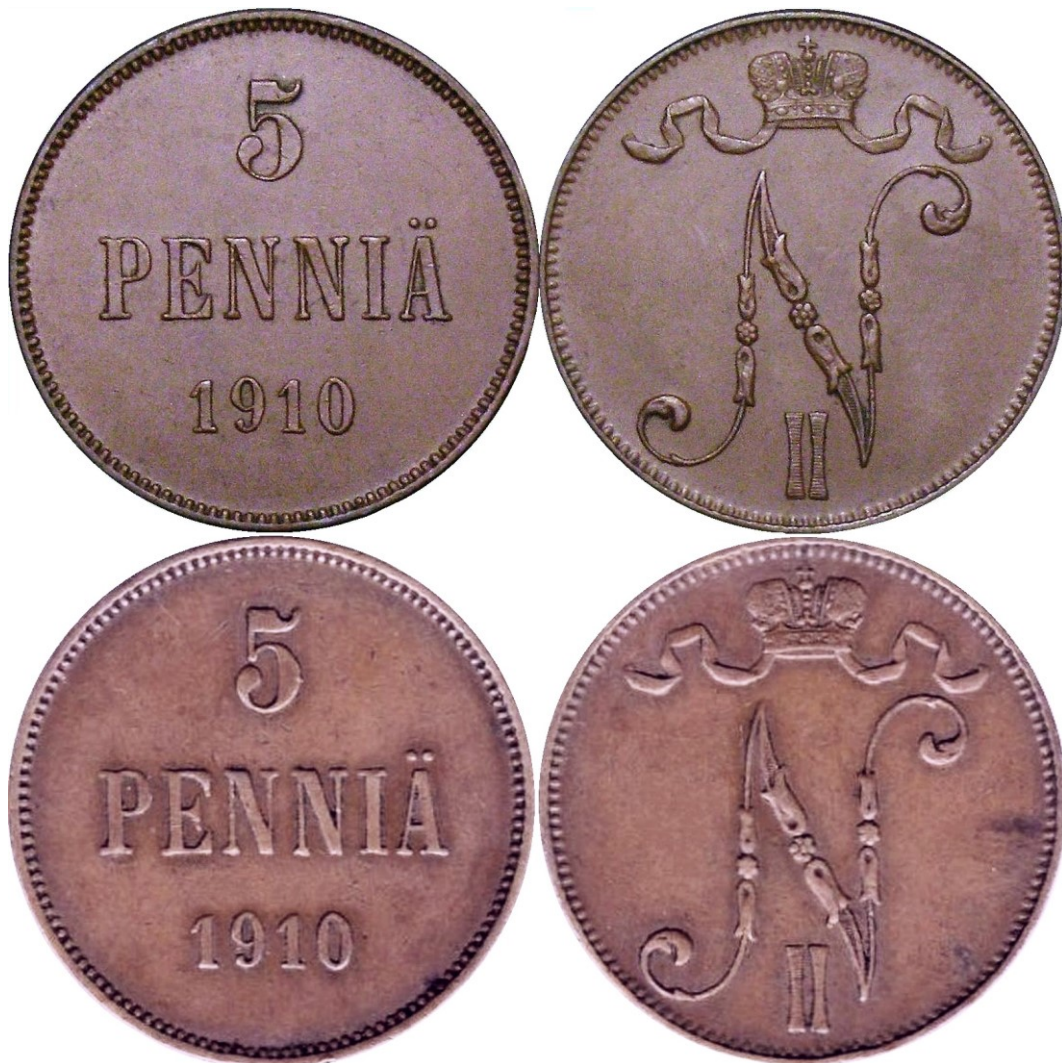
Kuva 1. 5 penniä 1910. ylinnä normaaliraha, alinna poikkeama, jonka vuosiluvun ensimmäisen 1:n alaviiva on vasemmalta vajaa. Kuvien yhdistely ja muokkaus Jorma J. Imppola, SeAMK.

Vuosiluku 1910 on autonomian ajan 5-pennisistä ollut aina kiinnostava, koska kyseinen vuosi on niin sanottu avainvuosi poikkeuksellisen pienen painosmääränsä (66 000) vuoksi. Toiseksi pienin vuosilyönti, eli 300 000 kpl, on vuoden 1870 rahalla.