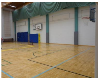
Kuva 5. Liikuntasali. (Kuva: Sari Mahonen ja Maarit Nykänen.)

Mielestäni liikuntasali on hyvä asia, koska sinne mahtuu enemmän ihmisiä ja on tilaa liikkua (kuva 5).