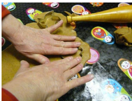
Kuva 6. Kädet ja piparimuotti. (Kuva: Sari Mahonen ja Maarit Nykänen.)

Tekeminen ja lasten innokkuus antavat minulle iloa (kuva 6).