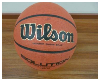
Kuva 9. Koripallo.

Minulle on tärkeää välittää omaa osaamistani ja nähdä lasten onnistuminen, koska kaikki ovat eritasoisia liikkujia. Olen ollut aikaisemmin aktiivinen koripallon pelaaja, mutta urheiluvamman vuoksi en ole pystynyt pelaamaan vuosiin. Kaikkein tärkeintä minulle on juuri koripallon pelaamisen opettaminen (kuva 9).