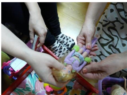
Kuva 10. Nukke.

Eräässä Terhokerhossa tutustuimme ikäihmiseen, joka muista poiketen painotti haastattelun aikana kolmen sukupolven yhteyttä. Hän halusi valokuvata vanhemman ja isovanhemman kohtaamista (kuva 10).