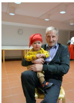
Kuva 4. Mies ja lapsi.

Olen tavannut kuvan lapsen yhden kerran aikaisemmin ja nyt hän pyysi päästä syliin uudestaan (kuva 4).