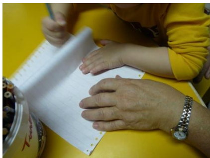
Kuva 8. Lapsi ja kädet.

Minusta parasta on lasten kanssa toimiminen, josta saa parhaita elämänkokemuksia (kuva 8).