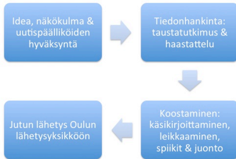
Kuva 3. Yle Perämeren kaava (Kukko-Liedes 2015; Heikinmatti 2015)

Nämä kaavat (kuva 1, kuva 2) pätevät myös Pohjois-Suomen alueellisten tv- uutisten rinnakkaispaikkakuntana toimivan Yle Perämeren toimintaan (kuva 3). Julkaisuvaiheen voi mieltää tässä toimituksessa siten, että kun juttu on valmis lähetystä varten, siirretään se Oulun lähetysyksikköön julkaistavaksi Pohjois-Suomen alueellisessa tv-uutislähetyksessä.