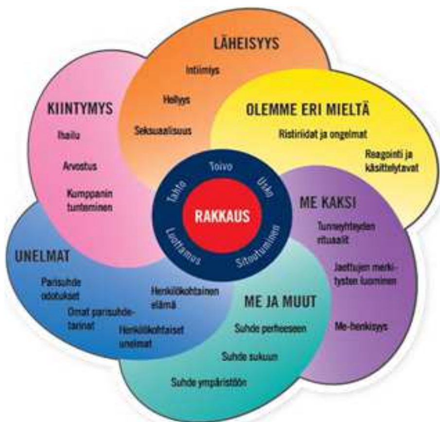
KUVIO 1. Parisuhteen kehrä (Kumpula, Malinen & Koskinen 2009).

Väestöliiton parisuhteen kehrä (KUVIO 1) kuvastaa liikkeessä olevaa, kehittyvää ja toimivaa parisuhdetta. Kun kehrä on liikkeessä, niin sen keskiötä tai siivekkeitä on vaikea erottaa. Kun liike pysäytetään, on mahdollista tarkastella vuorovaikutuksen toimivuuteen ja yhteyden säilyvyyteen liittyviä asioita. Kehrän pyöriessä tasaisesti, siitä leviää hyvinvointia kehrän vaikutuspiirissä oleviin henkilöihin eli etenkin perheen lapsiin. Toimivassa parisuhteessa jokainen kehrän siivekkeistä toimii riittävän hyvin. (Kumpula, Malinen & Koskinen 2009.)