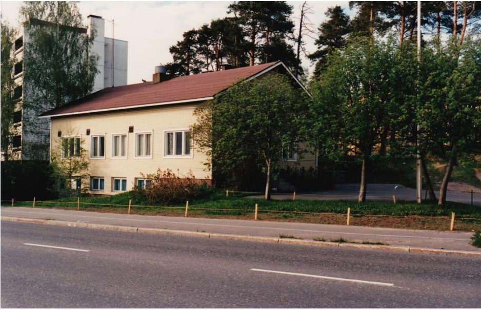
Kuva 1. Oulun kuurojen yhdistys, Koskitie 19

ta, kaskuja vanhoista tavoista ja tapahtumista. Kuurojen yhteisö ja kulttuuri vaikuttavat siihen, millainen käsitys kuurolla on itsestään ja millaisia mahdollisuuksia hänellä on toimia yhteiskunnassa sekä millaisia ratkaisuja hän tekee eri elämäntilanteissa. Tällainen perinnetieto siirtyy sukupolvelta toiselle joko kuurojen kouluissa tai yhdistyksillä. (Widberg-Palo 2008, 12 – 13).