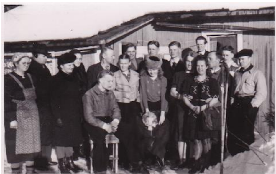
Kuva 2. Niskalan pihalla talvella