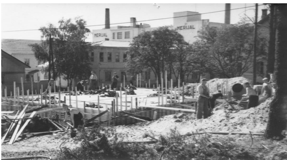
Kuva 6. Rakennustyöt etenevät, 1953