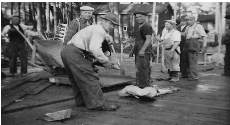
Kuva 5. Valutyöt, 1953