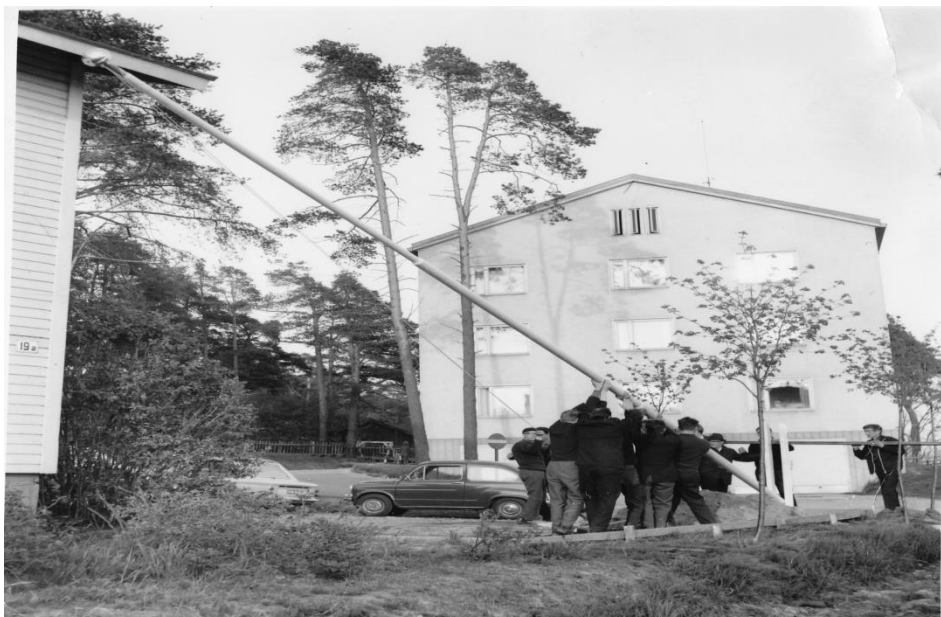
Kuva 8. Lipputangon nosto, 1954