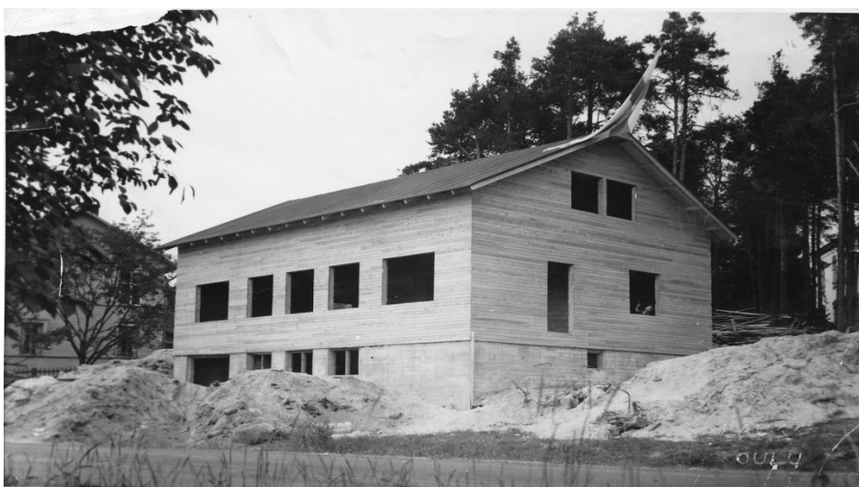
Kuva 7. Harjakaiset, 1953