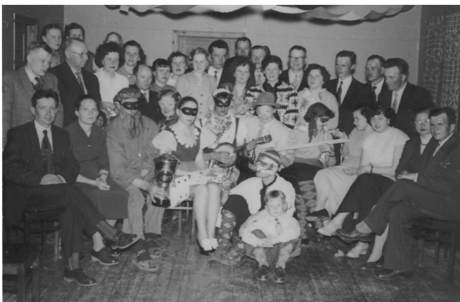
Kuva 11. Vappunaamiaiset

Yhdistyksen ja sen alaosastojen ohjelmien lisäksi talossa järjestettiin myös perhejuhlia, kuten syntymäpäivä- ja häjäjuhlia. Haastateltavamme häät olivat Oulun kuurojen talon ensimmäiset juhlit. (Kuva 12).