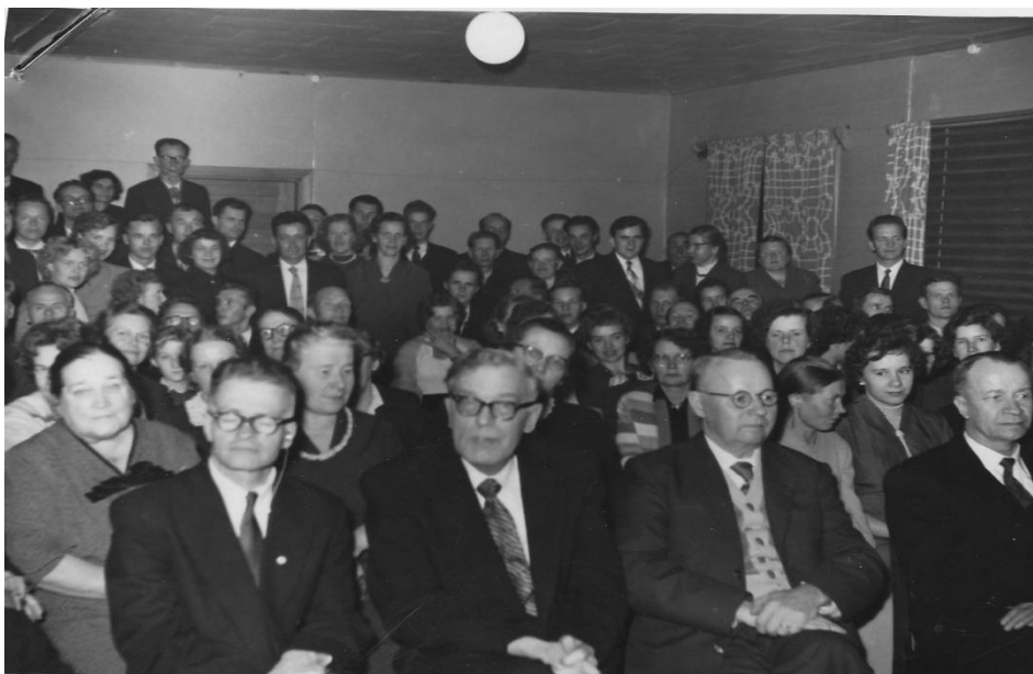
Kuva 9. v.1957