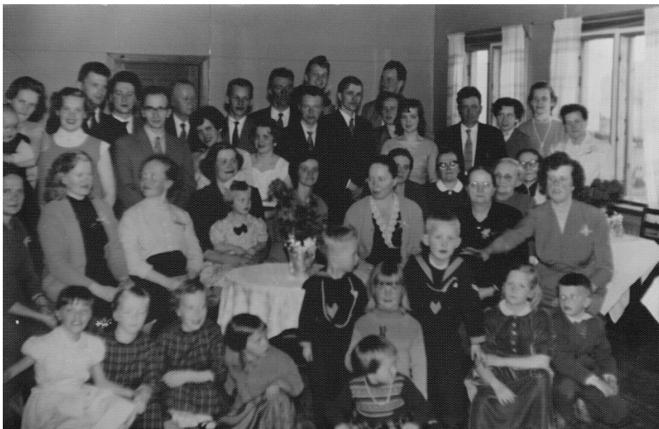
Kuva 10. Äitienpäiväjuhla, 1958