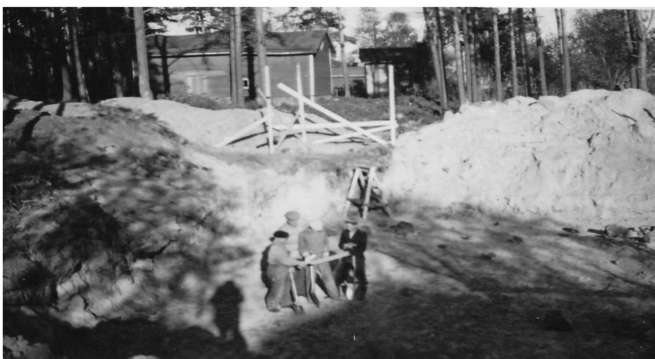
Kuva 4. Rakennusmonttu, 1953

Sittemmin ovat muutamat muutkin kuurojen yhdistykset saaneet rakennettua toimitalonsa talkootyönä. Esimerkiksi Vaasan kuurojen yhdistyksen toimitalon vihkiäistilaisuus oli syksyllä 1957 (Tuomi 1998, 28) ja Turun, Suomen vanhimman kuurojen yhdistyksen toimitalon vihkiäistilaisuutta vietettiin toukokuussa 1960. (Turun kuurojen yhdistys 1985, 36).