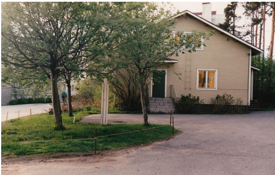
Kuva 13. Oulun kuurojen talo tiensä päässä

”Tosiaan ku isälle se oli niin vaikeeta, hän välillä oli vihanenki siitä, että miks se vanha talo purettiin...se niinku täytti hirveen tärkeen tehtävän just meille suurille ikäluokille, että me saatiin siellä olla... että tuota mää sanon sen, että me oltiin oikeestaan etuoikeutettuja kuuleviin verrattuna.”