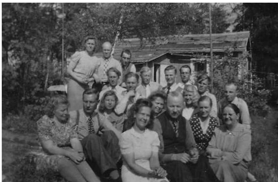
Kuva 3. Niskalan pihalla kesällä

Unelma omasta talosta syntyi kuitenkin pikkuhiljaa. Kuurojen määrä oli tuolloin suuri: siten myös yhteisen tilan puute alkoi vaivata.