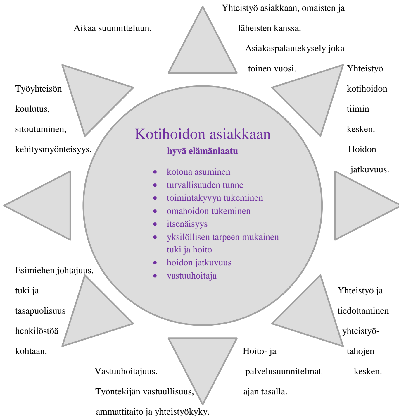
Kuvio 1. Kotihoidon asiakkaan hyvän elämän laadun turvaaminen.

Kuviossa 1 esitetään tekijät, joilla turvataan asiakkaan hyvä elämälaatu.