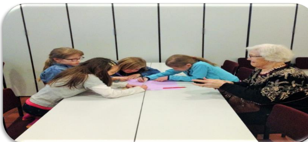
Kuvat 3, 4 ja 5. Tapahtuman osallistuneita ikäihmisiä ja lapsia.