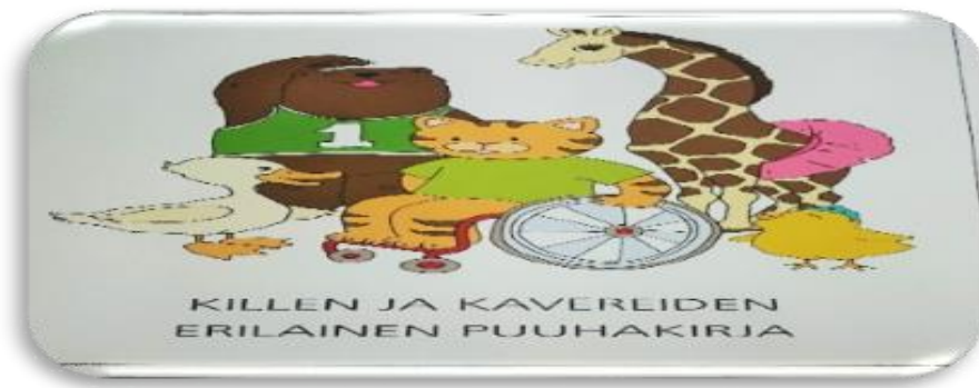
Kuva 6. Puuhakirja.