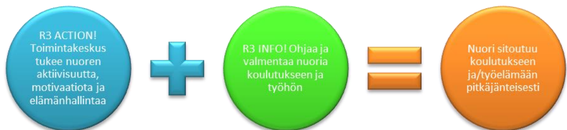
Kuva 1: Maahanmuuttajanuorten tuki ry:n toimintaidea

Info- ja Palvelukeskus on matalan kynnyksen palvelu, johon asiakkaat voivat tulla ilman ajanvarausta aina palvelukeskuksen aukioloaikoina. Asiakkuus on täysin vapaaehtoista nuorille, eikä heidän työttömyystukea leikata jos nuori peruu tai jättää tulematta sovittuun tapaamiseen. Tavoitteena on tehdä nuorelle kattava, kauaskantoinen ja realistinen suunnitelma, joka ottaa huomioon nuoren henkilökohtaisen tilanteen sekä hänen haaveensa. Nuorten edistymistä seurataan säännöllisin tapaamisin ja heihin pidetään aktiivisesti yhteyttä ja varmistetaan, että esimerkiksi työsuhteen päätyttyä heillä olisi paikka, jossa jatkaa (koulu, toinen työ). (Vuosi-raportti 2014: 2.)