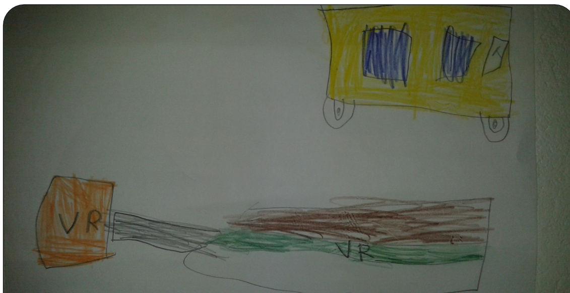
Kuva 1: Teemahuoneesta puuttuvia liikennevälineitä yksilötyössä.

”...me ajettais niillä ja tää mahtuis kyllä muutenkin paremmin ulos.”