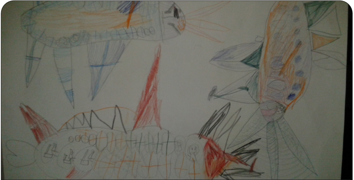
Kuva 3: Hirviölentokoneita ryhmätyössä.

"Ois kiva jos ois krokotiili ja leijonapukuja, sit vois metsästää ja leikkii hirviöä. Olis tyttö metsästäjiä ja poikametsästäjiä."