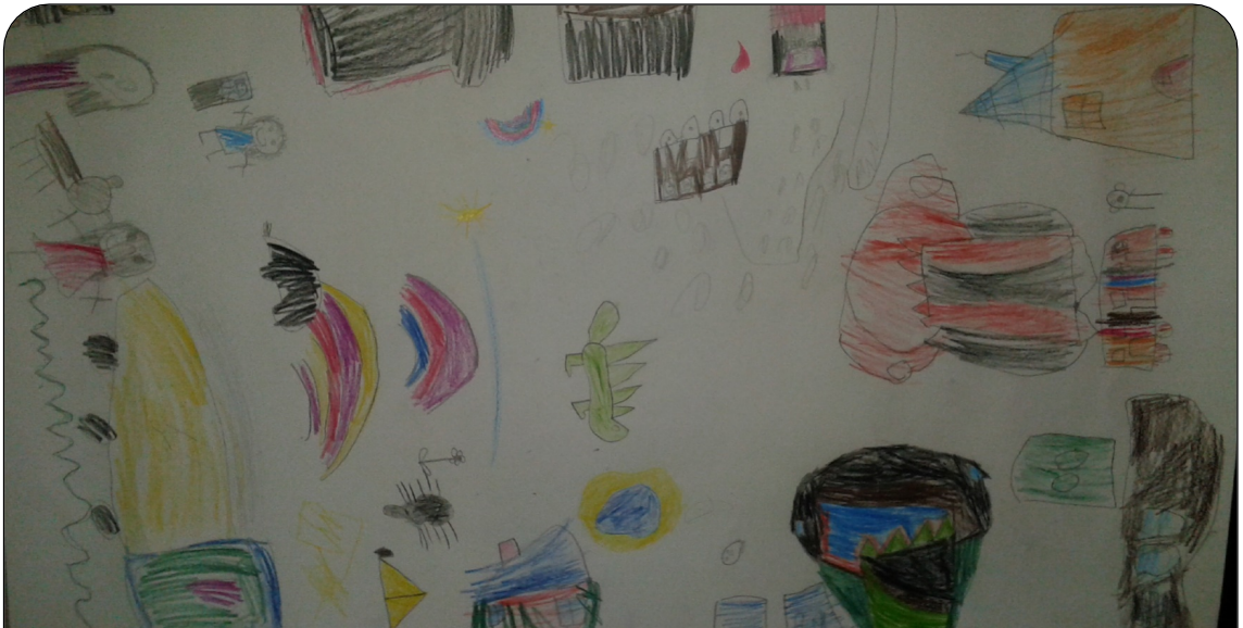
Kuva 4: Sateenkaaria ja hirviöitä ryhmätyössä.

"No sateenkaaren kuva seinälle ja kukkia ja taivas ja ruohoa."