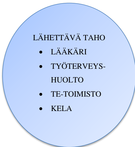
Kuva 3. Ammatilliselle kuntoutuskurssille lähettänyt taho.

Kaikki neljä kuntoutujaa olivat olleet jo pitkään kotona, jolloin he kokivat tarvitse- vansa elämäänsä uutta puhtia ja suuntaa, myös ammatillisten suunnitelmiansa osalta. Yksi kuntoutujista oli ollut sairauslomalla neljä vuotta ennen kurssille tuloa, kaksi kun- toutujista kaksi vuotta ja yksi vuoden verran. Kuntoutujat kokivat kurssille tulonsa tarpeelliseksi, koska yksin ei enää pärjännyt ja he tarvitsivat muiden tukea päästäkseen eteenpäin.