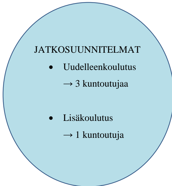
Kuva 4. Kuntoutujien jatkosuunnitelmat kurssin jälkeen.

Yhdelle kuntoutujista oma tulevaisuuden ammattiala oli selkiytynyt työharjoitteluiden myötä, vaihtoehtoja sen toteuttamiseksi oli tässä vaiheessa kurssia olemassa kaksi. Ensimmäinen vaihtoehto oli hakeutua opiskelemaan hotelli- ja ravintola-alan catering perustutkintoa. Mikäli kuntoutuja ei saisi opiskelupaikkaa, selvittää hän mahdollisuuksiin kouluttautua alalle oppisopimuksella työharjoittelupaikassaan.