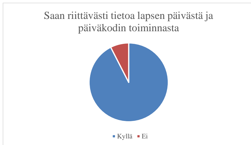
KUVIO 3. Saan riittävästi tietoa lapsen päivästä ja päiväkodin toiminnasta.

Osion kaksi kysymystä koskivat sitä, miten vanhemmat kokevat saavansa tietoa sekä päiväkodin toiminnasta että oman lapsen päivän sujumisesta. Vanhempien vastausten perusteella 94 prosenttia vanhemmista kokee saavansa riittävästi tietoa päiväkodin tai esiopetuksen toiminnasta, joten kuusi prosenttia vastaajista koki, etteivät he saa riittävästi tietoa päivähoiton tai esiopetuksen toiminnasta. Vastaajista 91 prosenttia tunsivat saavansa riittävästi tietoa oman lapsensa päivän sujumisesta, esimerkiksi ”tiedottaminen on ollut hyvää” . Näin ollen lähes kymmenen prosenttia vastaajista koki, etteivät he saa riittävästi tietoa lapsen päivän sujumisesta päivähoitossa tai esiopetuksessa. Avoimista vastauksista 14 vastausta liittyi tiedonkulkuun päivähoiton ja kodin kesken. Neljässä vastauksessa annettiin yksiselitteisesti positiivista palautetta tiedonkulusta. Näissä koettiin, että tietoa saadaan riittävästi ja tieto annetaan vanhemmille iloisesti ja positiivisesti. Kahdeksassa vastauksessa todettiin annetun tiedon olevan puutteellista, siten etteivät vanhemmat koe saavansa riittävästi tietoa lapsensa päivän sujumisesta ja päivähoiton yleisestä toiminnasta, vanhemmat kokevat muun muassa ”on päiviä kun lapsen päivästä ei kerrota mitään” . Muutamassa kommentissa todettiin, ettei lapsen päivästä saa välttämättä lainkaan tietoa hakutilanteissa.