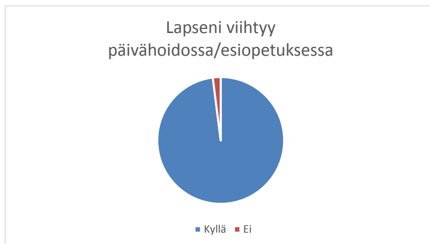
KUVIO 4. Lapseni viihtyy päivähoitossa.

Päivähoidon ja esiopetuksen toimintaa kartoitettiin kolmella kysymyksellä, jotka käsitelivät vanhempien odotuksien toteutumista, perushoidon sujumista sekä toiminnan riittävää monipuolisuutta. Noin 94 prosenttia oli keskimäärin tyytyväisiä päivähoiton tai esiopetuksen toimintaan perushoidon ja muun toiminnan suhteen. Lapsen hoito, kasvatusta ja opetus vastaavat 93 prosentin vanhemmista odotuksia. Seitsemän prosenttia vastaajista koki ettei lapsen hoito, kasvatusta ja opetus vastaa heidän odotuksiaan. Vanhempien mielestä esimerkiksi ”metsäretkiä on harvoin”. Perushoito, kuten ravinto ja ulkoilu, sujuvat hyvin 94 prosentin mielestä. Kuusi prosenttia vastaajista oli taasen sitä mieltä, että perushoidossa olisi parantamisen varaa heidän lapsensa kohdalla, esimerkiksi ”lapsen pukemisessa on ollut ongelmia”, kuitenkin pääosa vastaajista oli tyytyväisiä päivähoiton perushoitoon sekä kasvatukseen ja opetukseen. Suurin osa vastaajista, 94 prosenttia, oli sitä mieltä, että päivähoiton ja esiopetuksen toiminta on riittävän monipuolista, vain seitsemän vastaajaa koki, ettei näin ole. Muutama kommentti koski ulkoilun määrää, vanhemmat toivoivat lisää ulkoilua päiväkotipäivään. Päiväunien kohdalla vastaajat olivat vastakkaisista mieltä, toinen vastaaja toivoi vain lepoa, mutta toinen toivoi enemmän päiväunta lapselleen.