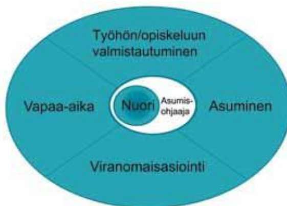
Kuvio 1. Tuetun asumisen kokonaisvaltaisuus nuoren itsenäistymisen tukemisessa (Karppinen 2011, 84)

NAL-sisältöpalvelu tuetussa asumisessa tuetaan nuoren itsenäistymistä kokonaisvaltaisesti. Siinä vahvistetaan nuoren asumisvalmiuksia ja turvataan asumisen onnistuminen. Tuetun asumisen työssä korostuvat kasvatuksellinen työote, asukkaan henkilökohtainen neuvonta ja ohjaus sekä asiakastyön verkoston johtaminen. Nuoren ensisijainen tuen tarjoaja ja motivoija on asumisohjaaja. Tuettuun asumiseen ohjautetaan useimmiten sosiaalitoimen tai muun yhteistyöverkoston kautta. (Karppinen 2011, 84.)