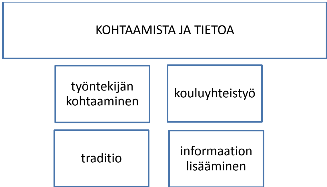
KUVIO 3 Miten nuorten seurakunnan vaihdosta olisi voitu tukea?

Kuviossa 3 näkyy, mistä asioista yläkategoria muodostui. Työntekijän kohtaaminen, traditio, kouluyhteistyö ja informaation lisääminen muodostivat yläkategorian. Seuraavaksi avaamme näitä alakategorioihin liittyviä asioita.