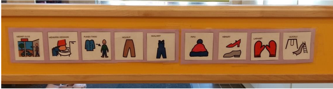
Kuva 5: Kuvakortit ulosmenon ohjeistuksena