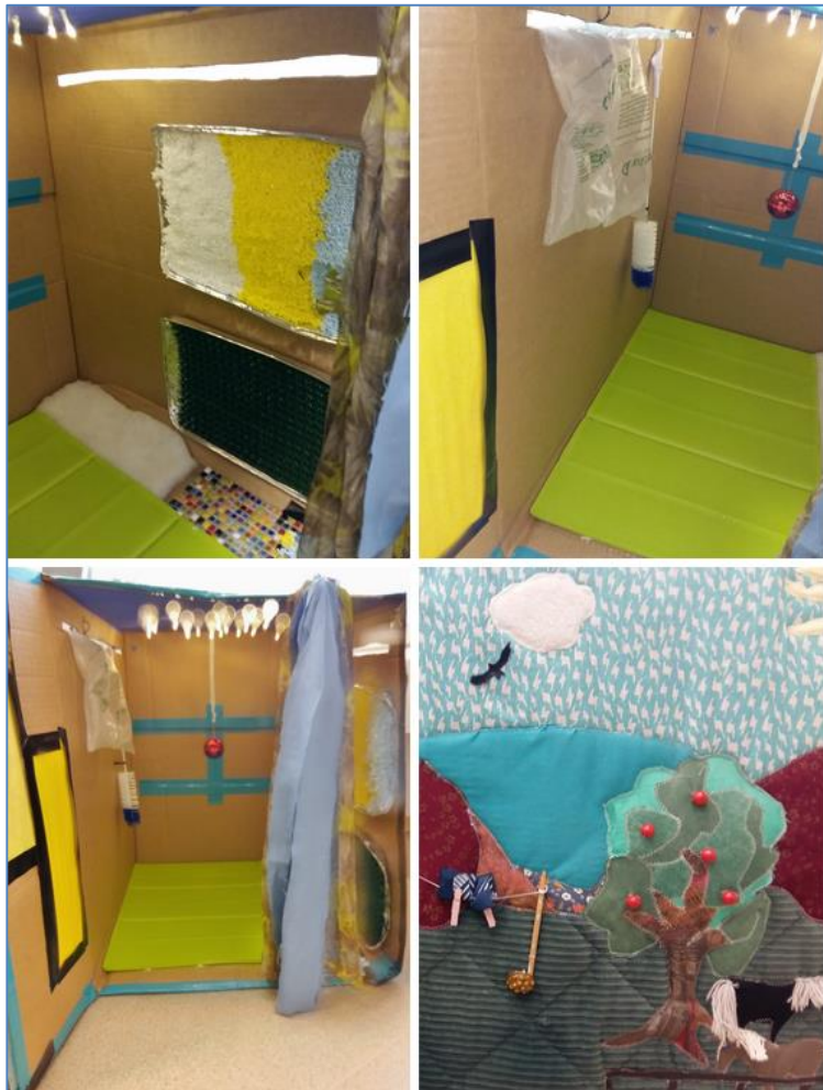
Kuva 7: Tilanhahmotuslaatikko, sokean lapsen aistien aktivoimiseksi