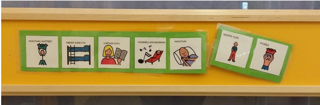
Kuva 6: Kuvakortit päiväunihetken ohjeistuksena