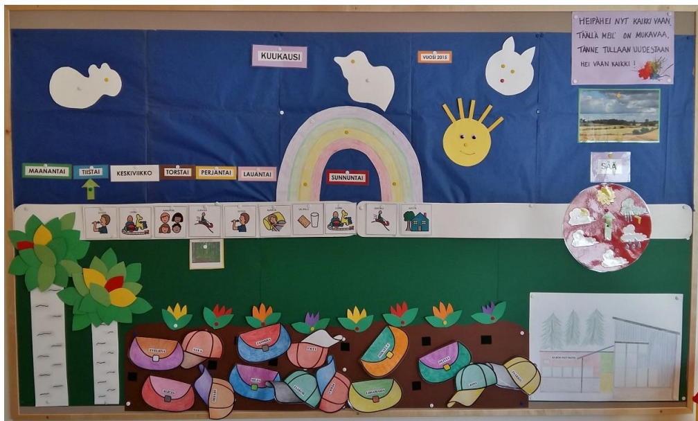
Kuva 1: Aamupiiritaulu 2-4-vuotiaiden ryhmässä