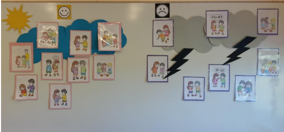
Kuva 3: Tunnetaulu, kuinka toimia oikein ja kuinka ei tulisi toimia päiväkodissa