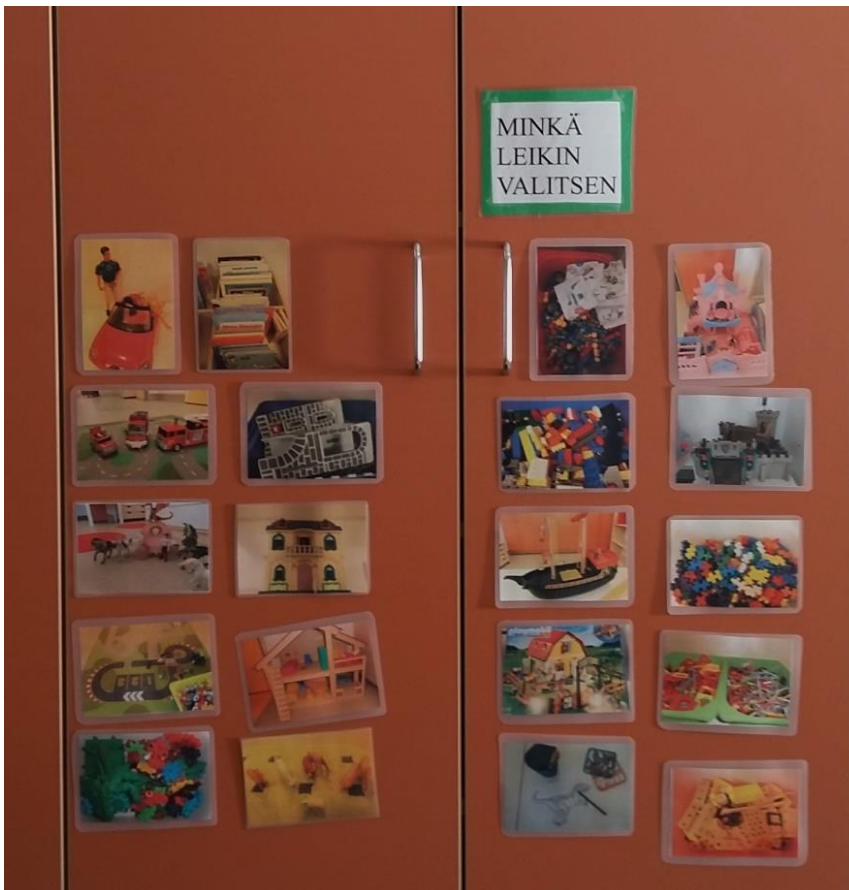
Kuva 4: Leikkitaulu