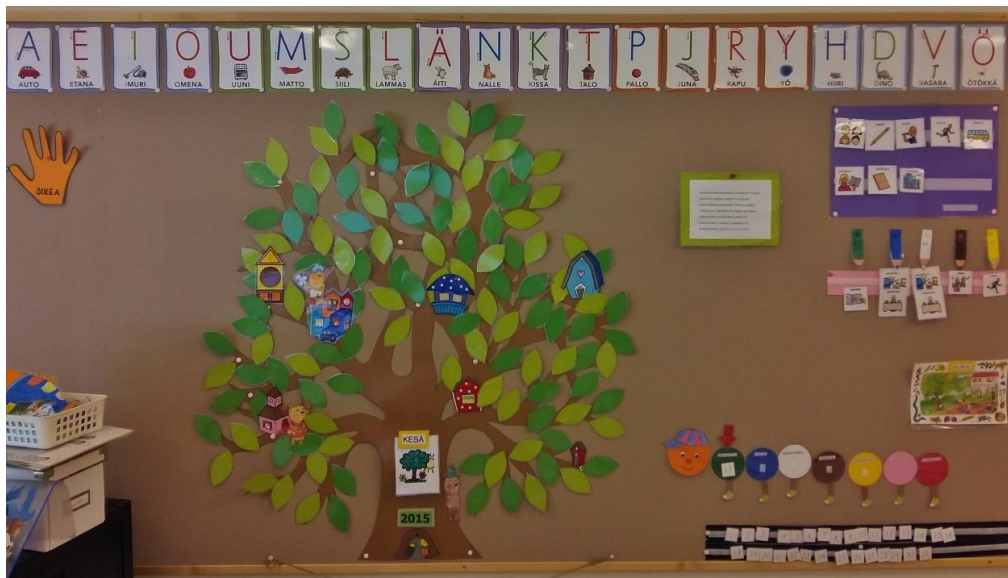
Kuva 2: Aamupiiritaulu esikoululaisten ryhmässä