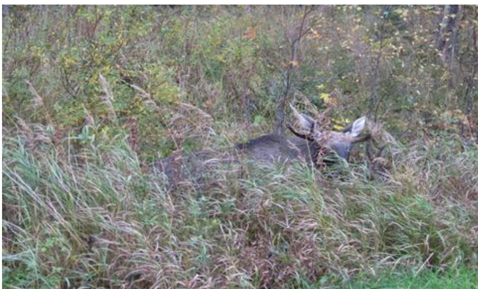
KUVIO 3. Hirvi (Seppo Männistö)

Vuonna 2010 Suomessa eniten metsästetyt riistalajit olivat kappalemäärissä mitattuna sinisorsa, sepelkyyhky, teeri, tavi, supikoira, metsäjänis, hirvieläimet ja rusakko. Kilomääräisesti eniten kaadettiin hirviä. Vuonna 2010 vuotuinen hirvieläinten kaatomäärä oli 90 000 yksilöä, joista hirviä oli 68 400 yksilöä. Oulun Eteläisen alueella kaadettiin hirvieläimiä 5 904 kpl. (Riista- ja kalatalouden tutkimuslaitos tilasto 2010) Vuonna 2012 hirviä kaadettiin 40 000 yksilöä (Riista- ja kalatalouden tutkimuslaitos tilasto 2012) Seuraavassa kuviossa 3 hirvi on kuvattuna suojavärissään.