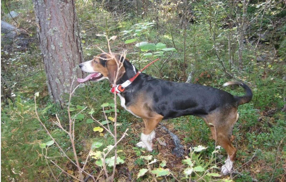
KUVIO 2 Suomenajokoira (Seppo Männistö)

Vuonna 2010 Suomessa eniten metsästetyt riistalajit olivat kappalemäärissä mitattuna sinisorsa, sepelkyyhky, teeri, tavi, supikoira, metsäjänis, hirvieläimet ja rusakko. Kilomääräisesti eniten kaadettiin hirviä. Vuonna 2010 vuotuinen hirvieläinten kaatomäärä oli 90 000 yksilöä, joista hirviä oli 68 400 yksilöä. Oulun Eteläisen alueella kaadettiin hirvieläimiä 5 904 kpl. (Riista- ja kalatalouden tutkimuslaitos tilasto 2010) Vuonna 2012 hirviä kaadettiin 40 000 yksilöä (Riista- ja kalatalouden tutkimuslaitos tilasto 2012) Seuraavassa kuviossa 3 hirvi on kuvattuna suojavärissään.