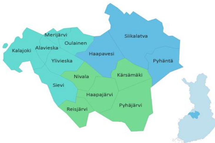
KUVIO 4. Oulun Eteläinen (Oulun Eteläinen )

Tutkimuksen opinnäytetyöhöni tein haastattelemalla Oulun Eteläisen alueella erityyppisiä metsästäjiä. Tarkoitukseni oli tässä työssä tutkia, onko Oulun Eteläisen alueella metsästysmatkailutoimintaa. Lisäksi halusin selvittää, missä muodossa metsästysmatkailua esiintyy sekä miten siihen suhtaudutaan. Minua kiinnostaa esimerkiksi se, suhtautuvatko maanomistaja ja metsästäjä eri tavalla metsästysmatkailijoihin. Oulun Eteläisen alueeseen kuuluu Nivala-Haapajärven, Siikalatvan ja Ylivieskan seutukunnat, yhteensä 14 kuntaa. Kuviossa 4 on kartta Oulun eteläiseen kuuluvista kunnista.