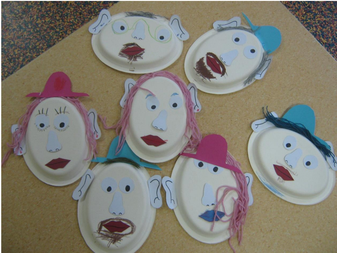
KUVIO 1. Lasten askartelemat Herra Aistit