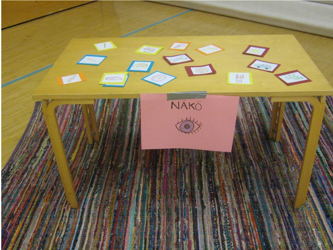
KUVIO 2. Toimintapiste näköaistille

hetki ja painettiin mieleen, mitä kuvia siinä on. Sen jälkeen peitettiin silmät, minkä jälkeen pöydältä poistettiin kuva tai kuvia. Lasten piti muistaa mikä tai mitkä kuvat puuttuivat.