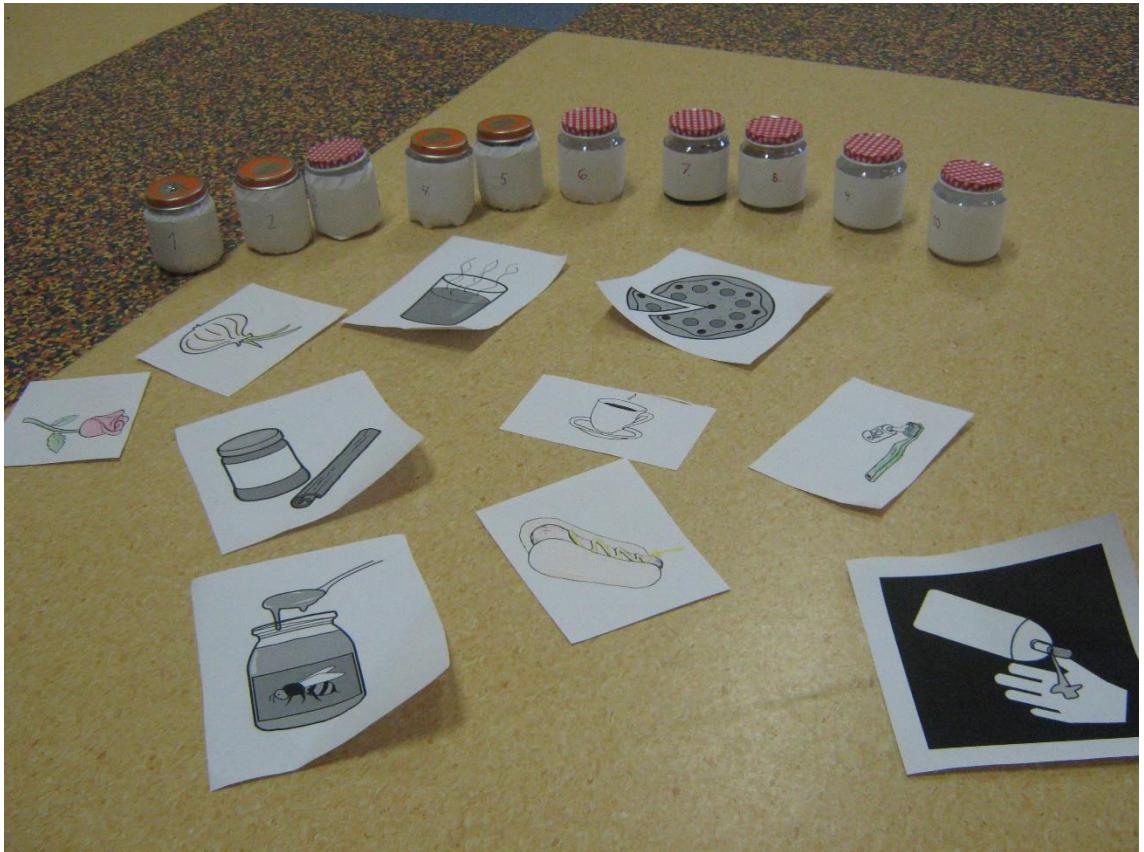
KUVIO 3. Hajupurkit

Tuntoaisti-rastilla esittelimme lapsille ensin tuntoaistia ja annoimme hieman esimerkkejä siitä, mille asiat ja esineet voivat tuntua, esimerkiksi kova, pehmeä, kylmä, karvainen yms. Kerroimme, että pöydälle on tuotu erilaisia salaisuuslaatikoita, joihin on laitettu erituntuisia esineitä ja asioita. Ohjeistimme lapsia ja kerroimme, että heidän tehtävänä on vuorotellen laittaa käsi laatikkoon ja miettiä, miltä laatikon sisältö tuntuu ja mitä siellä mahdollisesti on. Olimme laittaneet laatikkoihin rutattua sanomalehteä, riisiä, jääpaloja, peruukin, karvatyynyn, hiomapaperia ja keitettyä makaronia. Saimme idean montessori-pedagogiikassa käytettävistä aistimateriaaleista, joista myös löytää erilaisia materiaaleja lapsille tunnusteltavaksi. Varsinkin hiomapaperi herätti suurta ihmetystä kun se oli "terävää" ja "piikikästä". Lapset kertoivat että karvatyyny tuntui mukavimmalta, koska se oli pehmeä. Lapset eivät osanneet itsenäisesti kertoa, onko jokin esimerkiksi pehmeää tai kylmää, vaan he tarvitsivat vaihtoehdot, esimerkiksi oliko laatikossa kuumaa vai kylmää,