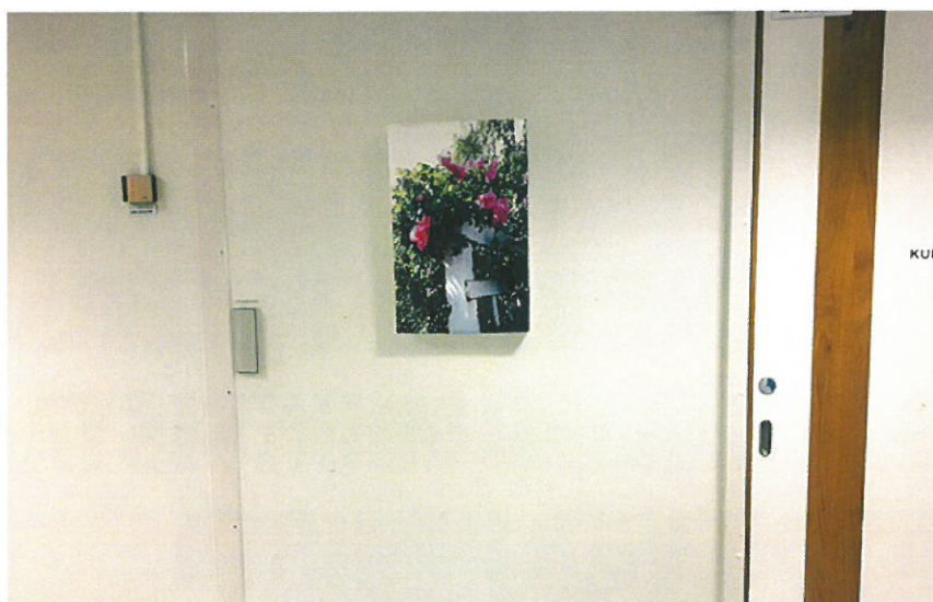
Valokuvatulosteet kesäisestä Oulusta. (Mirva Vallinmäki)