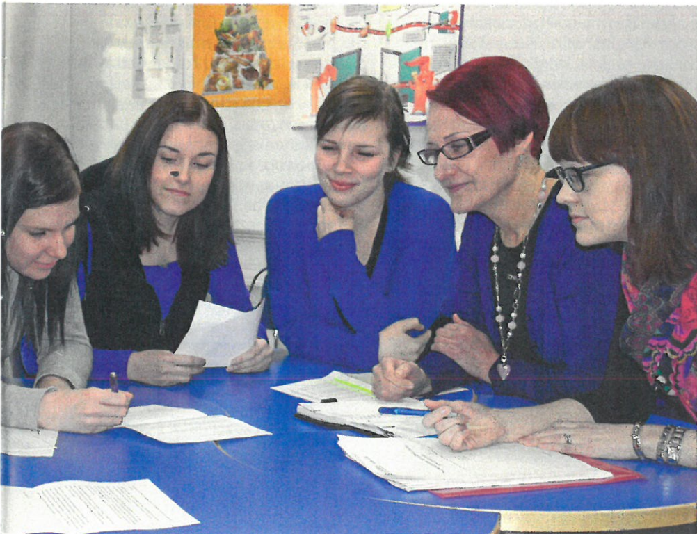
Yhteistyössä Young Love -tapahtumaa.

Terveydenhoitaja Hyvinkään kaupunki, seksuaalivoujo