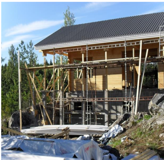
Kuva 3-Turvallinen teline

Yleisin työvaihe pientalotyömaalla, jossa tarvitaan putoamissuojausta, on vesikattotyöt. Vesikattotyöt tehdään yleensä korkealla ja turvallinen työn suorittaminen edellyttää telineiden käyttöä. Työmaan vastuuhenkilön tulee tarkastaa telineet ennen niiden käyttöönottoa.