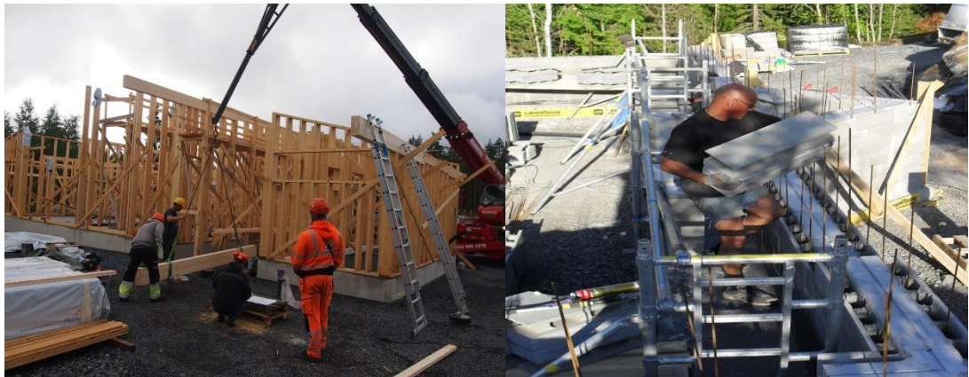
Kuva 5-Turvallista työskentelyä

Rakennustyömaalla on aina käytettävä turvajalkineita, kypärää, silmäsuojaimia sekä heijastavaa vaatekappausta, jossa on näkyvissä henkilötunniste. Kuulosuojaimia on käytettävä aina, kun melutaso ylittää 85 dB. Turvavaljaita on käytettävä aina, kun on olemassa putoamisriski. Työkäsineet ovat mekaanisia ja kemiallisia vaaroja vastaan. Hengityssuojainta on käytettävä aina, kun työmaalla on kemiallisia tai biologisia haittatekijöitä. Suojainluokka määräytyy tehtäväkohtaisesti. Polvisuojia on käytettävä aina polviasennossa työskennellessä.