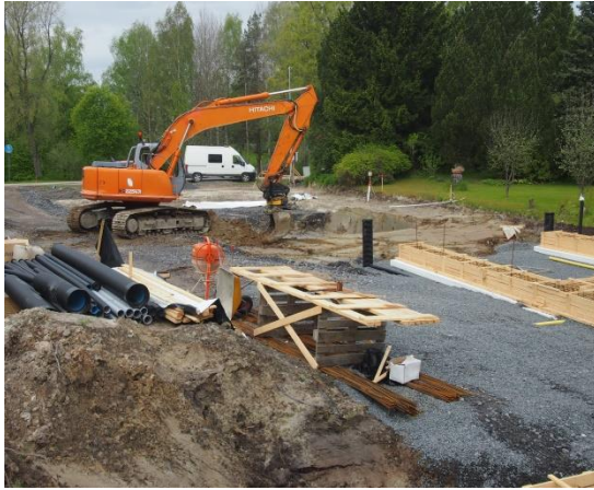
Kuva 1-Turvallinen rakennustyömaa