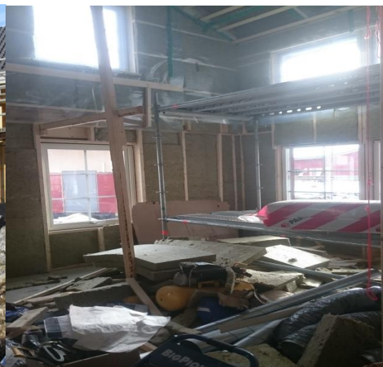
Kuva 4-Turvaton teline