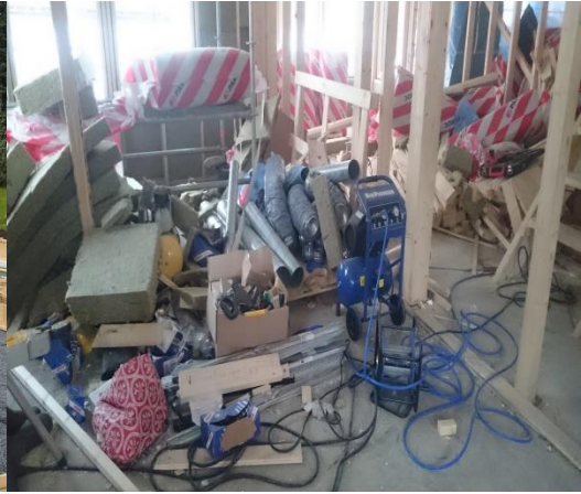
Kuva 2-Turvaton rakennustyömaa