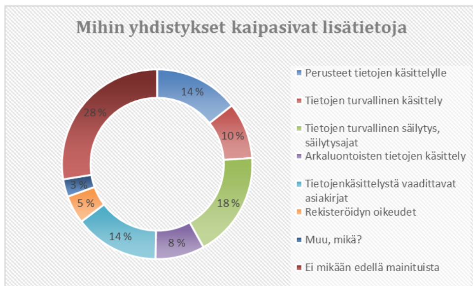
Kuva 3. Mihin yhdistykset kaipasivat lisätietoja

Kyselyn perusteella yhdistykset hallitsevat varsin hyvin tietosuoja-asetuksen tuomat muutokset henkilötietojen käsittelyyn. Kyselystä kuitenkin nousi esiin tiettyjä, oheisella ympyräkaaviolla kuvattuja käsittelyn osa-alueita, joihin olisi toivottu parempaa ohjeistusta.