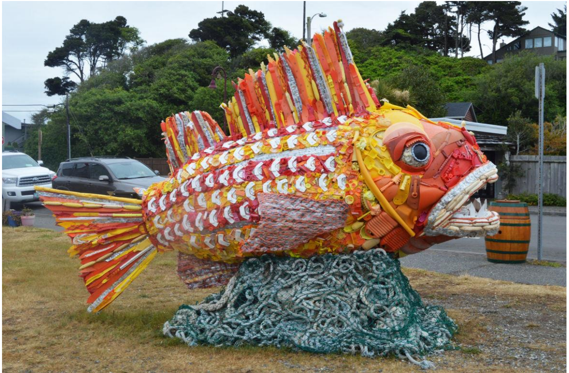
Kuva 9. Henry the Giant Fish. Kuva: Washed Ashore, 2019 https://washedashore.org/iamdc/ .

Teoksia ei maalata, vaan ne saavat värikkyytensä eri muoveista, jotka pestään ja lajitellaan värien mukaan. Osien yhteen kiinnittämiseen käytetään rautalankaa ja siimaa. Värikkäät ja nimetyt eläinhahmot voivat tuntua paikoitellen jopa naiivilta, mutta niillekin on merkitys: kaikki veistosten eläimet ovat uhanalaisia merten saastumisen seurauksesta. Nimeämisellä halutaan luoda veistoksista yksilöitä, hahmoja vähän niin kuin Nalle Puh, joka on inhimillinen ja helposti lähestyttävä. Välillä kuitenkin nimet kuten Henry the Fish ja Octavia the Octopus luovat mielikuvia lauantaiaamun lastenpiirretyistä, minkä koen ongelmalliseksi yrittäessäni tarkastella teoksia kantaaottavina taideteoksina enkä teemapuiston maskotteina. Kepeä ja leikkisä lähestymistapa voi olla toki virkistävää vaihtelua, mutta teoksen sisältö voi tällöin jäädä katsojalle toissijaiseksi. Teosten nimeäminen esimerkiksi lajien mukaan voisi toimia paremmin, koska silloin kiinnitämme huomionamme koko lajia uhkaavaan kriisiin. Koskettavimpana teoksena pidän valkoisesta muovista rakennettua valaan kylkiluuhäkkiä, joka yksinkertaisuudessaan havainnollistaa merten hälyttävää tilaa parhaiten. Luuranko rakenteena on helpompi yhdistää kuolemaan ja vaaraan kuin esimerkiksi värikäs ja eksoottinen kala.