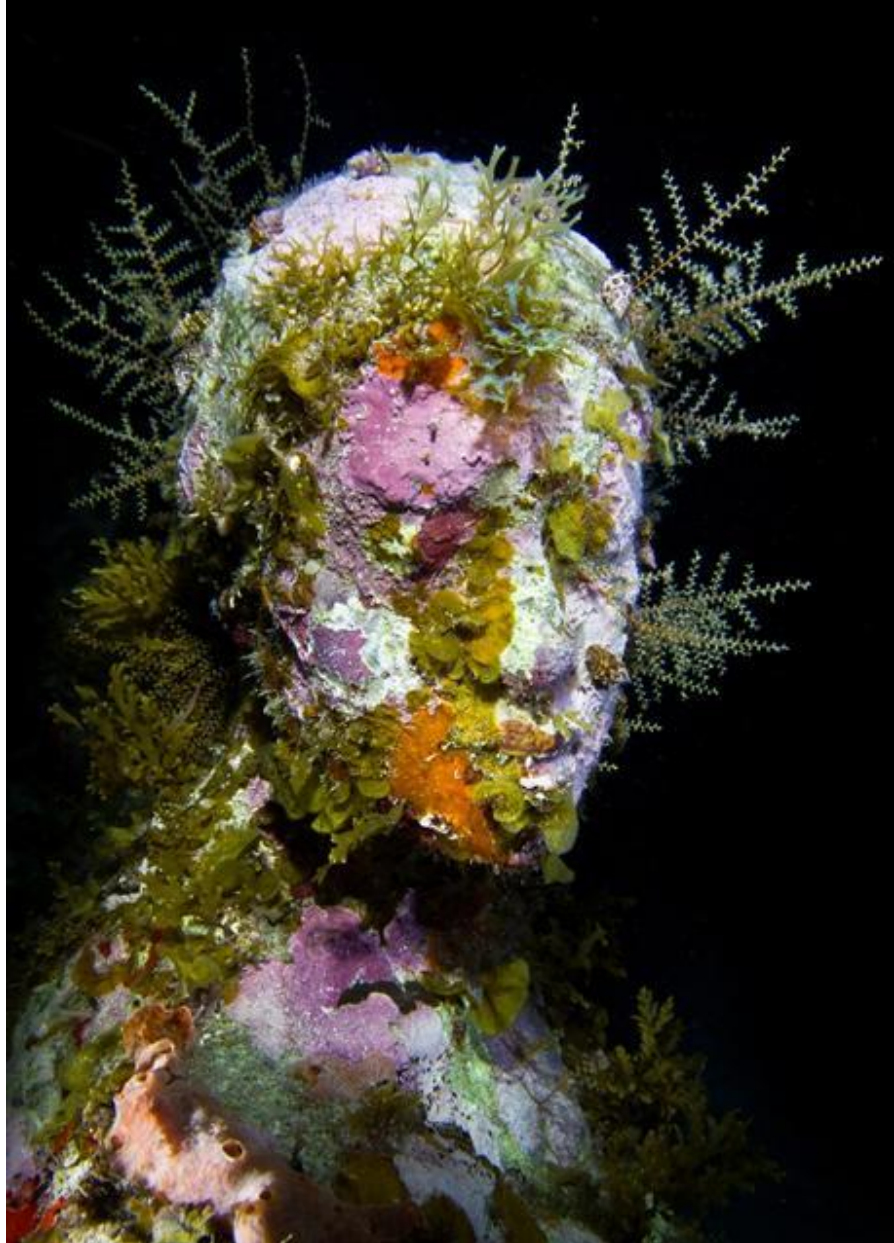
Kuva 3. Silent Evolution -veistos on peittynyt rakkolevän ja pesusienien värikirjoon.