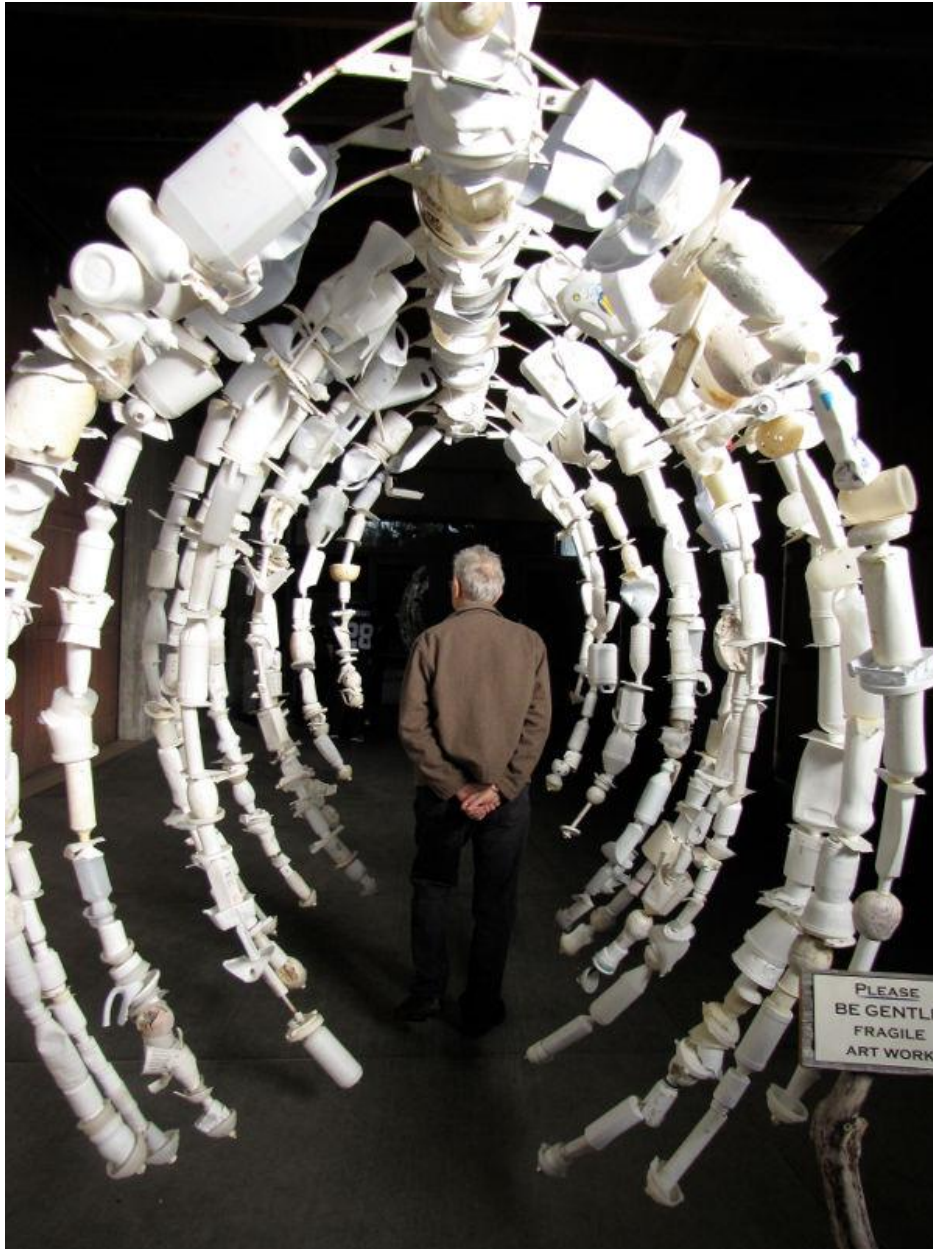
Kuva 10. Whalebone Rib Cage. Isokokoinen teos on rakennettu rautalangasta johon on pujotettu kannuja ja tölkkejä.