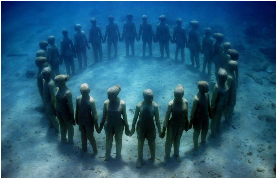
Kuva 1. Viscissitudes-teos meren pohjassa.