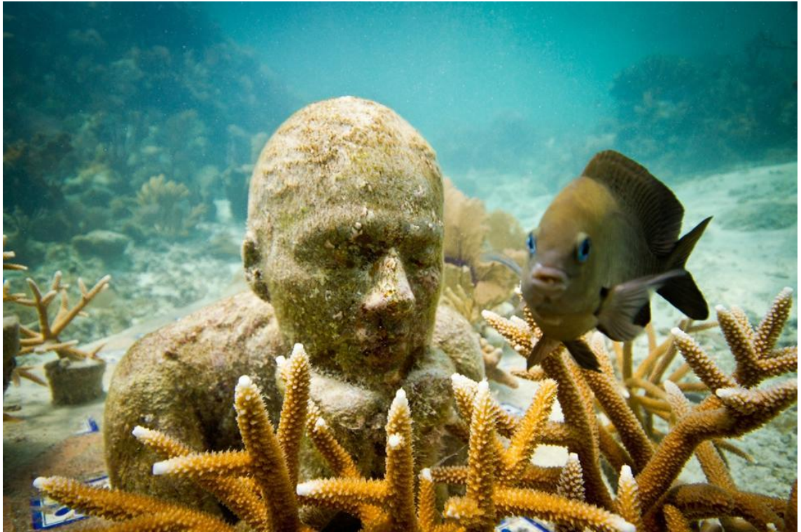
Kuva 2. Veistos Gardener ja Koralliahven. Veistokseen on alkanut muodostua levää ja koralleja, joita kalat mielellään syövät.