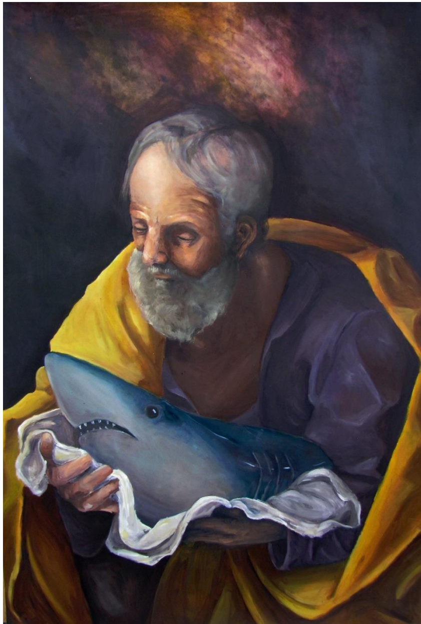
Kuva 13. Messias. Öljy kartongille. 100,5 x 86,5 cm. Emilia Asplund, 2018.