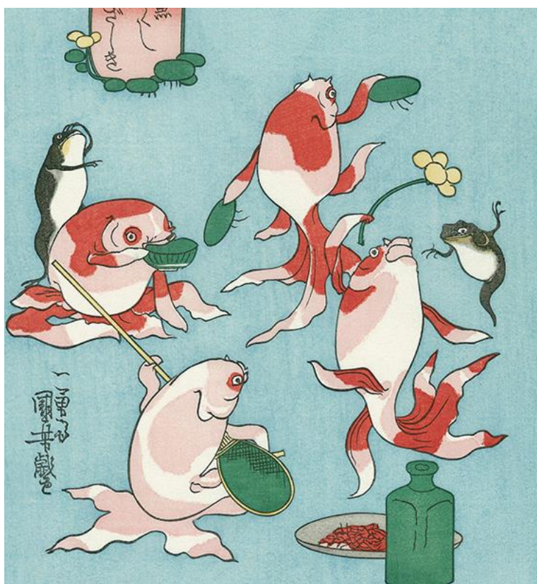
Kuva 12. Yksityiskohta teoksesta Sake No Zashiki, Utagawa Kuniyoshi. masterpiece-of-japanese-culture, 2019.