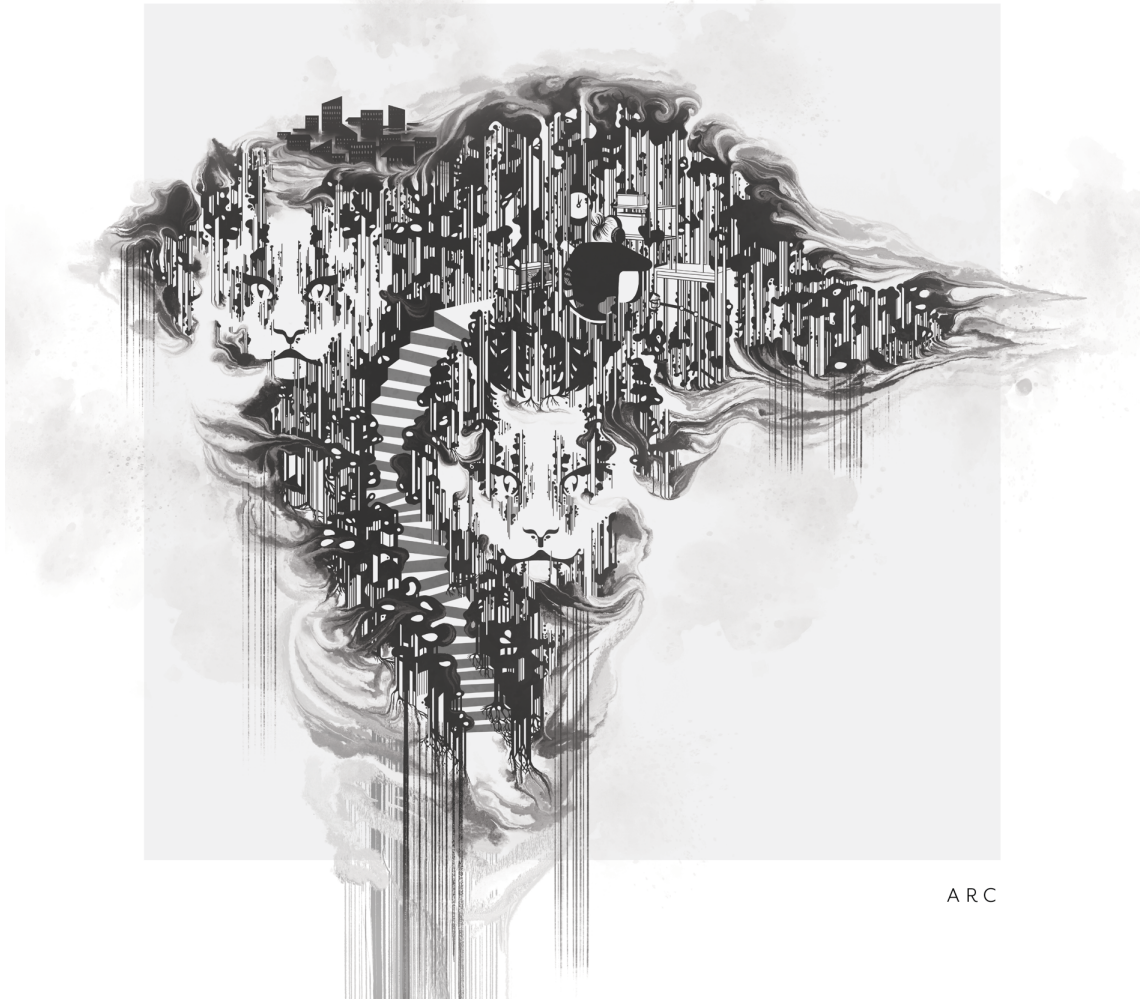
Kuvio 4. Arc-levyn kansi. Kannen on piirtänyt Anna-Leena Kirves.

Alkuvuodesta 2021 lähetin valmiin äänitteen promopakettin sekä saatekirjeen muutamalle julkaisevalle taholle Suomeen sekä Eurooppaan. Promopaketti sisälsi levyn kokonaisuudessaan, levyn kansitaiteen, audio trailerin levyn kappaleista sekä promokuvia minusta ja yhtyeestä. Ulkomaalaiset julkaisijat kuten Challenge Records ja Ozella Music vastasivat julkaisutiedusteluuni hyvin positiivissävytteisesti, mutta kertoivat että koronaviruksen aiheuttaman julkaisuviiveen johdosta heidän julkaisukanavansa olivat täynnä pitkälle vuoteen 2022. Tämän johdosta he eivät valitettavasti voineet panostaa uusiin tulokkaisiin, sillä heidän omilla artisteillaan oli jonossa paljon julkaistavaa.