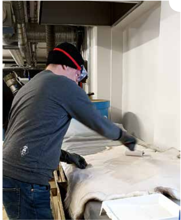
Taljan käsittelyä kyllästysaineella.

Taljat on hyvä pakata muovipussiin ja pahvilaa-tikkoon vain vähän ennen lähettämistä. Myös asiakkaan hakiessa taljan suoraan, on kohteliasta pakata se vähintään pussiin. Pakkausmateriaalit