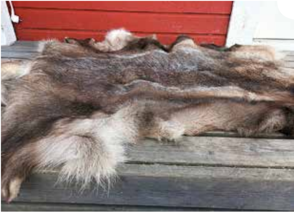
Vapaasti kuivunut (pingottamaton) talja jää pinnaltaan epätasaiseksi.