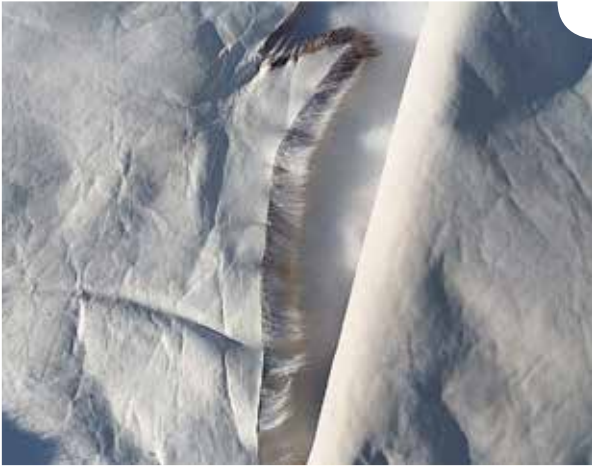
Ulkokäyttöön soveltuva muokattu talja vasemmalla, sisäkäyttöön tarkoitettu muokattu talja oikealla.