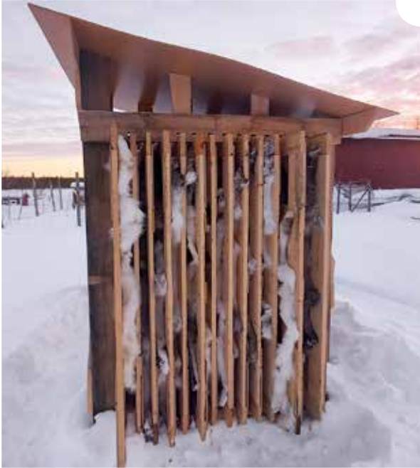
Taljankuivausteline tiiviillä täytöllä.