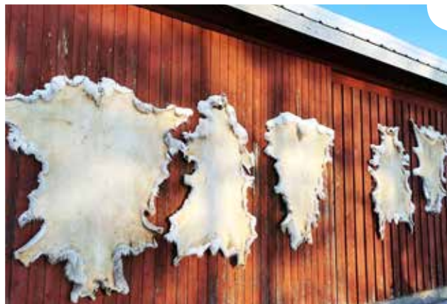
Ilmakuivattuja porontaljoja seinällä.

Jos taljaan on jäänyt teurastuksessa lihan, rasvan ja kalvon jäänteitä, ne tulisi poistaa. Suotuisissa olo-