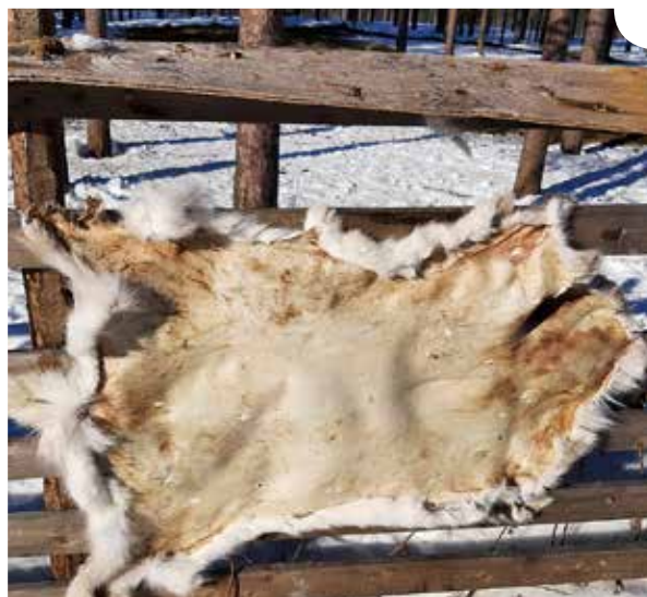
Ruuveilla lauta-aitaan kiinnitetty talja, huomaa taljan päälle kiinnitetty vaneripala. Kapeakin katos on riittävä suojaamaan taljaa lumija vesisateilta.