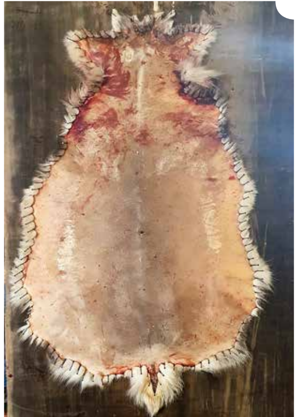
Mitä tiheämpi kiinnitys taljalla on, sitä varmemmin siitä saadaan suora ja tasainen. Kuivatun taljan kiinnitystä ei ole syytä ylivoimistaa, mutta siihen tulee kuitenkin panostaa riittävästi laadun varmistamiseksi.

Taljoja on hyvä tarkkailla koko kuivaamisajan säännöllisesti: kiinnityksiä voi joutua kiristämään, taljaan ei tulisi päästä kertymään paksua lumikerrosta ja tuhoeläintorjunnasta tulee huolehtia. Taljat tulee ottaa kuivumasta viimeistään huhti-toukokuun vaihteessa.