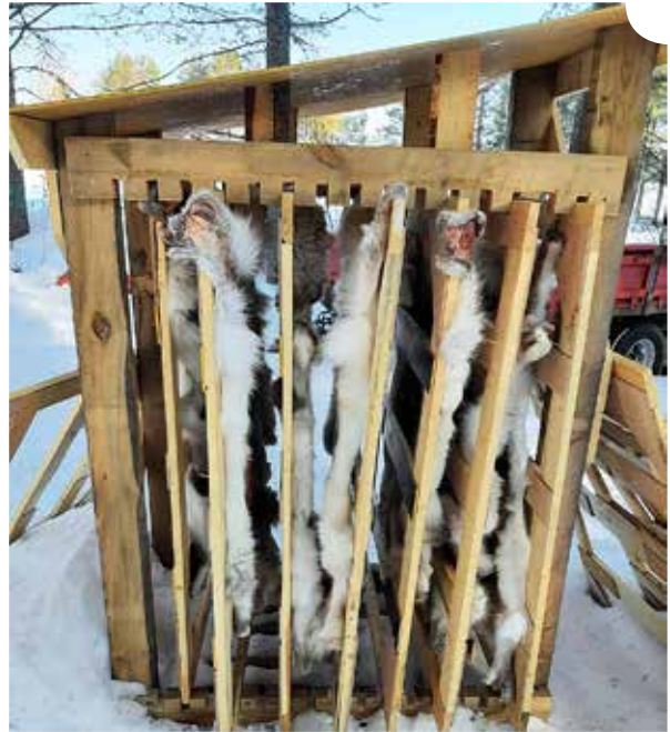
Taljankuivausteline väljällä täytöllä.

taljojen nahkapuoli ei tule väriltään yhtä valkoiseksi kuin seinällä kuivattujen taljojen pinta. Syynä tähän on ilmeisesti telineen taljojen vähäinen altistuminen auringonsäteilylle. Tämä ei kuitenkaan estä taljojen myyntiä.