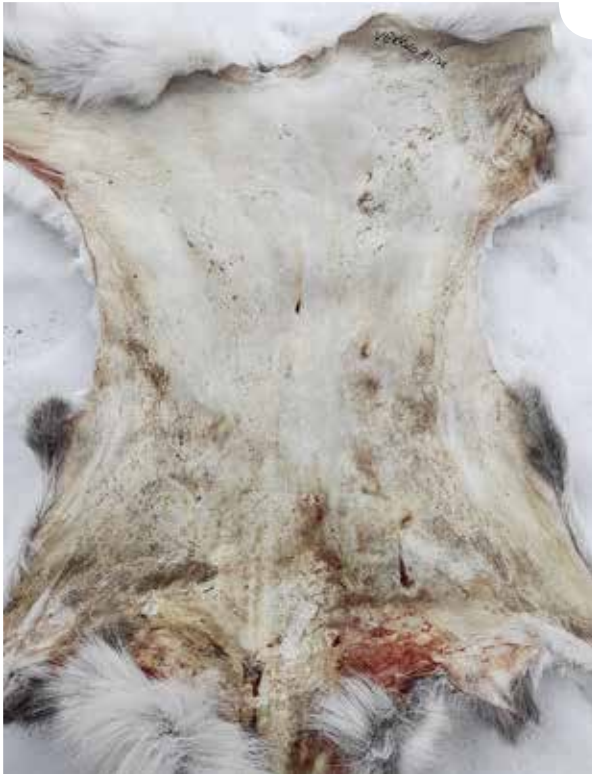
Valmis verkkoaidassa kuivattu talja.