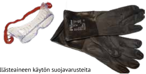
Taljan kyllästeaineen käytön suojavarusteita ovat pitkät hihat, EN 166:n mukaiset sivusuojilla varustetut suojalasit sekä EN 374:n mukaiset butyylikumiset kemikaalisuojakäsineet.

ja rahtiyhteydet kannattaa kilpailuttaa sekä pyrkiä yhteishankintoihin toisten alan yrittäjien kanssa. On tärkeää liittää taljan mukaan sen käyttöohjeet tuottajan yhteystiedoilla varustettuna (liite 2). Ohjeistuksessa tulee ottaa huomioon myös vieraskieliset asiakkaat. Tulostettava ohjeistus, sekä sen kieliversioita on saatavilla myös Paliskuntain yhdistyksen nettisivuilta osoitteesta: https://paliskunnat.fi/ohjeet_oppaat/ .