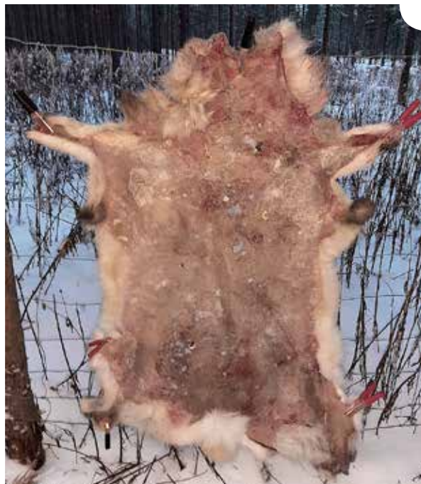
Latauspuristimilla verkkoaitaan kiinnitetty talja.