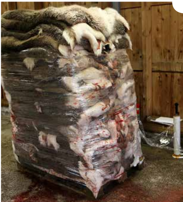
Taljalavat voidaan sitoa kiristekalvolla.