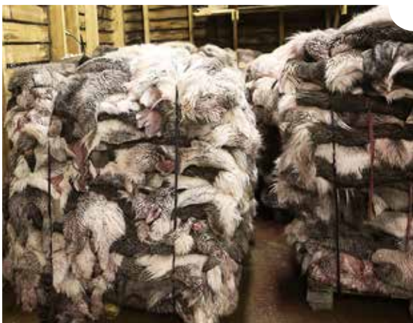
Taljalavat voidaan sitoa muovivanteilla.

lään vähintään viikko ennen toimitusta. Jos taljoja säilytetään pidempään, ne suolataan uudestaan. Taljoja voi suolata useita päällekkäin, asettaen aina karvapuolen alaspäin.