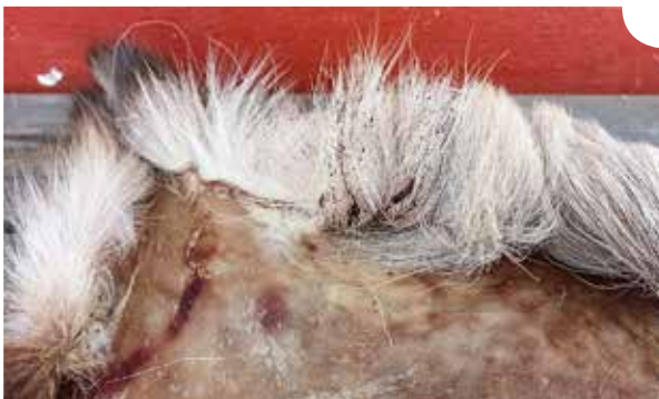
Veriroyksket ja ulostetahrat tulee poistaa taljoista.