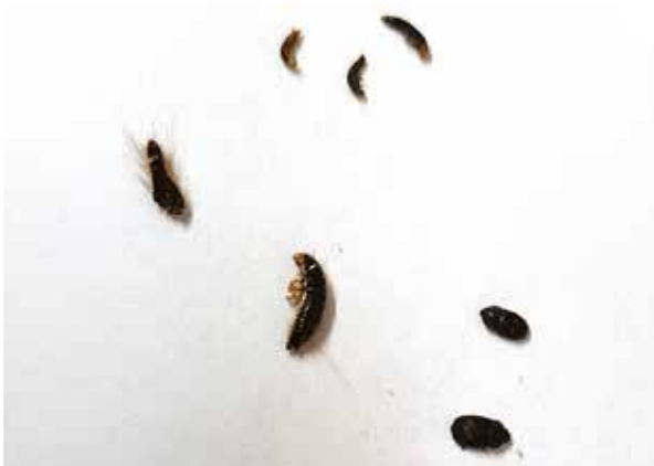
Taljoissa voi olla turkiskuuoriaisen eri kehitysvaiheita.