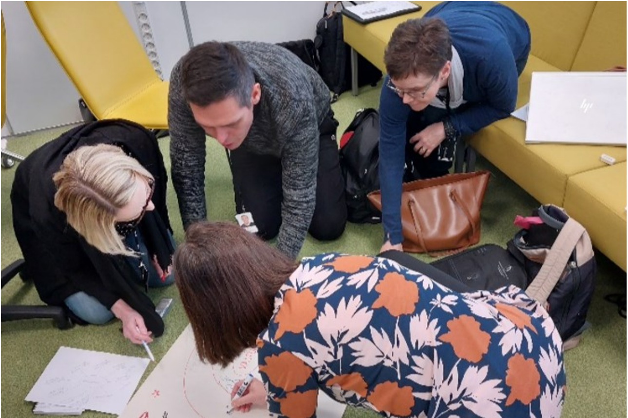
KUVA 1. Pienryhmä työskentelee.

mitä kestävä kehitys ja vastuullisuus tarkoittavat hyvinvoinnissa, taloudessa ja ympäristössä omassa organisaatiossamme. Edelleen tavoitteena oli tehdä näkyväksi, miten Ammatillisen opettajankoulutuksen yksikössä huomioidaan kestävä kehityksen periaatteet arjen toiminnoissa konkreettisina tekoina. Työpajatyöskentely (kuva 1) oli innovatiivista ja se tuotti runsaasti näkökulmia vastuullisuuden ja kestävä kehityksen teemoihin.