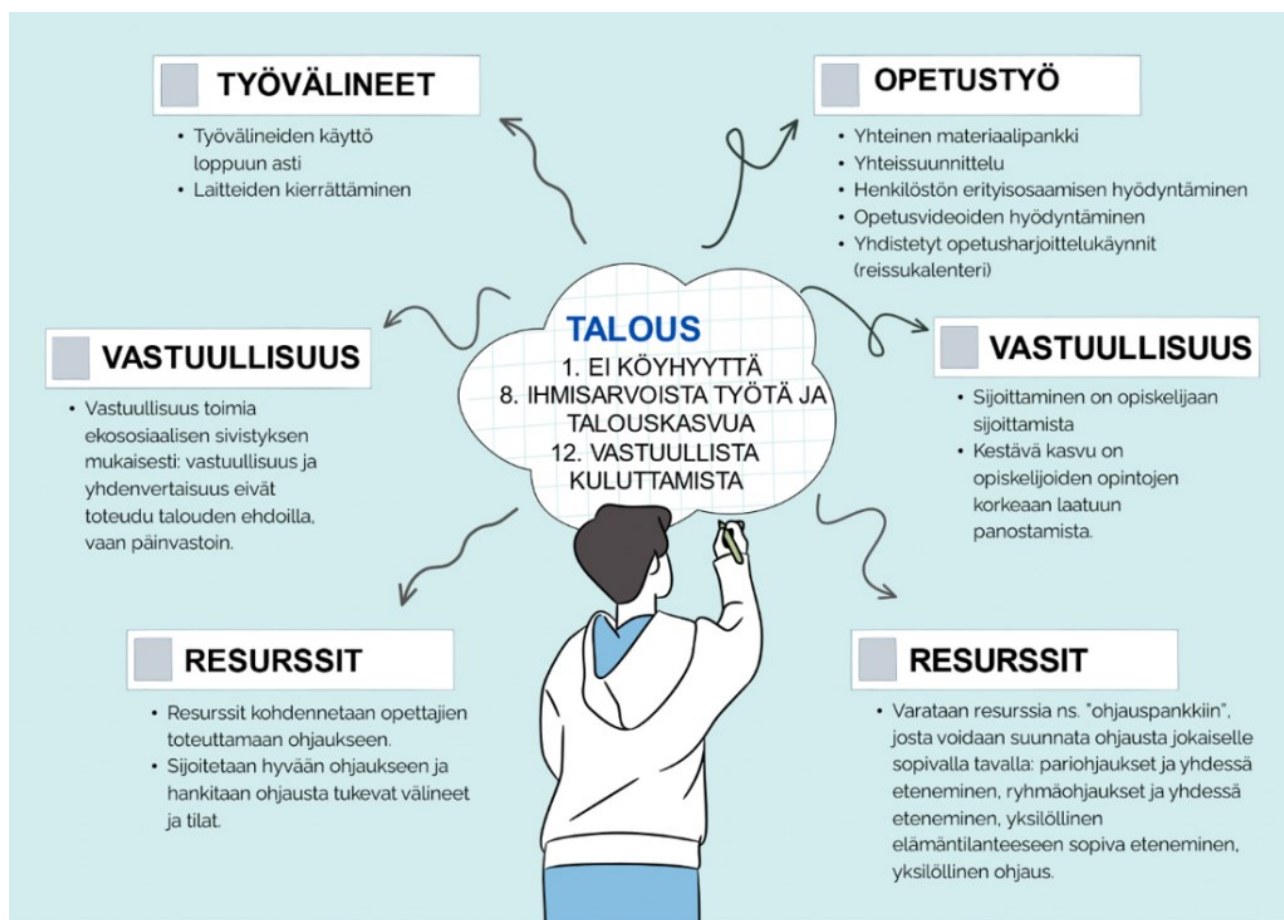
KUVIO 2. Koonti siitä, mitä taloudellisuus on arjen tekoina Oamkin Ammatillisen opettajankoulutuksen yksikössä.

Kestävä ja vastuullinen talous koettiin muodostuvan erityisesti kehittämällä opetustyöhön liittyvää yhteistyötä. Samoin tärkeäksi koettiin resurssien ja laitteiden tarkoituksenmukainen käyttäminen. Taloudellista vastuullisuutta peilattiin suhteessa yhdenvertaisuuteen ja ekososiaaliseen sivistykseen. (Kuvio 2.)