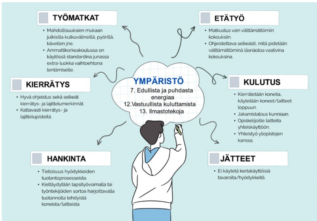
KUVIO 3. Koonti siitä, mitä ympäristöasiat ovat arjen tekoina Oamkin Ammatillisen opettajankoulutuksen yksikössä.

Ympäristöä koskevissa arjen teoissa korostuivat erityisesti valinnat, joita jokainen ihminen voi tehdä päivittäin omassa toiminnassaan. Esille tuli näkemyksiä myös siitä, miten työympäristö mahdollistaa ja kannustaa ympäristöystävällisten valintojen tekemiseen. (Kuvio 3.)