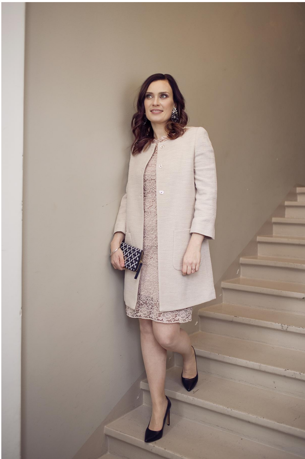
Figur 5. Festklädsel två