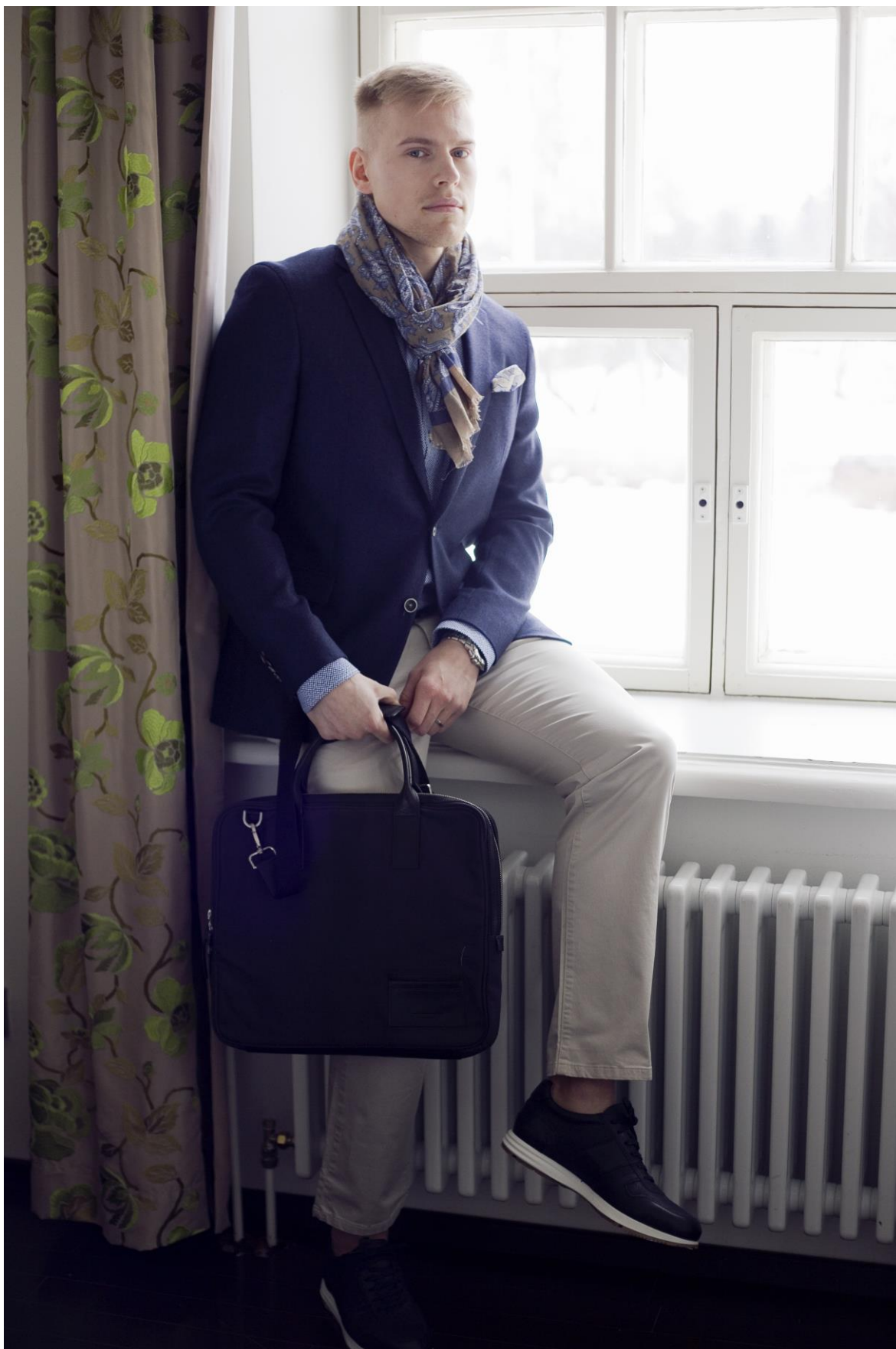
Figur 2. Arbetsklädsel ett