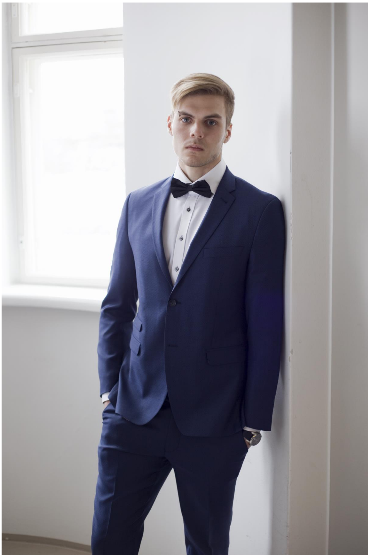
Figur 4. Festklädsel ett