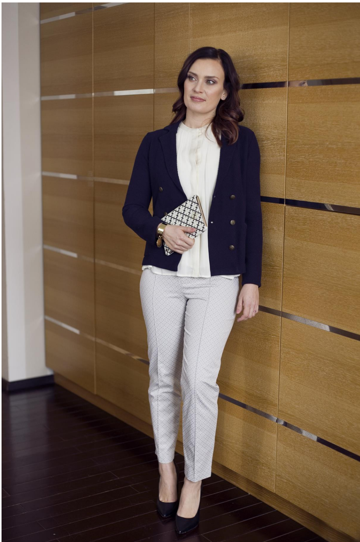
Figur 3. Arbetsklädsel två