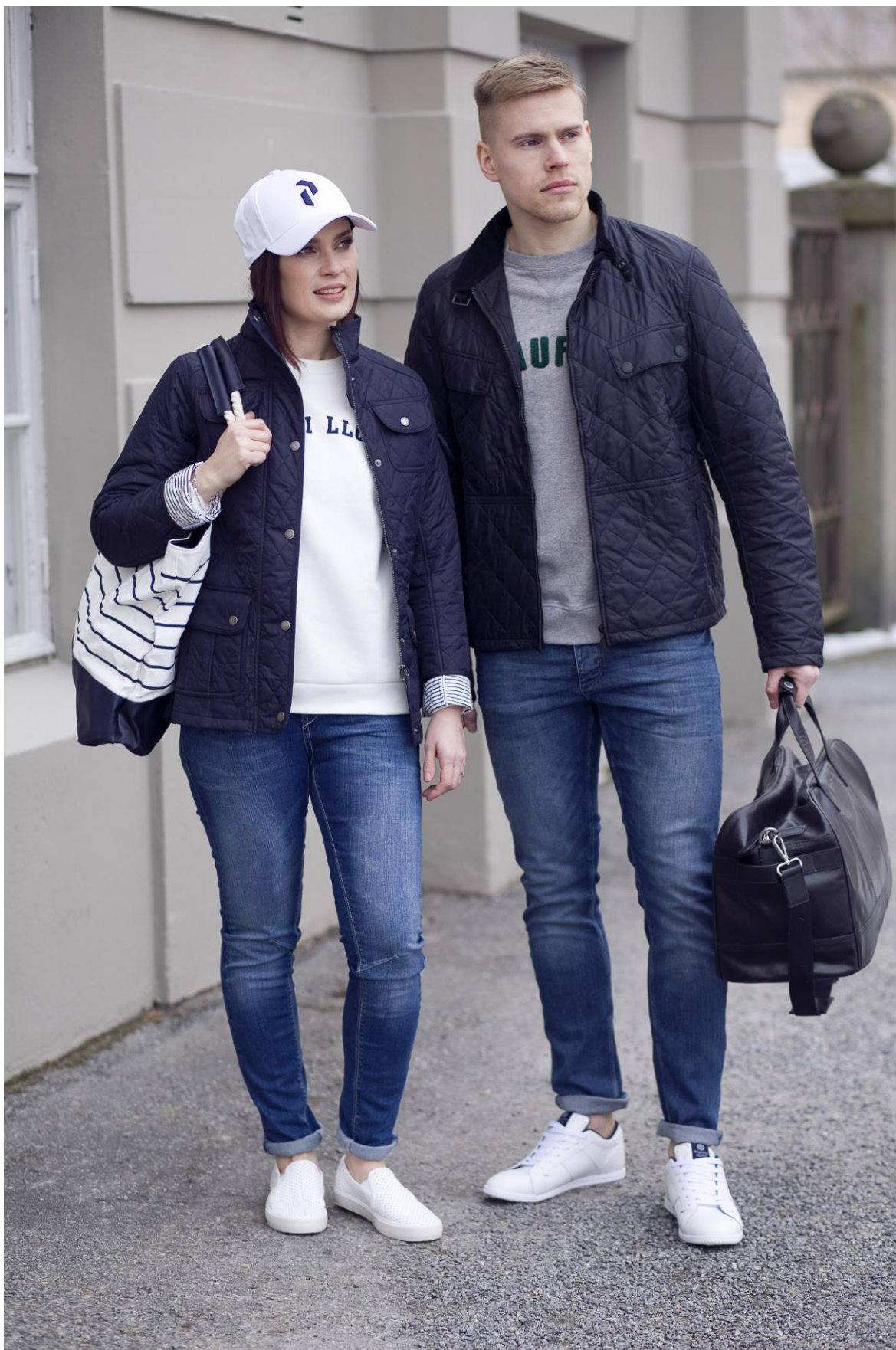
Figur 1. Fritidsklädsel ett och två