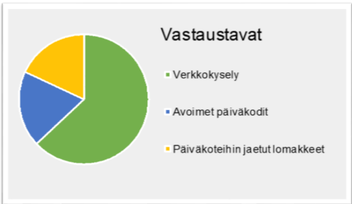
KUVIO 1. Kyselyn vastaustapojen jakautuminen

Vastauksia kyselyyn tuli yhteensä 227 kappaletta. Kyselyyn vastasi 3 % porvooolaisista lapsiperheistä. Suurin osa vastauksista saatiin verkkokyselyn kautta. Muut kyselyvastaukset kerättiin jalkautumalla avoimiin päiväkoteihin sekä jakamalla kyselylomakkeita neljään päiväkotiin.