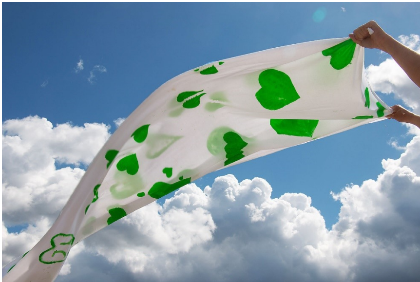
Kuva 16. Tuli yllättävän hienoja -näyttelyn pressikuva.

Tässä luvussa kuvailen näyttelyiden rakentumista yhteistyökumppaneiden kanssa. Pohdin pitkään, mikä olisi toimiva tapa tuoda prosessia ja havaintoja julkiseksi. Taidepajassa oli kyse perheiden yksityisistä kohtaamisen hetkestä kuvataiteen äärellä. Tarkoituksena oli ollut arvioida tekijöitä lopputuloksesta käsin, sillä kyseessä ei ollut taideryhmä. Halusin tuoda esille ihmissuhteita, joiden kestävyyttä koetellaan vankeustuomion aikana. Suunnittelin kiertävän näyttelyn, joka koostuu valokuvista ja teoksista.