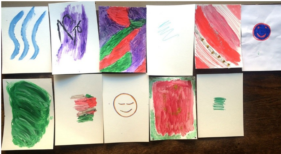
Kuva 14. Osa Lempivärit -korttisarjasta.