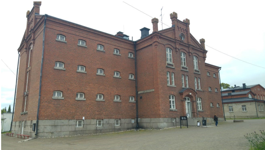
Kuva 18. Kansallismuseon Vankila, Hämeenlinna.