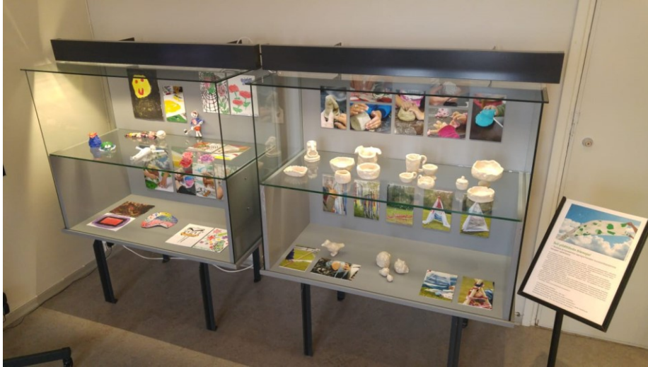
Kuva 17. Näyttelyviitriinit Kansallismuseon Vankilan galleriatilassa.

Ripustaminen sujui hyvin. Saimme Paijan kanssa apua museohenkilökunnalta. Paikalla oli asentaja, sähkömies, vartija ja siivoaja. Museo-oppaat kävivät tutustumassa näyttelyyn ja kiittivät sen järjestämisestä. Vankila oli samaan aikaan avoinna yleisölle. Keskustelut vierailijoiden kanssa tuntuivat merkityksellisiltä. Yksi vierailija ilahtui valmiiden teosten näkemisestä. Hän oli ollut kuljettamassa vankeja Vanajan kuvataidepajoihin. Askartelumassasta valmistettu Tappara-mies sai runsaasti positiivista huomiota.