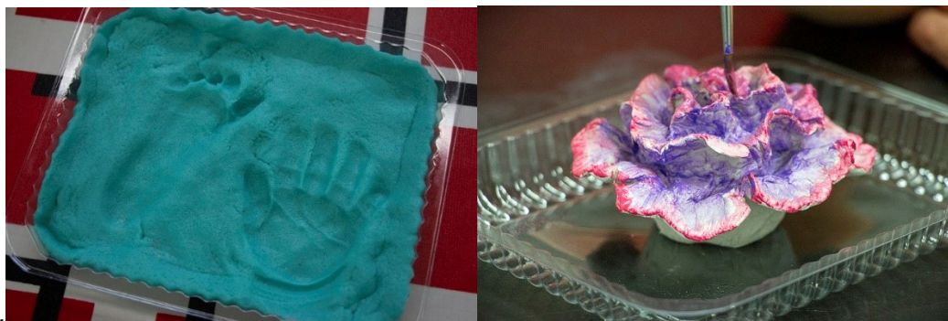
Kuva 15. Mieleen jääneitä teoksia.

Vastausten mukaan taidepaja oli vastannut odotuksia. Ennakkoinfoa pidettiin vastauksissa riittävänä ja kattavana. Melkein kaikki vastaajat tiesivät mihin olivat osallistumassa. Yksi vastaaja totesi, että taidepaja oli "kiva yllätys" . Vastauksista päätellen ennakkomainos ja infotilaisuudet olivat tavoittaneet osallistujat. Sisällöllisesti mainonta oli pitänyt lupauksensa. Kukaan vastaajista ei ollut pettynyt. Taidepajan sisältö oli "odotukset ylittävää" .