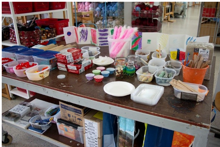
Kuva 3. Taidemateriaalien noutopöytä.

leja oli tarjolla yhteisessä ”noutopöydässä”. Perheet työskentelivät pöytäryhmittäin. Pöydät ja tuolit olivat hieman eri korkuisia. Kalustetarjontaa täydennettiin tuomalla perheosastolta syöttötuoleja. Työskentelyn päätyttyä siivosimme tilat itse.