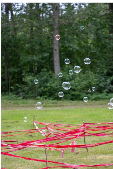
Kuva 12. Hämähäkinverkko, mysteeriaitus vai jättimäinen unisieppari?

Rakentelupajaan osallistuneille annettiin pieni kiitoslahja: saippuakuplia ja rantapallo. Ulkona työskentely oli mukavaa vaihtelua. Meduusoista ja teltoista tuli lapsille niin tärkeitä, että he halusivat ne mukaansa. Viimeinen kerta oli työpajojen huipentuma ja juhla. Taideokset muodostivat elämyksellisen ja yhteisöllisen tilakokemuksen. Siinä osallistujat pääsivät ottamaan vankilatilaa konkreettisesti haltuun taiteen keinoin. Osallistujat pääsivät näkemään omat ja toisten teokset. Perheen kanssa yhdessä valmistettu työ oli esillä toisten joukossa. Ympäristöön ripustettu teos näyttytyy tekijöilleen erilaisena kuin työpöydän äärellä tarkasteltuna.