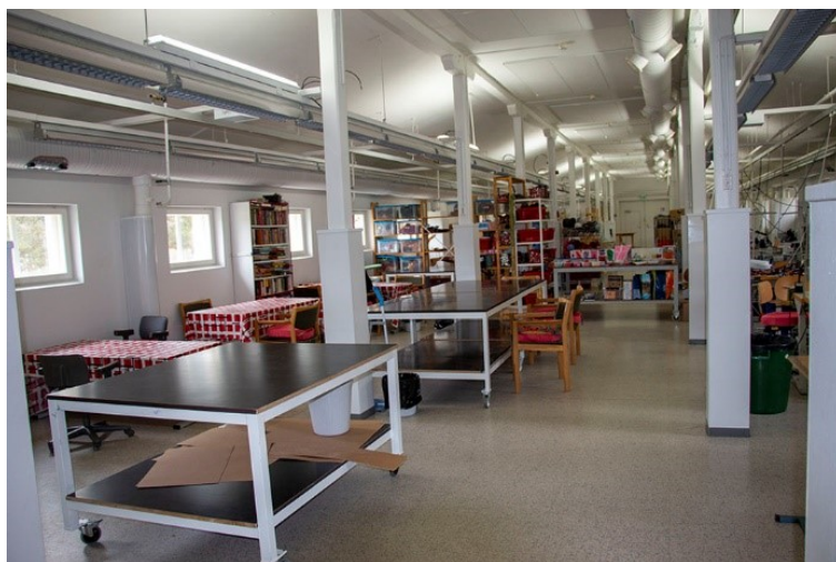
Kuva 2. "Punainen paja" eli vankilan ompelimo.