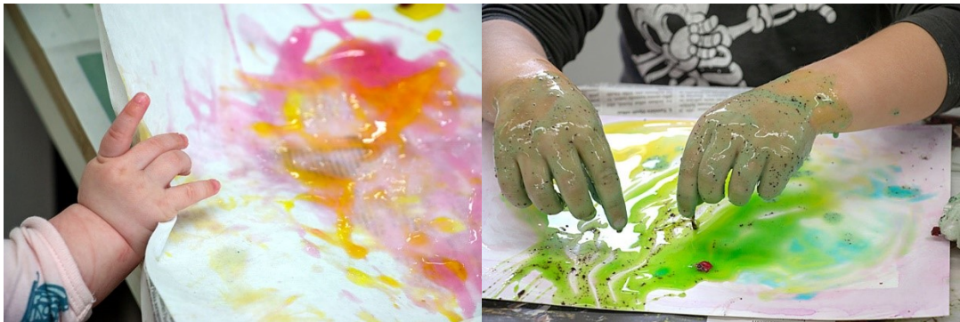
Kuva 7. Vauvojen värikylpy on moniaistinen kokemus.

Vaikka käytössä oli siveltimiä, kannustin maalaamaan ”kymmenellä tuntevalla siveltimellä” eli paljailla käsillä. Monet suojasivat kätensä kertakäyttöhanskoilla. Pienimmät heittäytyivät työskentelyyn antaumuksella. Aikuisetkin osallistuivat, vaikka vaikutti siltä, että se ei ollut niin mielekästä. Joitakin vanhempia harmitti, että lasten vaatteet likaantuivat. Lasten suojaessuille olisi ollut tarvetta. Kertakäyttöessuja askarreltiin jättesäkeistä.