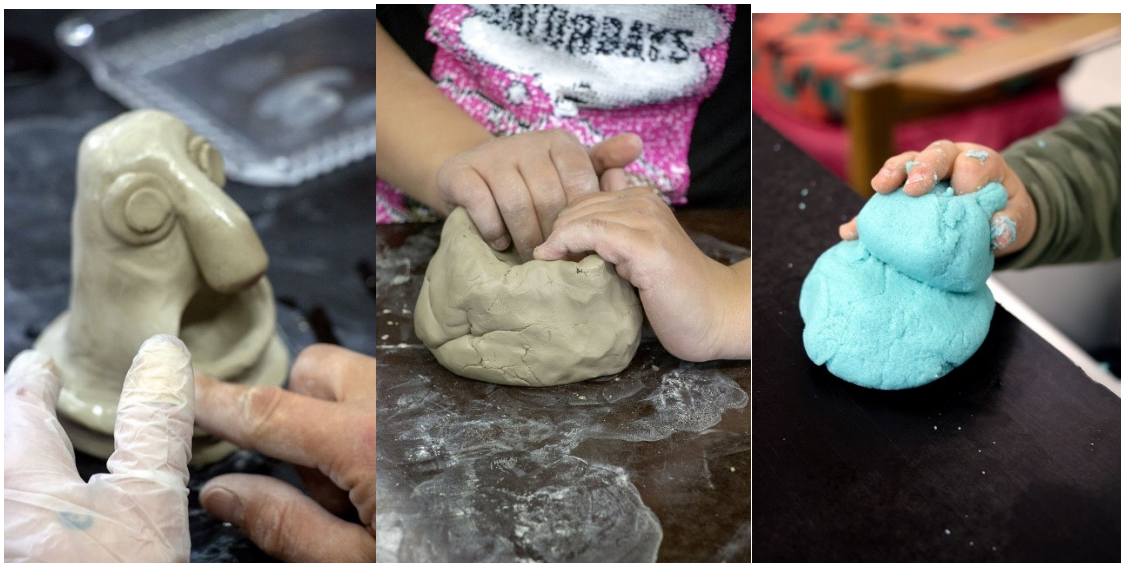
Kuva 6. Työskenteleviä käsiä ja uusia aloituksia.