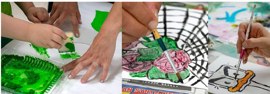
Kuva 8. Kankaanpainantaa ja akryylimaalausta.

Koska satoi, lounastauko vietettiin sisätiloissa. Muutama lapsista turhautui ja se ilmeni levottomuutena. Perheillä oli mahdollisuus tutustua valokuviin, joita olin ottanut muotoilupajassa.