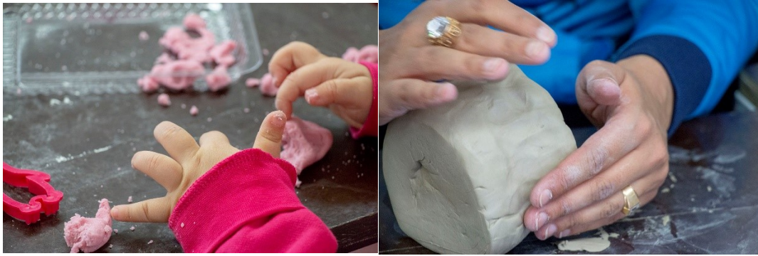
Kuva 5. Taikataikinan ja kivitavarasaven työstämistä.