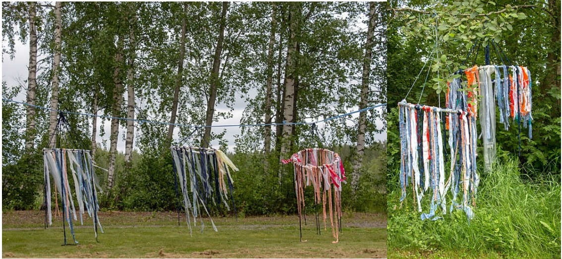
Kuva 10. Matonkudemeduusat tanssivat Vanajaveden rannalla.

Vankilaympäristöä käytettiin myös näyttelytilana. Meduusat ripustettiin iltopäivällä esille laavurantaan.