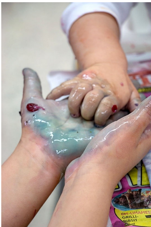
Kuva 13. Sisarusten kohtaaminen maalauksen äärellä.

Vaikka tilanteessa ei sanallisesti keskusteltu, kohtaaminen rakentui tunnustellen, yhteisen tekemisen äärellä.