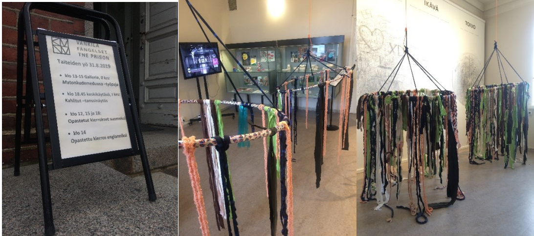
Kuva 20. Vankilan Matonkudemeduusa -paja Hämeenlinnan Taiteiden yössä.