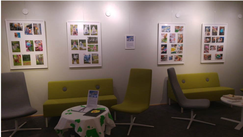
Kuva 21. Tuli yllättävän hienoja -valokuvanäyttely Tampereella.