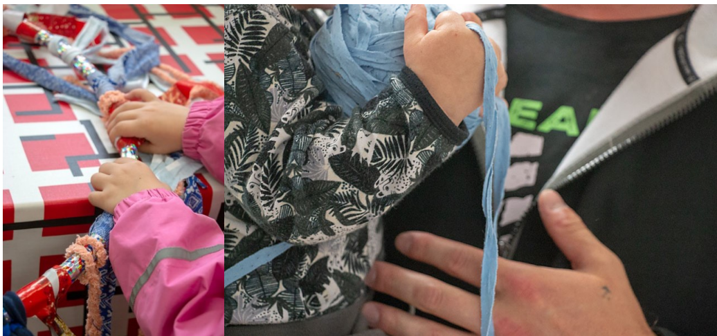
Kuva 9. Matonkudemeduusat valmistuvat.

Koska tehtävä oli helppo, työskentely sujui nopeasti. Lapset valitsivat meduusaan värejä ja aikuiset auttoivat kiinnittämisessä. Perheen yhteisteoksen valmistaminen sujui rauhallisesti ja omassa tahdissa. Matonkudepallot taipuivat rauhalliseen leikkiin. Parivuotiaan sylissä matonkude muuttui halinalleksi ja lattialla jalkapalloksi. Koko perhe ihaili lapsen taitoa potkia palloa.