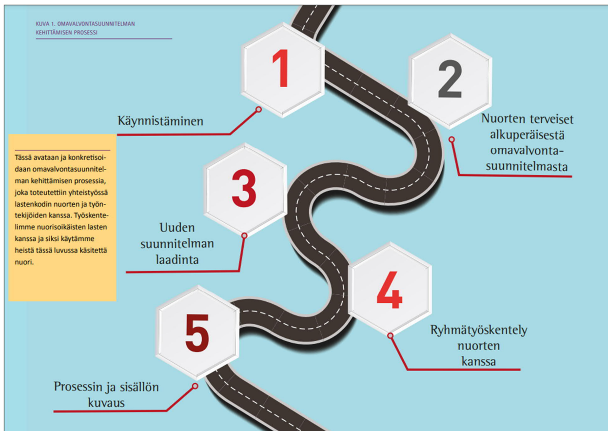
Kuva 2. Prosessikuvaus (Omavalvontasuunnitelman kehittämisen prosessi)

Konkreettinen kehittämistyö käynnistyi Naulakallion lastenkodin kanssa (kuva 2.). Intro-osastoilta mukaan liittyi osastojen vastaava ohjaaja sekä opinnäytetyön kirjoittaja, vastaavan ohjaajan tarjottua hankkeesta opinnäytetyön tekemisen mahdollisuuden. Hankkeeseen tuli mukaan myös kokemusasiantuntijanuoria Osallisuuden aika ry:stä sekä projektityöntekijä Puolellasi ry:n NOJA-hankkeesta.