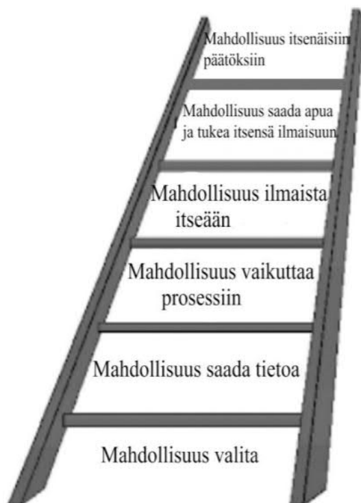
Kuva 1. Osallisuuden tikapuut Nigel Thomasin mukaan (Thomas 2002, 174–176)

Bristolin yliopistosta Nigel Thomas hahmottaa osallisuuden viiteen eri ulottuvuuteen teoksessaan Children, Family and the State . Hänen mukaansa osallisuuden ensimmäinen ulottuvuus on lapsen mahdollisuus valita, osallistuuko hän prosessiin vai ei ja se itsessään on jo osallisuutta. Thomasin mallin mukaan osallisuus jakautuu kuuteen portaan (kuva 1). (Thomas 2002: 174-176.)