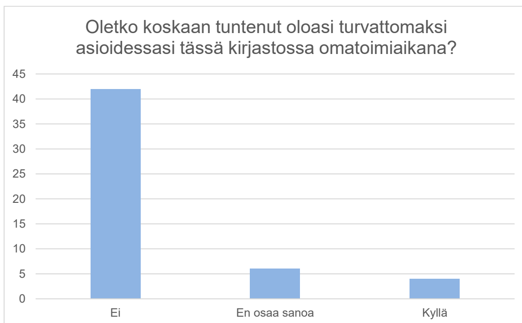
Kuvio 2: Turvattomuuden tunne

Kuten myös kuvio 2 näkee, suurin osa kyselyyn vastanneista ei ollut kokenut oloaan turvattomaksi kirjaston omatoimiaikana.