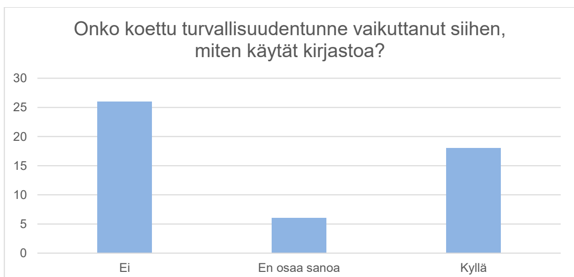
Kuvio 4: Turvallisuudentunteen vaikutus kirjaston käyttöön

Viidennen kysymyksen ”Onko koettu turvallisuudentunne vaikuttanut siihen, miten käytät kirjastoa?” vastaukset jakoutuivat kuvion 4 mukaisesti. Hieman yli puolet vastasi ettei koettu turvallisuudentunne ole vaikuttanut kirjastonkäyttöön, mutta ”kyllä” vastauksia tuli lähes saman verran. Kaksi kyselyyn osallistunutta ei vastannut tähän kysymykseen.