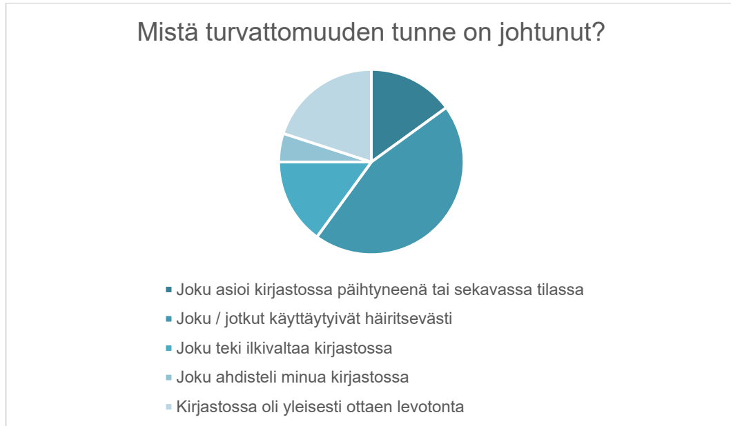
Kuvio 3: Turvattomuuden tunteen syyt

nämä kaksi vaihtoehtoa oltaisiin voitu muotoilla paremmin kyselylomakkeessa, ja on mahdollista että vastaajat tulkitsivat tämän kohdan eri tavoin kuin kyselylomakkeen laatija. Kaikkiin tämän kysymyksen vaihtoehtoihin tuli kuitenkin vastauksia.