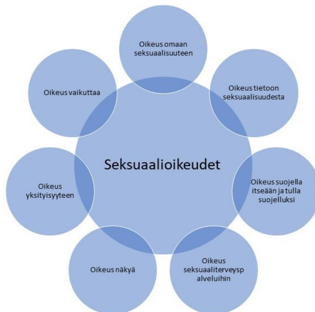
Kuvio 1: Seksuaalioikeudet (mukaillen Väestöliitto 2021h).

Seksuaalioikeuksiin kuuluu oikeus tehdä omaan terveyteen, kehoon, seksuaalisuuteen ja lisääntymiseen liittyviä päätöksiä, ilman syrjintää, pakottamista tai väkivaltaa. Oikeudet kuuluvat aivan jokaiselle. Sillä ei ole merkitystä mitä sukupuolta olet, minkälaisia perhesuhteesi ovat, minkä ikäinen olet tai mitä valintoja teet koskien lisääntymistä. Seksuaalioikeuksiin kuuluu myös lisääntymisterveysoikeudet. (Amnesty 2021.) Seksuaalioikeudet voidaan jakaa seitsemään kategoriaan, jotka ovat esitetty kuviossa 1. Kaikilla on oikeus omaan seksuaalisuu-