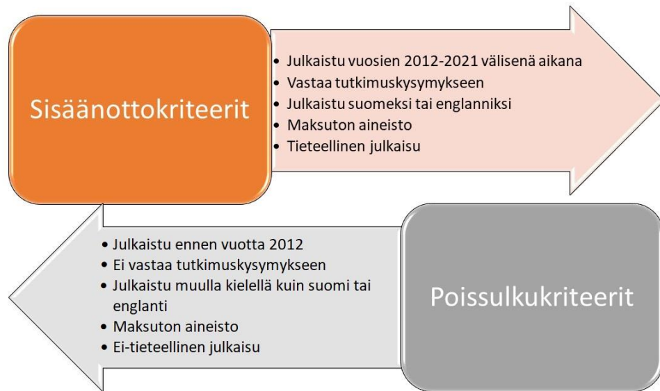
Kuvio 4: Sisäänotto- ja poissulkukriteerit