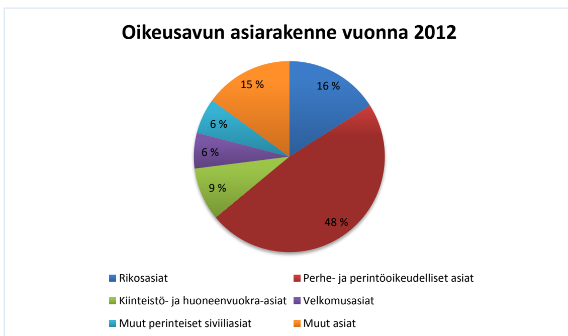
Kuva 3: Oikeusavun asiarakenne vuonna 2012.

keudellisia asioita 144 . Lisäksi myös rikosasioiden osuus koko oikeusavun asiarakenteesta oli suuri. Oikeusturvavakuutuksen korvauspiirin tarkastelun kannalta näiden asioiden suuret osuudet eivät sinällään ole yllättäviä. Oikeusturvavakuutuksestaan ei, kuten aiemmin jo todettu, pääsääntöisesti korvata oikeudenkäyntikuluja tämän tyyppisissä asioissa 145 lukuun ottamatta rikosasioissa asianomistajan yksityisoikeudellisten vaatimusten esittämisestä aiheutuvia kustannuksia. Lisäksi perinnön jako ei sellaisenaan kuulu oikeusturvavakuutuksen piiriin. Jos perinnönjako kuitenkin on riitautettu ja se on saatettavissa käräjäoikeuden käsittelyyn, kuluista voi saada korvauksia oikeusturvavakuutuksen perusteella. Näin ollen voitaisiin jo lähikohtaisesti olettaa, että oikeusavun asiarakenne painottuu nimenomaan niihin asioihin, joihin oikeusturvaetua ei pääsääntöisesti myönnetä.