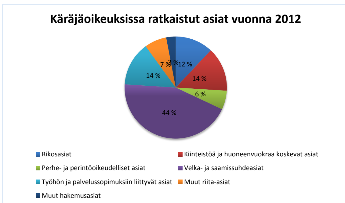
Kuva 2: Käräjäoikeuksissa ratkaistut asiat vuonna 2012 142

Vuonna 2012 käräjäoikeuksissa ratkaistiin yhteensä 468 976 siviiliasiaa, joista riita-asioita oli 422 727 kappaletta ja hakemusasioita 46 249 kappaletta. 139 Suurin osa ratkaistuista jutuista koski kuitenkin velka- tai saamissuhdeasioita. Näiden suurta osuutta selittää riidattomien eli summaaristen velkomusasioiden lisääntyminen. Summaarisissa velkomusasioissa velka itsessään ei pääsääntöisesti ole riitainen, vaan velan maksamattomuus johtuu lähinnä vastapuolen maksukyvyttömyydestä. 140 Tällöin velkoja tarvitsee ulosottokelpoisen tuomioistuimen päätöksen velkojensa perimistä varten. Velkomusasioiden lisäksi käräjäoikeuksissa ratkaistiin runsaasti myös kiinteistö- ja huoneenvuokra-asioita mukaan luettuna irtainta omaisuutta koskevia sekä työhön ja palvelussopimukseen liittyviä asioita. Kuvassa 2 perhe- ja perintö-oikeudellisiin asioihin on tässä yhteydessä sisällytetty myös hakemusasioista avioliittoa, perintöä, holhousa ja lapsia koskevat asiat. Rikosoikeudellisia asioita puolestaan ratkaistiin vuonna 2012 käräjäoikeuksissa yhteensä 63 600 kappaletta. 141